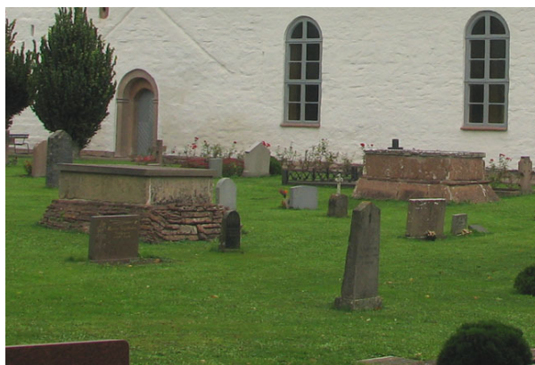
De två gravtumborna på södra sidan. Den äldsta närmast kyrkan är från 1600-talet (KI Råpplinge kyrkogård 68)