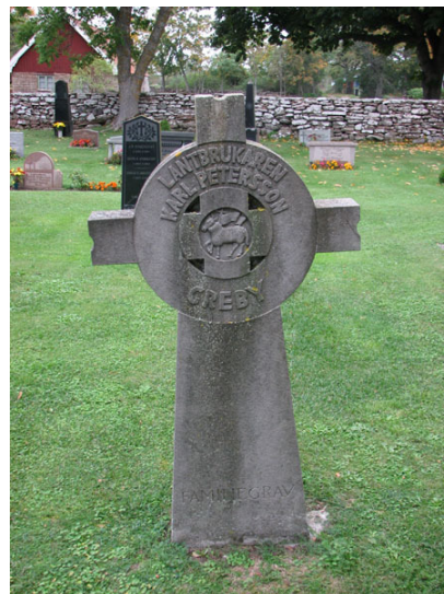
En vård i form av ett ringkors med Ölands landskapssymbol (KI Räpplinge kyrkog 090)