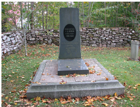
Gravtumba med stående vård över häradsskrivaren C G Hammar från år 1883 (KI Råpplinge kyrkog 050)