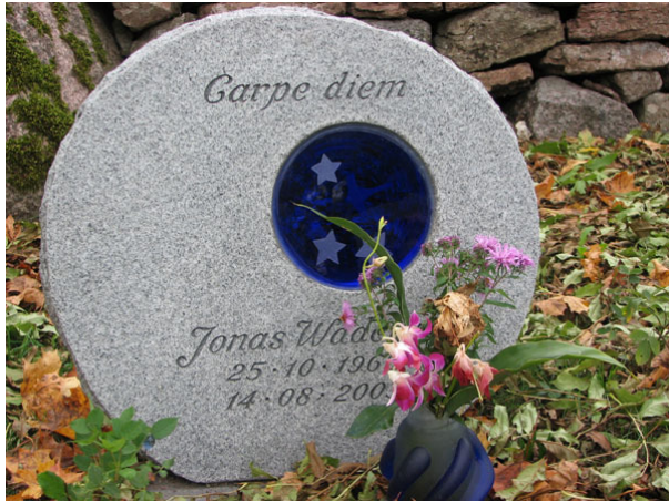
Carpe diem- fånga dagen. Ett exempel på de moderna, friare gravvårdarna (KI Råpplinge kyrkog 021)

och ett kors är av trä båda ifrån 1980-talet. För övrigt är grå granit och kalksten de vanligast förekommande materialen. En del vårdar av svart eller röd granit förekommer också. Den äldsta vården i området är en grå granitvård från 1919. Det kan tyda på att den norra sidan inte använts som begravningsområde förrän under tidigt 1900-tal. Vårdar finns i övrigt från 1900-talets alla årtionden men vårdar från 1940-talet samt från 1980-talet och framåt dominerar. Den förste som gravlades i urlunden begravdes 1995