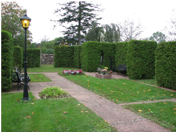
Minneslundan omgärdas av tujahäckar och har gångar av kalksten (KI Räpplinge kyrkog 011)