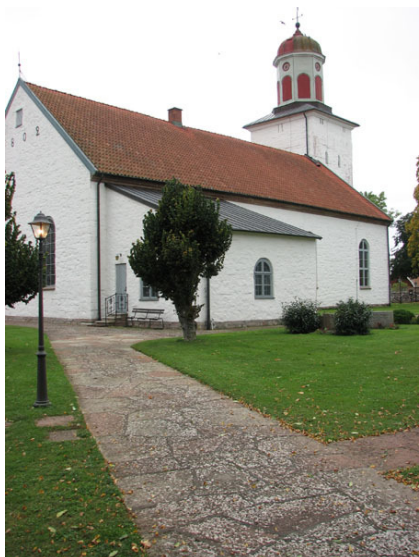
Alla gångar är belagda med kalksten (KI Råpplinge kyrkogård 114)