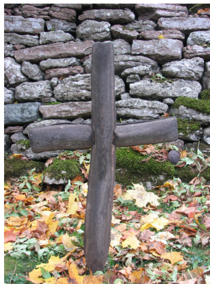
Ett enkelt, modernt, träkors norr om kyrkan rest 1989 (KI Råpplinge kyrkog 019)