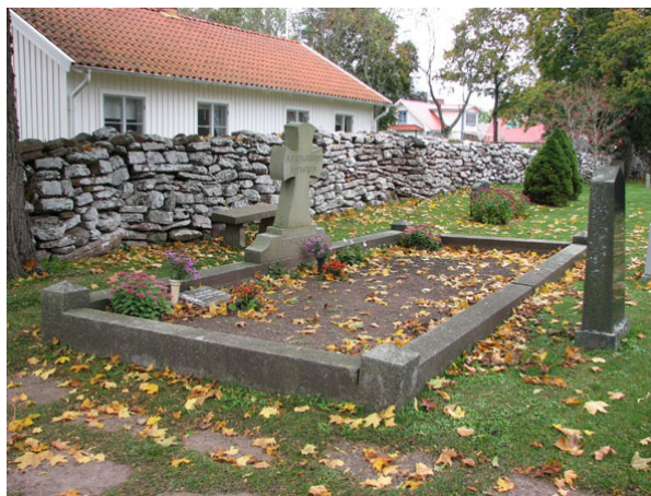
En av kyrkogårdens fyra gravplatser som fortfarande har omgärdning och jordyta bevarad (KI Råpplinge kyrkog 040)