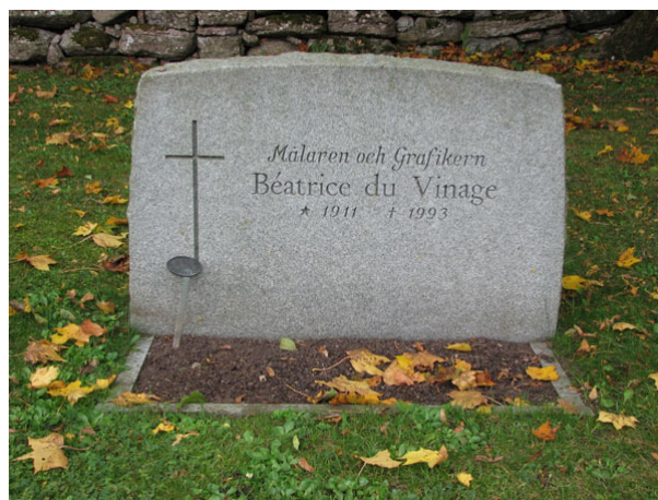
Målaren och grafikern Béatrice du Vinage är begravd på den östra sidan av kyrkogården (KI Råpplinge kyrkog 047)