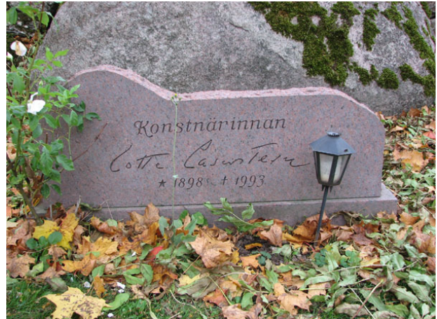
Konstnärinnan Lotte Laserstein är begravd på Råpplinge kyrkogård

Den dödes yrkestitel finns angiven på endast fem av vårdarna på den norra sidan. De titlar som förekommer är hemmansägare, konstnärinnan, byggmästaren, lantbrukaren och kyrkvården. Ortnamn förekommer på ungefär hälften av gravvårdarna.