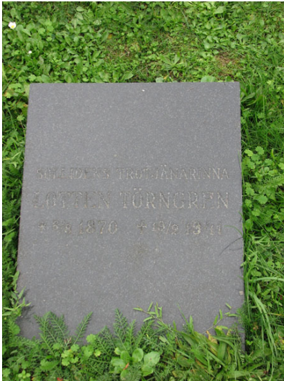
Sollidens trotjänarinnan, Lotten Törngren fick en liten anspråkslös vård år 1941 (KI Räpplinge kyrkog 063)

vilar hovpredikanten och kyrkoherden i Högsrums och Räpplinge församlingar, A Beringer. Tre gravplatser har omgärdningar kvar. Två har stenram och en med järnstaket med pollare av sten. Ytorna på dessa gravplatser är fortfarande täckta med jord/grus. Vid flera av gravplatserna, öster om kyrkan, är det planterat buskar av olika typer som till exempel tujor, rhododendron, sockertoppsgranar och perenner.