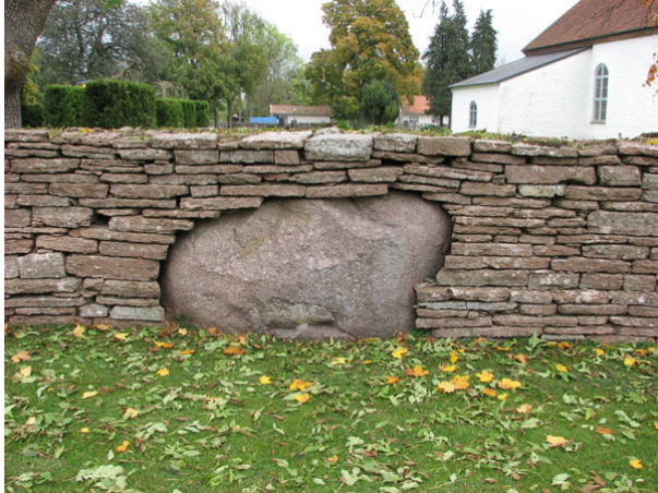
I kalkstensmuren i väster finns inslag av natursten. Här en ovanligt stor sten (KI Råpplinge kyrkog 003)