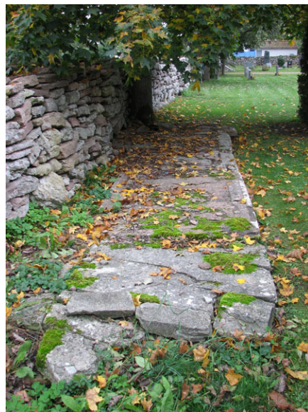
Hällarna intill norra muren är så förstörda så det inte går att läsa vad som står på dem. (KI Räpplinge kyrkog 013)