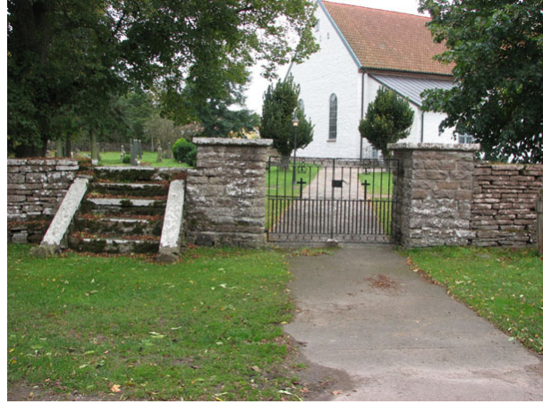
Intill den norra ingången finns en klivstätta över muren (KI Råpplinge kyrkog 005)