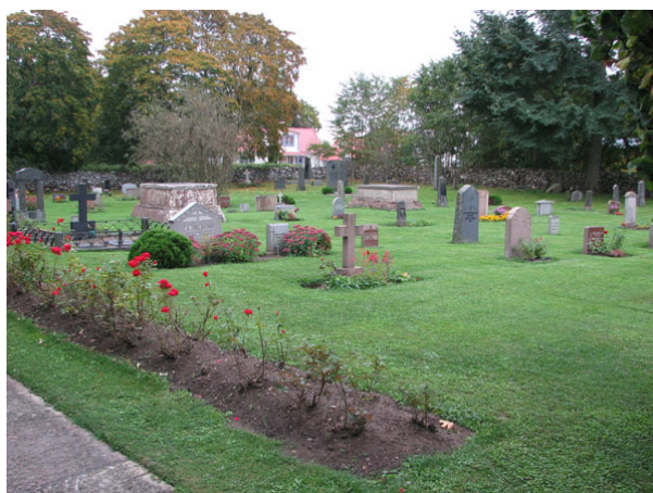
Översikt över södra området från nordväst (KI Räcklinge kyrkog 110)