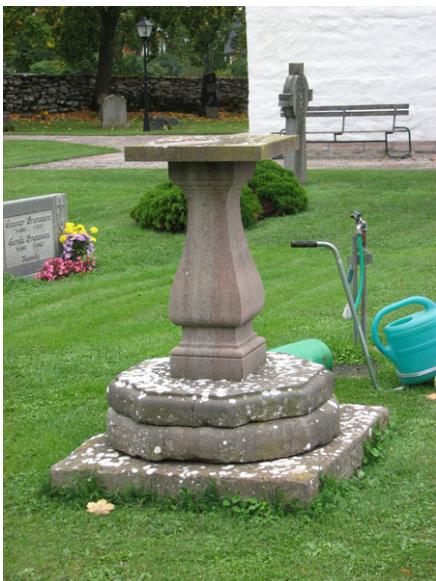
Solur av kalksten (KI Räpplinge kyrkog 089)