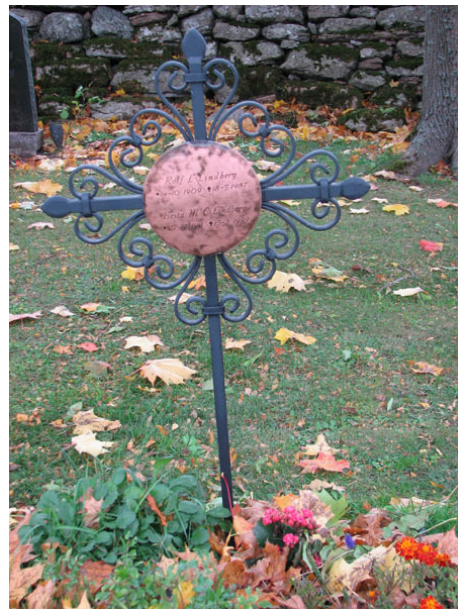
Smidesvård med kopparplatta rest över Rolf Lindberg och hans maka år 1987 (KI Råpplinge kyrkog 023)