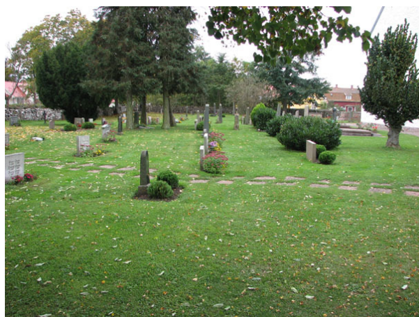
Översikt över området i öster från norr. Notera de oregelbundna raderna (KI Räcklinge kyrkog 034)

Östra och södra delen av kyrkogården utgörs av sammanlagt 904 gravplatser. Området avgränsas i öster och söder och delvis i norr och väster av kyrkogårdsmuren. Kyrkan utgör i övrigt den norra gränsen. Intrycket av området domineras av de höga, stående vårdarna i både plankputsad svart granit men också kalksten. Många av vårdarna är påkostade i sin utformning och här finns ett flertal gravtumbor. Vårdarna är vända mot öster och väster och de flesta står i gräsmatta.