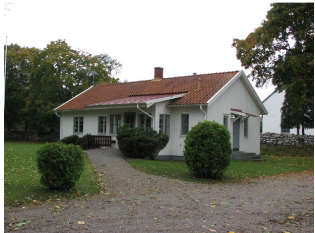
Utanför kyrkogården i sydväst ligger Kyrkstugan uppförd 1989 (KI Räpplinge kyrkog 006)