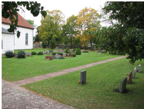
Översikt över norra sidan av kyrkogården (KI Råpplinge kyrkog 029)

Området norr om kyrkan består av närmare 200 gravplatser. Området avgränsas i väster och norr av kyrkogårdsmuren. I söder finns kyrkan och i öster utgörs begränsningen av kalkstengången. Gravvårdarna är placerade i rader och vända mot öster eller väster. Alla vårdarna står i gräsmatta. Intill muren i nordväst ligger kyrkogårdens nyaste tillskott, minneslunden som invigdes 1992. Öster om minneslunden och intill kyrkogårdsmuren är ett urngravsområde anordnat och här är alla vårdar vända mot söder. Berget går så högt att det är svårt att anlägga kistgravplatser i området.