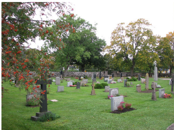
Översikt över västra delen av området från nordost (KI Råpplinge kyrkog 086)