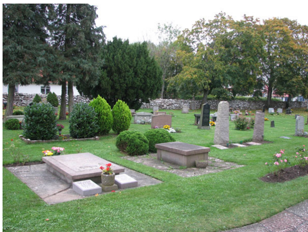
Gravtumban till vänster är rest över hovpredikanten och kyrkoherden Anders Berninger och till höger vilar slottsfogden av Solliden Gustav Rydén (KI Råpplinge kyrkog 059)

Området har använts under lång tid vilket gör att det finns en blandning av gravvårdar från olika tider och olika former och material. Ett stort antal vårdar är korsformade, men här finns också ett stort antal låga rektangulära vårdar med klassicistiska drag. De modernare vårdarna har friare former som till exempel natursten och hjärtformade vårdar. Övervägande delen av vårdarna är stående med det finns också ett antal liggande.