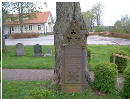
Gjutjärnsvård från 1874.