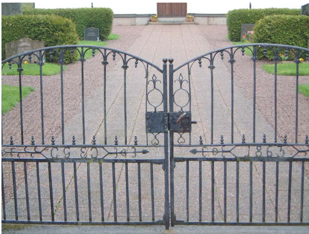
Grind från 1863.

Söder: enkelgrind i järnsmide med konvext krön. Utformningen liknar västra grinden. Det finns dock inget årtal eller initialer. Fyrkantiga grindstolpar av granit med svagt avfasat krön.