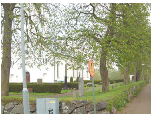
Kyrkogårdens södra del från sydväst.

En rad med gravar ligger invid muren på gamla kyrkogården, i norr invid den gamla norra begränsningen. På gamla kyrkogården i övrigt går gravraderna i nord/sydlig riktning utom norr om kyrkan där det är två rader som går i väst/östlig riktning. På den gamla kyrkogården finns relativt höga rygghäckar av tuja utom i norr. Detta ger en rumslig indelning av kyrkogården, som understryks av trädkransen av framför allt kastanjetråd. Området norr om kyrkan är mer öppet. Här finns som tidigare nämnts inga rygghäckar, men här finns inte heller en trädkrans. Runt kyrkogårdsmuren finns en del större familjegravar med höga gravvårdar. Den nya kyrkogården invigdes 1950 norr om den gamla kyrkogården och ligger lägre i terrängen. Den ansluter till gamla kyrkogården genom en slänt. Mur saknas. Nya kyrkogården har en enhetlig utformning med höga rygghäckar av tuja och med övervägande låga och breda gravvårdar. Gravraderna går här i väst/östlig riktning utom längst i väster och öster.