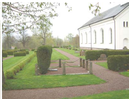
Kyrkogårdens norra del från väster.