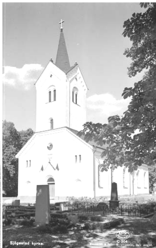
Fotografi från omkring år 1900 respektive 1944.