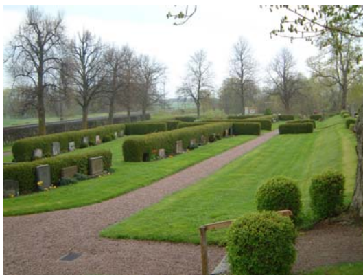
Nya kyrkogården från sydväst.