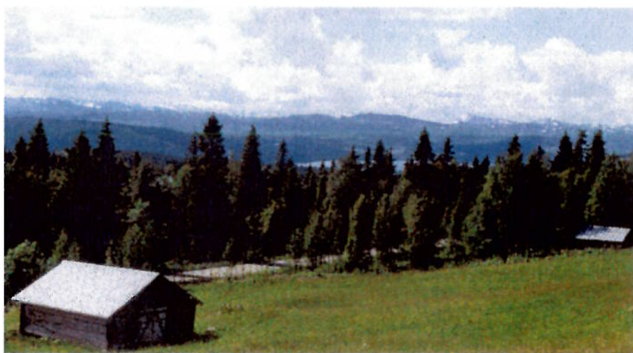
Myhrbodarna 2000-07-10.