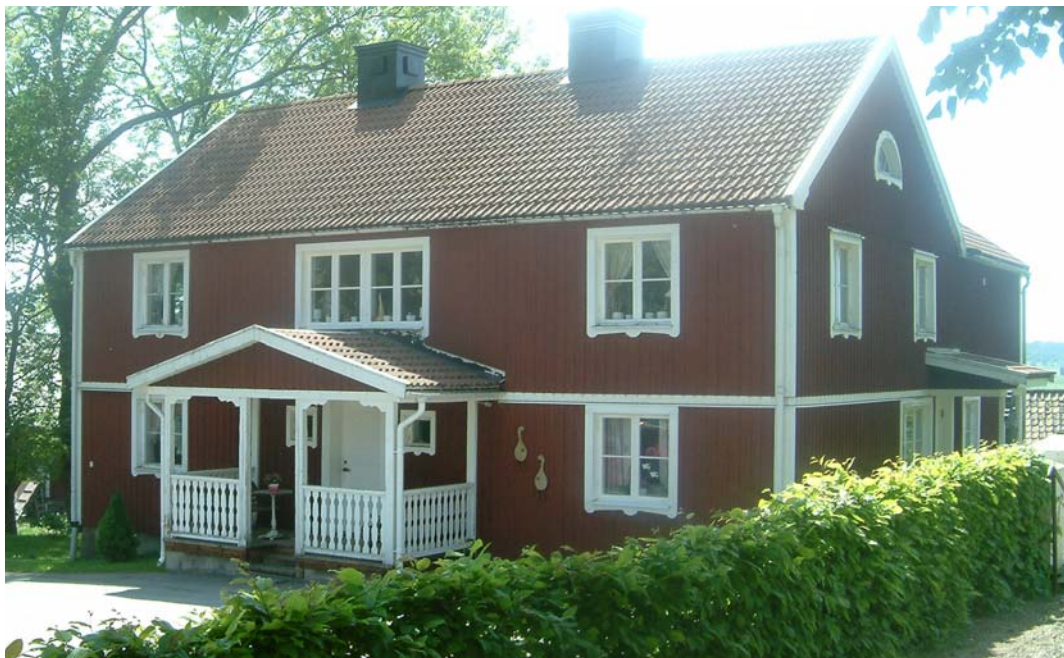
F.d. skolhus och fattighus, ligger på kyrkans södra sida.