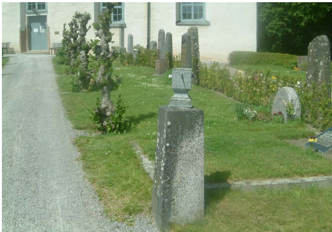
Kvarter D, öster om den södra huvudgrusgången. I förgrunden ett solur från 1785.

Runt kvarteret löper en asfalterad gång. I söder ansluter kvarteret till gravkapellet.