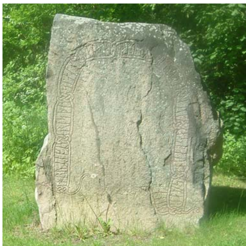
Runstenar på Styrstads kyrkogård. De har Brate nr 153 och 154. RAÅ nr Styrstad 32:1, 32:2.