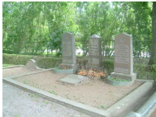
D 14 från 1906 samt nr 29 från 1881.