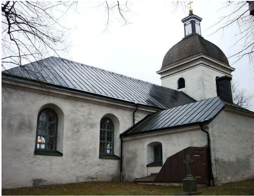
Kvarter E, norra sidan av kyrkan.