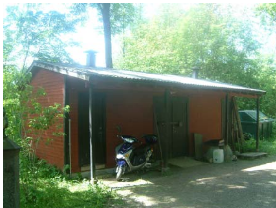
Gravkapell och arbetslokal.