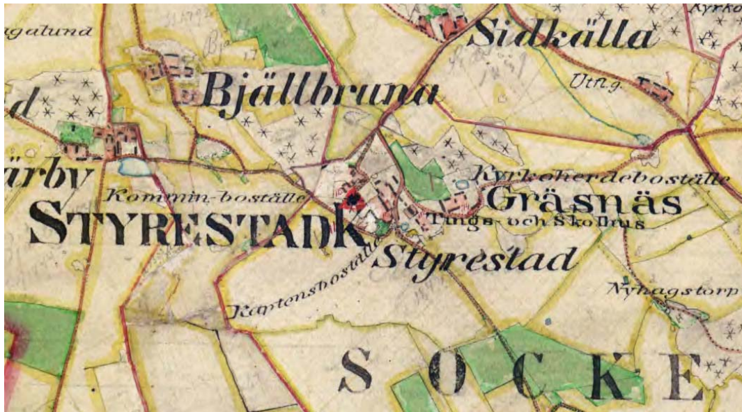
Utsnitt ur den häradsekonomska kartan från 1870-talet.