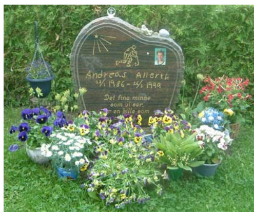
Exempel på två av de sju gravvårdar för omkomna i bussolycka 1999. Nr A 63 och 72.