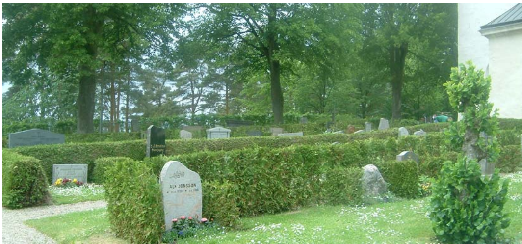
Kvarter B, 3dje kvarteret.