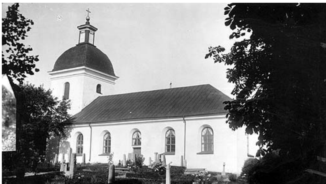
Styrstads kyrka.

En fullständig beskrivning och historik av kyrkan redovisas i separat rapport från utförd kyrkoinventering.