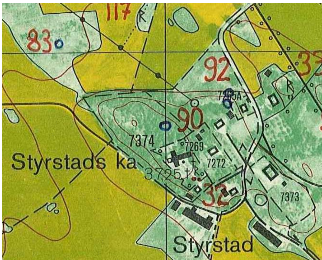
Utsnitt ur ekonomiska kartan blad nr 086 85 Styrstad, 1981. Kyrkan ligger på en höjd i en uppodlad omgivning.