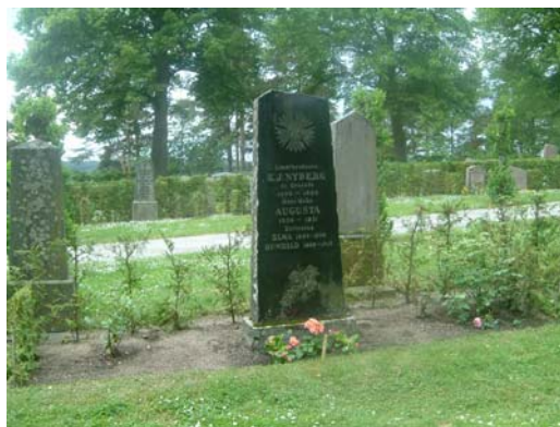
D 14 är exempel på en högrest gravvård.