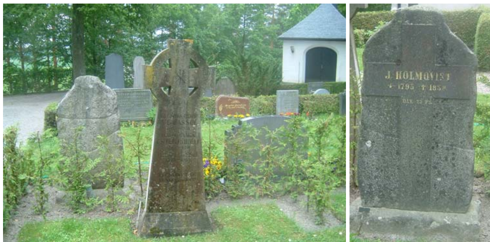
Ex på gravvårdar i kvarter E. Närmast nr 44 från 1911. Den äldsta gravvården på ursprunglig plats, nr 35, från 1838.

Kvarteret innehåller kyrkogårdens äldsta gravvård på ursprunglig plats, nr 35 J Holmqvists, från 1839. Annars finns en blandning av yngre låga breda vårdar och höga smala äldre. Två stenramsgravar med sandfyllning och en sandgrav omgiven av en låg tujahäck finns. Tre prästgravar med kors finns, en av dessa är ett keltiskt kalkstenskors. Ett modernt järnkors finns också. En stor del av gräsytona har ännu inte tagits i anspråk för gravvårdar.