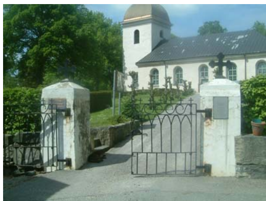
Den södra grinden.

I öster mot församlingshemmet finns en enklare öppning i staketet med en grusgång. I nordöstra hörnet har en grind stått, av denna återstår en smal sexkantig grindstolpe krönt av ett kors. Numera är här bara en enkel öppning.