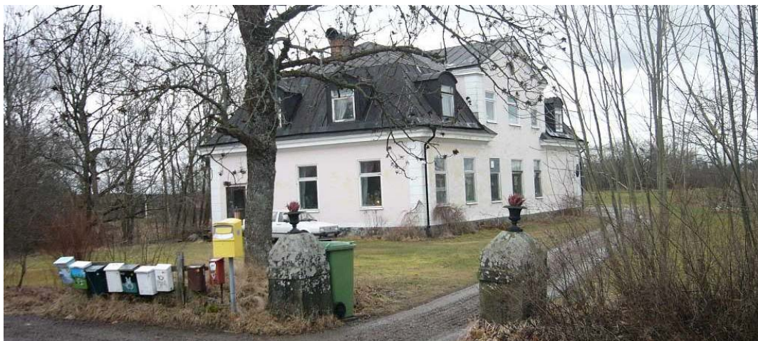
F.d. skolhus, tingshus och arrestlokal från 1793.