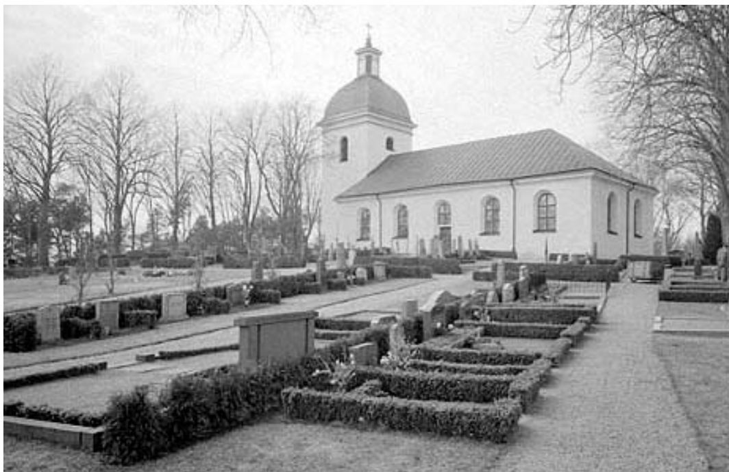
1965, södra sidan.

1966 renoverades kyrkan invändigt. Då man bröt upp det murkna trägolvet, fann man flera gravhällar från 1600-talet. De har troligtvis legat som golv i den äldre kyrkan som revs när den nya byggdes 1782. Skelettdelar hittades när golvet bröts upp. På 1600-talet och längre tillbaka i tiden kunde folk ur de högre samhällsklasserna få begravas inne i kyrkan. Ända till början av 1800-talet var det tillåtet med begravingar inne i kyrkan. På en av hällarna står det Pher Bengdtson och min hustru Ingeredh Ingesdoter sofver här efter Guds behag. Mädh min kiäraste til domedagh 1672 mädh mine 8 barn. En annan häll berättar om Nicolaus Ascanius som var kyrkoherde i Styrstads församling i mitten av 1600-talet.