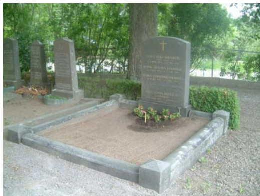
Nr D 28, är en omgärdad sandgrav.

Inom kvarter E finns flera äldre gravhällar i kalksten. Flera av dem är från 1600-talet och har legat inne i kyrkan tidigare. De är alla svårlästa och i dåligt skick. En inte så vanlig gravvård är nr E 44, det är ett högt keltiskt kors, äldsta datering 1911. Det är inte så stor andel av gravvårdarna som har någon form av titel. De mest förekommande titlarna är "Lantbrukaren" och "Hemmansägaren". "Kyrkoherden" och "Nämndemannen" förekommer också på flera av gravvårdarna. Utöver äldre, kulturhistoriskt intressanta gravvårdar, finns också flertalet yngre, moderna vårdar. Utmärkande är de vårdar över sju tonårspojkar som omkom i en bussolycka 1999. Dessa står bredvid varandra och är försedda med diverse sportsymboler och fotografier.