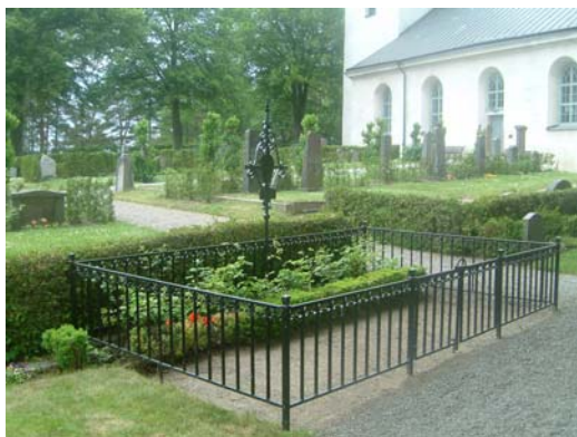
Gravvård nr C 45.