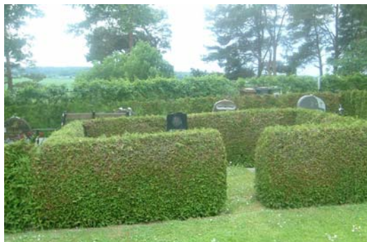
Exempel på omgärdade gravar, nr A 93 och 92.