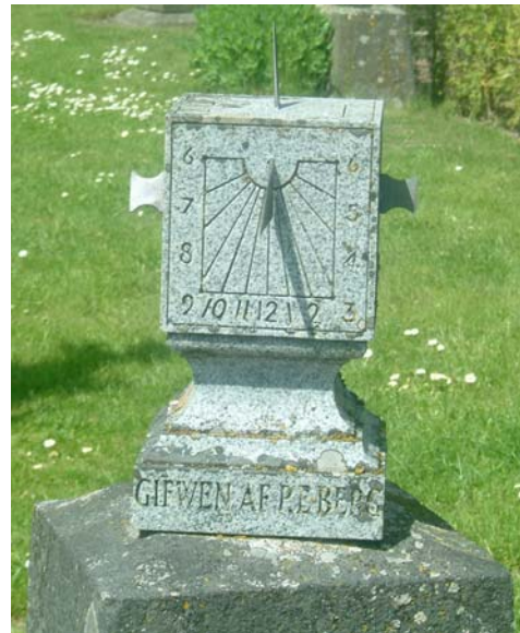
Solur från 1785.