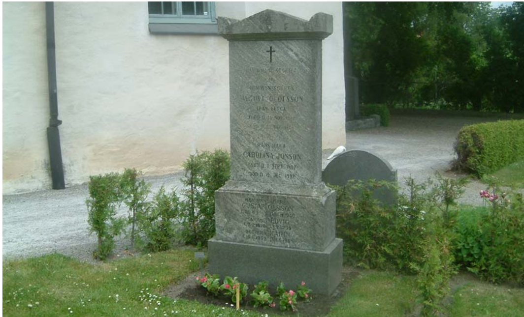
Gravvård nr D 10 från 1864.

I nordväst finns en stele av kalksten. I övrigt finns en relativt jämn blandning av höga smala äldre och låga yngre vårdar.