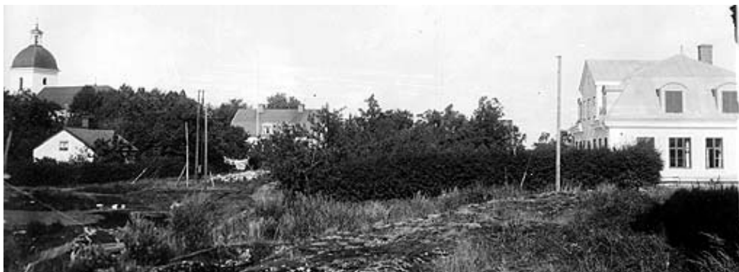
Foto över omgivningarna vid Styrstadskyrka 1931. Byggnaden i det sydöstra hörnet har fungerat som skolor, tingshus och arrestlokal.