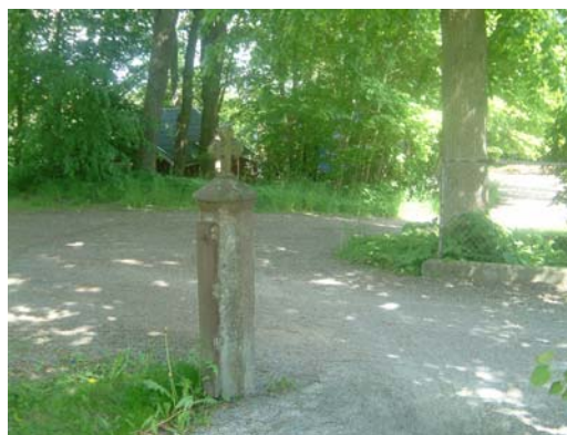
Grindstolpe i nordöstra hörnet.

Huvudingången finns i söder, här finns en rikt dekorerad pargrind i järnsmide mellan kraftiga putsade grindstolpar krönta av smideskors. Grindarna är utsmyckade i fyra nivåer med enkla spjälor, gotiska bågar, löpande hund och kors.