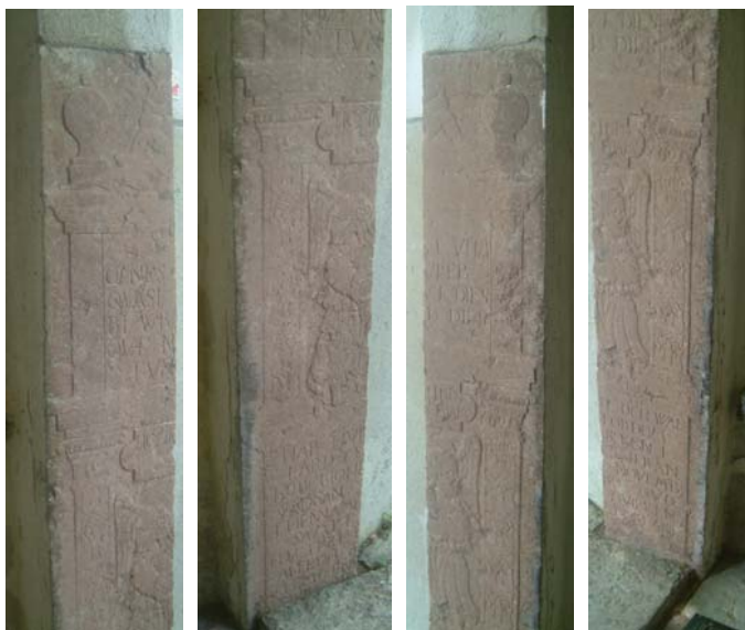
Dessa fyra delar av en, (eller flera?) klakstenshäll/är, är inmurade vid kyrkans västingång.

I kyrkans portal finns delar av äldre kalkstenshäll/är som klyfts på längden i fyra delar. Dessa står upprätta och omger ingången.