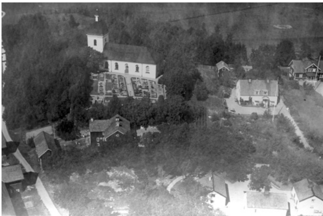
Styrstads kyrka 1935.