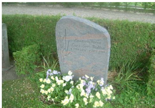
Exempel på äldre och sentida gravvård. Till vänster nr B från 1912 samt nr 3 från 1994.