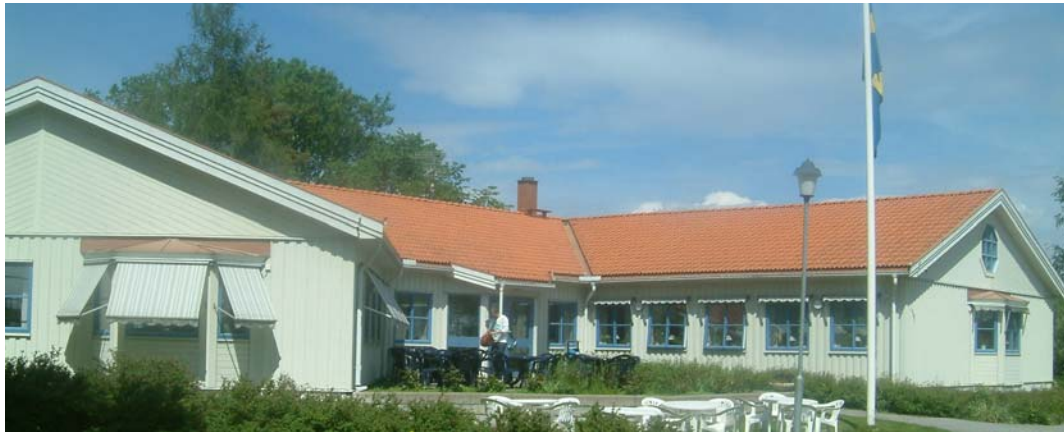
Församlingshemmet Styrstadsgården byggdes 1983.