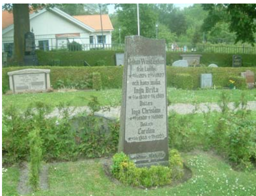
Gravvård nr C 8.