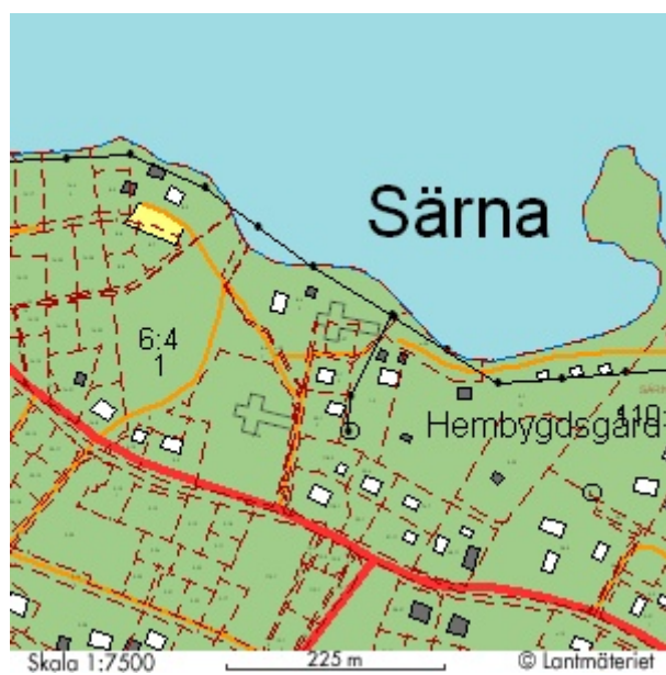
Särna gamla och nya kyrka