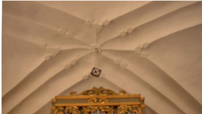
Detaljfoto av de för byggmästarsläkten Romberg typiska ribbvalven med utskjutande koppstenar.

Under de första 100 åren var kyrkans inredning i stort sett oförändrad, men under 1850-talet försågs den med ny altartavla och predikstol samt målades om. Valvens hållbarhet har diskuterats vid åtskilliga tillfällen genom tiderna. Redan under 1760-talet sattes järnband in för att hålla samman valven. Kyrkan var under lång tid även rivningshotad, sedan ett kungabrev utfärdats år 1866 med beslut om att Bjuråkers församling skulle uppföra en ny kyrka i byn Våtmor som ligger i socknens geografiska mitt.