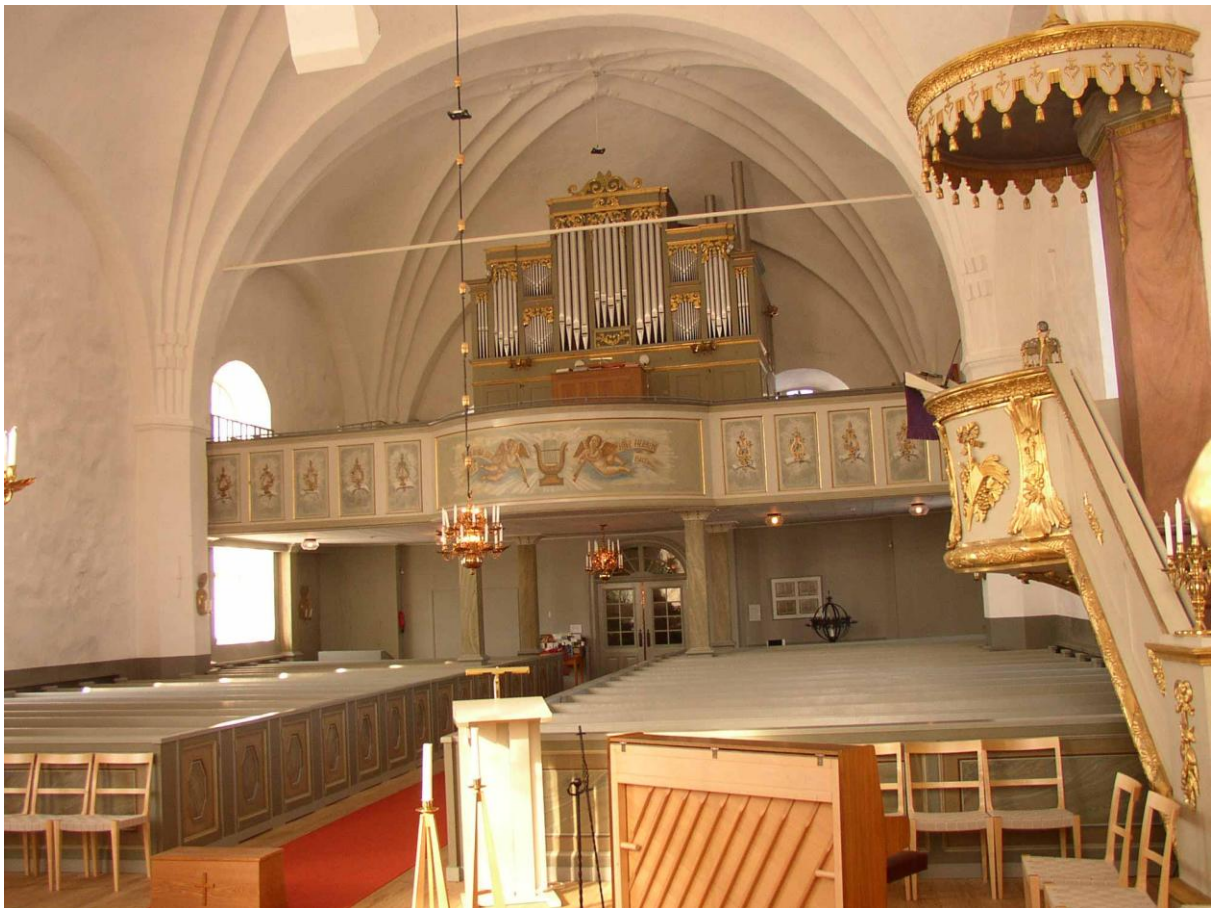
Kyrkorummets västra del.

Kyrkorummets väggar är gråmålade upp till fönsterbröstningshöjd och däröver vitmenade, och väggarna under läktaren som är gråmålade. Korväggens nedre del täcks av en draperimålning upp till fönsterbröstningshöjd. Altartavlan har samma form som kyrkans fönster med rundad överdel och den omgärdas av förgyllda pelare som kröns av änglahuvud samt brinnande facklor. Altaret tillkom 1889 och altarringen, från samma år, är rak med sneda hörn. Predikstolen med tillhörande ljudtak i nyklassicistisk stil är placerad på den norra väggen vid den första och andra valvtravéns anfang. På väggen ovanför dörren till sakristian sitter ett medeltida altarskåp, vilket tillhört den medeltida kyrkan och som fram till år 2000 var deponerat i Hälsinglands museum. Bänkinredningen är sluten och uppdelad i två större kvarter. Läktarens orgel, med delar från 1700-talet, och fasad i klassisk stil står centralt placerad på läktaren.