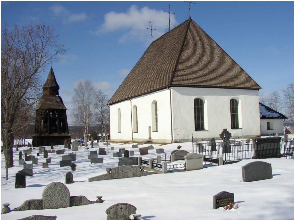
Bjuråkers kyrka och klockstapel från sydost.