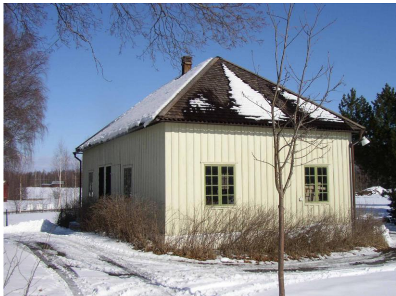
F.d. bårhuset från sydväst.