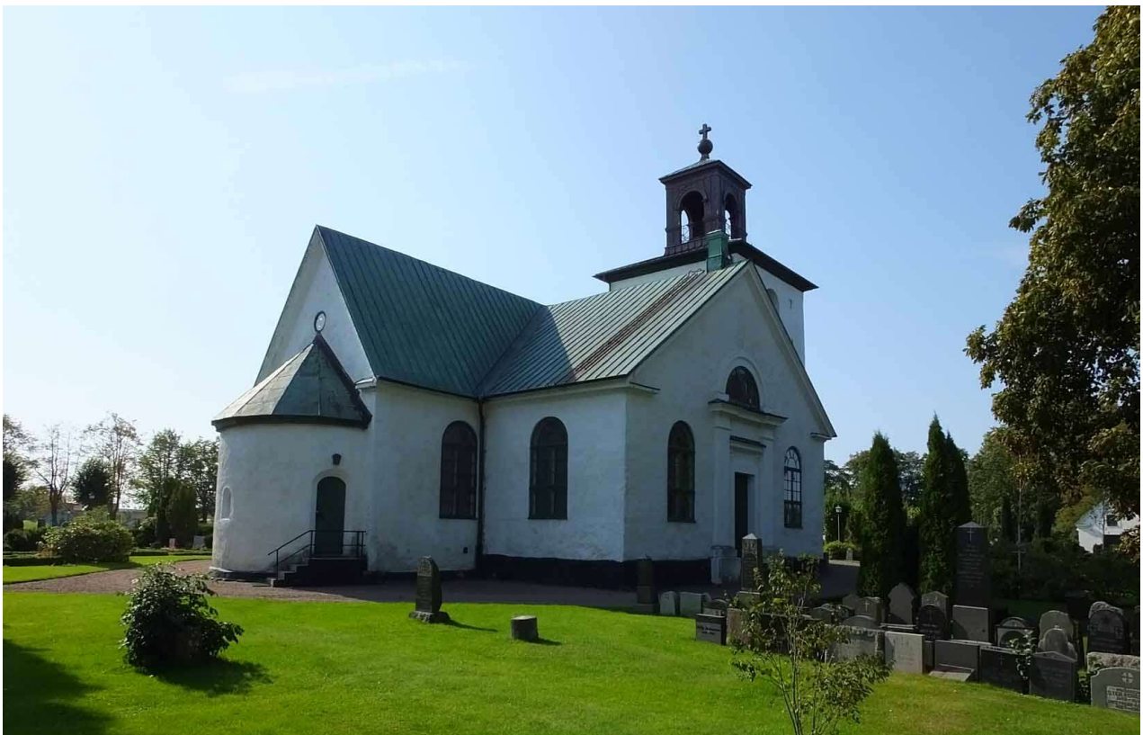
Fleninge kyrka sett från nordost.

Ortsnamnet Fleninge härstammar från järnålder före vikingatid då man också förmodar att en permanent bebyggelse eller större gårdsenhet etableras på platsen. Ordet flen betyder bar eller naken och syftar troligtvis på det skoglösa, öppna landskapet. Fleninge ligger på en låg långsträckt höjdrygg som tidigare var omgiven av våtmarker. På 1700-talet bestod bebyggelsen av en relativt stor radby med gårdar längs höjdryggens norra sida och den södra sidan brukades som åkermark. Kyrkan låg längs en nord-sydlig vägsträckning, nuvarande västkustvägen, i norra utkanten av byn. Vid 1800-talets början var kyrkan omgiven av prästgård i väster, skolhus och fattigstuga i söder och klockarebostad norr om kyrkan. Nytt skolhus byggdes senare öster om kyrkan.