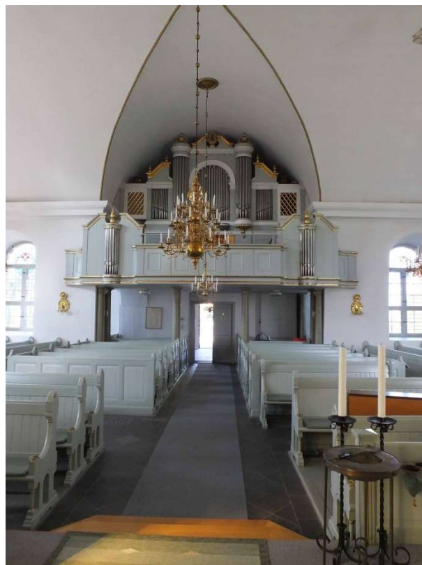
Absiden med romansk fönsteröppning i öster och kalkmålningar från 1300-talet. Till höger syns kyrkorummet sett från öster mot orgelläktaren.

Korgolvet som ligger några steg upp från långhuset har förlängts något mot korsmitten sedan 1800-talet. Koret upptas av altaret med altarring och altartavla. Längs korets södra sida finns en trappuppgång i muren till predikstolen vid korsmittens sydöstra hörn. Predikstolens placering var föremål för diskussioner i samband med renoveringen på 1800-talet. Församlingen ville att den skulle placeras på norra sidan eftersom de sörjande enligt tradition i byn alltid var placerade i södra bänkkvarteret. Predikstolen flyttades dock från norra sidan till den södra och i det motsvarande nordöstra hörnet ställdes dopfunten för att ”bilda en symbolisk ställning till altaret”. Murpartierna i hörnen mellan korsarmarna och koret gjordes avskurna så att de nästan bildar nischer. Dopfunten har senare flyttats fram ett stycke och Thorvaldsens staty av den uppståndne Kristus har fått plats i nischen.