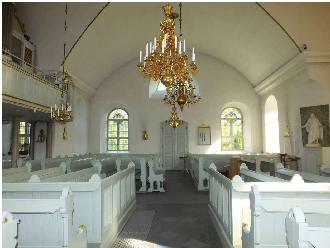
Kyrkorummet sett mot norra korsarmen.

Långhusets ursprungliga norra och södra yttermurar är nästan i sin helhet rivna med undantag för en liten del av långhuset som finns bevarad i väster intill tornet. Västra långhusdelen upptas av en orgelläktare med trappuppgång längs långhusets västra sida. Läktaren bärs upp av marmorerade kolonner med en fyllningsförsedd läktarbarriär målad i grågröna toner. Långhuset och korsarmarna är möblerade med bänkar i nygotisk stil, ordnade i kvarter vid sidorna och mittgångar. Gångarna är lagda med plattor av komstakalksten. Väggarna i kyrkorummet är putsade och vitmålade och täcks av två trätunnvalv som skär varandra i korsmitten. I övergången mellan vägg och valv finns kraftiga profilerade listverk och i valvkrönen förgyllda takrosetter. Snickerierna är övervägande målade i ljusgrått och grågröna toner med förgyllda detaljer. Kyrkans interiör accentueras av de stora ljusöppningarna med glasmålningar i jugendstil i form av blomstermotiv, textband och olika kristna symboler.