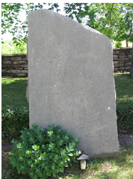
Konstnären Per Ekströms gravvård rest 1935 (KI Segerstads kyrkog 072)