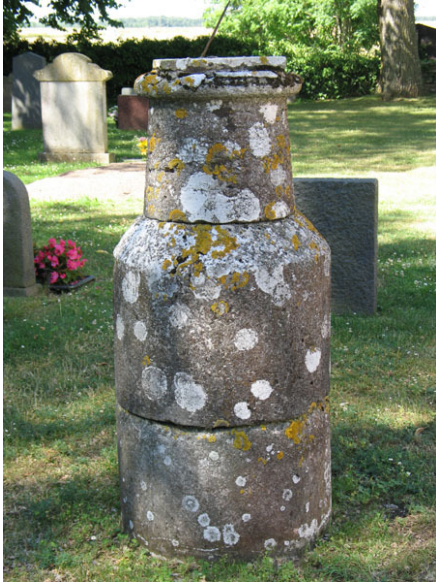
Solur av kalksten i kv A, delar av 1100-tals kyrkan (KI Segerstads kyrkog 038)