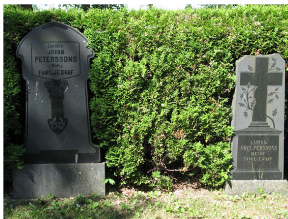
Två svarta blankpolerade, tidstypiska, granitvårdar över två lantbrukarfamiljer från Mellby, kv B (KI Segerstads kyrkog 048)

I kvarteren anges den dödes yrkestitel på en mindre del av vårdarna. De vanligaste är hemmansägare och lantbrukare. Övriga titlar är korpralen, sjökaptenen, skräddaremästare, smedmästaren, nämndemannen, nämndemannens dotter, fyrmästare, handlanden, kopparslagaremästaren, åldermannen och hemmansägaren. By-/gårdsnamn anges på merparten av vårdarna.