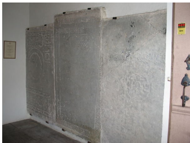
Gamla gravhällar, från 1600- och 1700-talen, hänger på väggarna inne i vapenhuset (KI Segerstads kyrkog 013)

uppbyggnaden med parställda pelare samt de raka eller flackt trekantiga krönen. På de flesta kyrkogårdar infördes regler för hur höga gravvårdarna fick vara. Från slutet av 1950-talet och framåt blev gravvårdarna enklare och mer enhetligt utformade. Vårdarna är rektangulära med ett enkelt kors eller blomsterslinga som dekor. På 1970-talet började man att dekorera gravvårdarna med talldungar och uppgående solar. Under 1990-talet kan man se en uppluckring av bestämmelserna kring gravvårdarnas utformning. Idag är formerna mer varierande och ofta mjukare. Under 1900-talets första hälft var det vanligt att man omgärdade gravplatserna och belade dem med grus. På Segerstads kyrkogård har funnits omgärdningar i form av häckar och stenramar. Idag finns endast enstaka rester kvar av detta. Under 1900-talets första hälft var det också vanligt att ange den dödes yrkestitel på gravvården. På Segerstads kyrkogård finns gravvårdar med titlar men inte i någon större omfattning. Titlarna försvann i det närmaste i mitten av århundradet. På landsortskyrkogårdar har det under hela 1900-talet varit vanligt att ange från vilken by eller gård den döde kommer. På Segerstads kyrkogård finns det angivet på majoriteten av vårdarna.