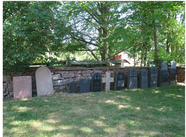
Vårdar som plockats bort står uppställda längs den norra muren (KI Segerstads kyrkog 064)