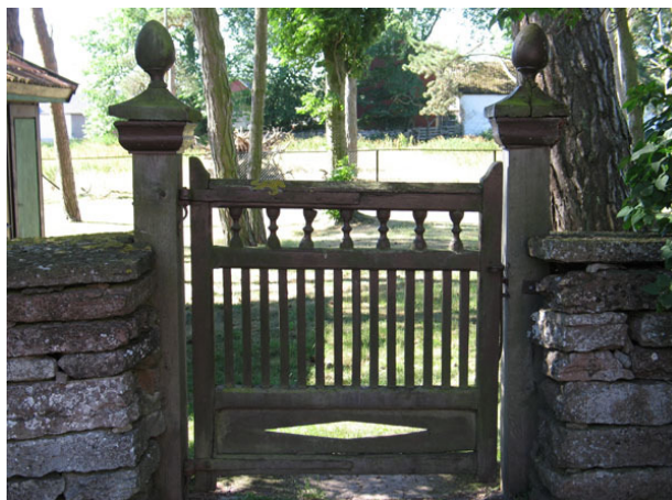
En enkel trägrind leder in till kyrkogården i söder (KI Segerstads kyrkog 016)