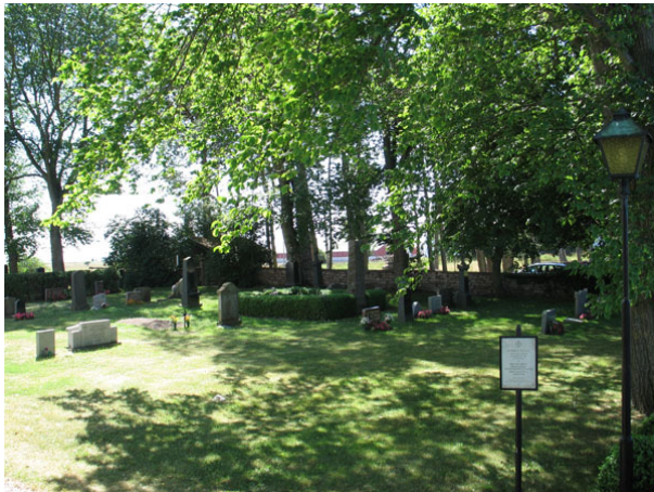
Översikt över kvarter A från NV (KI Segerstads kyrkog 019)