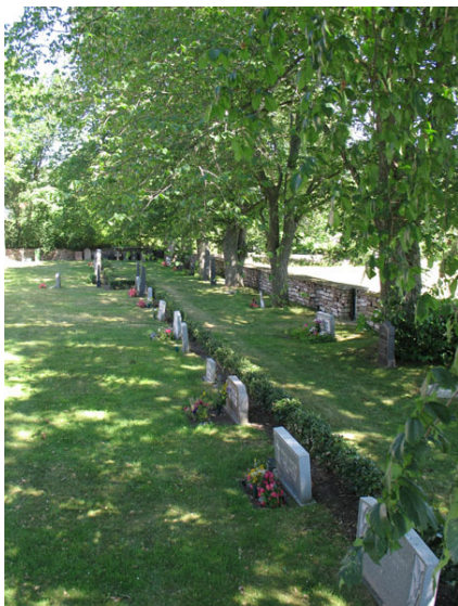
Översikt över kv C från SV (KI Segerstads kyrkog 076)