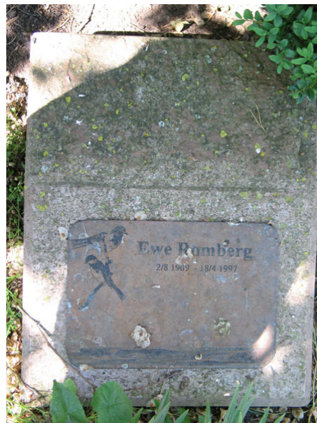
Liggande vård med kopparskylt (KI Segerstads kyrkog 057)