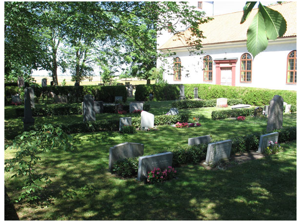
Översikt över kv B från SO (KI Segerstads kyrkog 043)