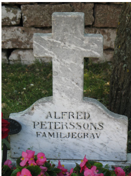
En marmorvård finns på kyrkogården, kv C (KI Segerstads kyrkog 081)

De tre gravkvarteren har samma karaktär med gravvårdar stående i rader i gräsmatta. Här finns en blandning av gravvårdar från olika tider. Flera av dessa har ett stilhistoriskt och/eller hantverksmässigt värde. Hos enskilda gravvårdar finns också lokal- och personhistoriska värden att värna dels genom de titlar som finns angivna, dels genom den kunskap som finns om en del av de gravsatta. Gravvårdar från mitten av 1800-talet och äldre ska föras in på församlingens inventarieförteckning. De omgärdade gravplatserna bör bevaras. De utgör resterna av en utsmyckningstradition som idag är borta.