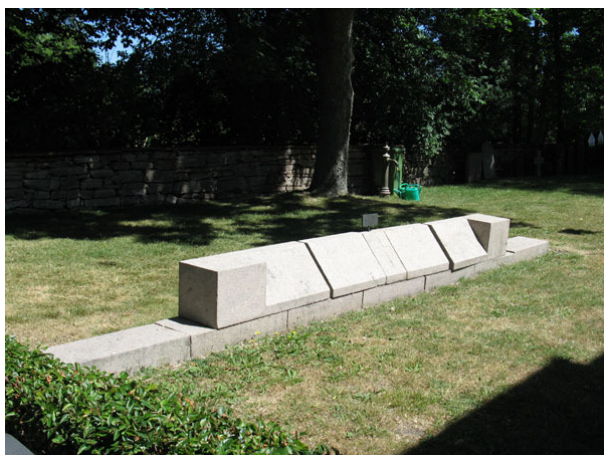
Minnesmonument över de brittiska sjömän som dog strax efter 1:a världskriget (KI Segerstads kyrkog 096)

I kvarteret finns ett en så kallad gemensamhetsgrav över 14 engelska sjömän från minsveparen Catspaw, som förläste utanför Segerstad en stormig vinternatt strax efter första världskriget. Kvarlevorna flyttades dock till Göteborg på 1960-talet meddelar en skylt på engelska som finns på monumentet.