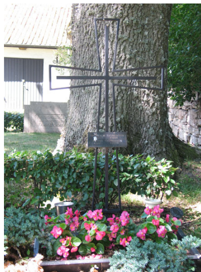
Översikt över kv D från SO (KI Segerstads kyrkog 086) Modern vård av järn, kv D (KI Segerstads kyrkog 095)