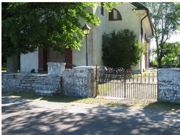
Svartmålad smidesgrind i väster. Notera klivstättan till vänster om grinden (KI Segerstads kyrkog 006)