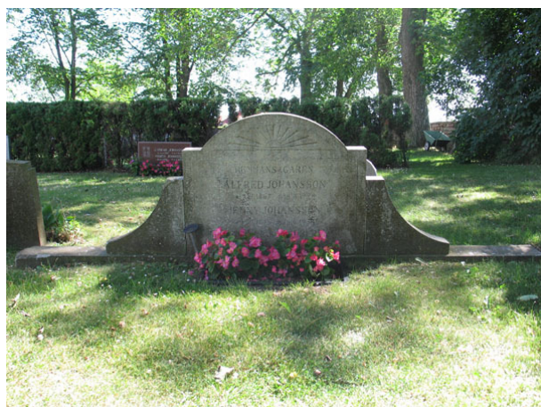
Bred kalkstensvård från 1930-talet (KI Segerstads kyrkog 033)

Som en del av nuvarande kvarter A finns kvarter F, se gravkarta. Kvarter F består av 5 gravplatser varav endast tre har kvar sina gravvårdar. Det var tidigare tänkt att vårdarna i kvarter F efter hand skulle tas bort. De vårdar som ingår i kvarter F behandlas i rapporten som en del av nuvarande kvarter A.