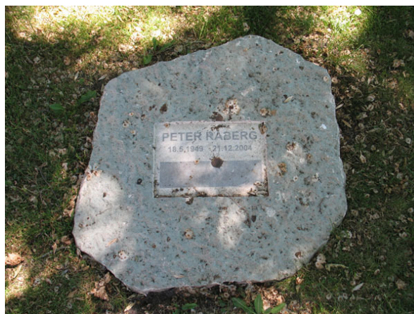
Modern, liggande, kalkstensvård (KI Segerstads kyrkog 079)