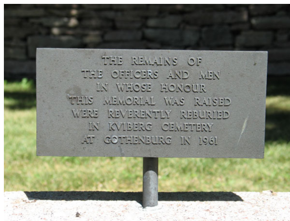
Skylden på minnesvården talar om att de inte längre ligger begravda här utan i Göteborg (KI Segerstads kyrkog 098)