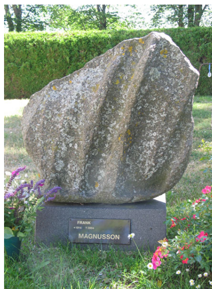
Naturen har format stenvården, rest 2004 (KI Segerstads kyrkog 035)