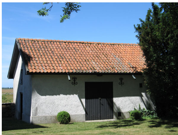
Före detta bårhuset ligger i kyrkogårdens nordvästra hörn (KI Segerstads kyrkog 088)