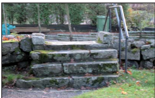
Vid det gamla församlingshemmet finns en trappa över muren