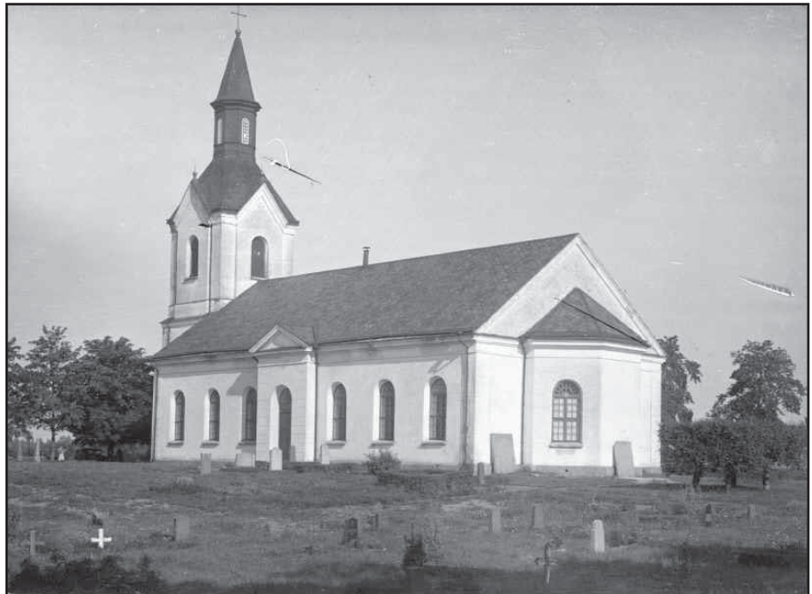
Ett äldre fotografi av okänt datum visar en mer ängslig kyrkogård utan strikt uppdelning i kvarter.

Rogberga kyrka stod färdig 1868. Den byggdes på en höjdplatå vid vägen mellan Jönköping och Nässjö, 16 meter norr om den gamla kyrkan som hade anor från medeltiden. Ritningarna gjordes av Ludvig Hawerman. Kyrkan är nyklassicistisk med rektangulär plan och tresidigt kor. Fasaderna är spritputsade med slätputsade lisener och omfattningar. Sadeltaket och tornets tak är täckta med kopparplåt.