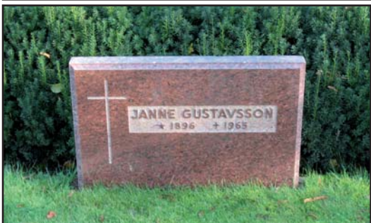
Gravvårdarna förändras under 1900-talets andra hälft mot en mer enkel och diskret utformning.