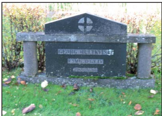
Ovan en typisk gravvård från mellankrigstiden med klassicerande element.

Gravvårdarnas ålder sträcker sig från 1872-2006 och antalet är relativt väl utspritt över 1900-talet med ett visst övertal från 1920-30-talen. Längst i väster, närmast kyrkoingången, finns flest äldre, stora och påkostade vårdar. Traditionellt har det området varit ett av de mer eftertraktade eftersom gravvårdarna här var som mest exponerade för kyrkobesökare. Under 1900-talet förenklades gravvårdarna allt mer och sociala skillnader utjämnades på kyrkogården. Den mest vanliga formen blev den låga och breda. Vårdarna från mellankrigstiden är utsmyckade med inspiration i klassicismen och kan vara flankerade av kraftiga kolonner eller så finns dekorationen inhuggen i stenen. Efterkrigstidens vårdar är ytterligare förenklade, de har fortfarande den låga och breda formen men dekorationen blir enklare tills den helt försvinner. Gravvårdar från 1990-talet och framåt har en mer asymmetrisk form, det blir dessutom allt mer vanligt med högpolerade vårdar. Tre grusgravar finns i kvarteret varav två med olika typer av järnstaket. Titlar är vanligt förekommande och visar på typiska äldre yrken i Rogberga med omnejd såsom: hemmansägare, stationsmästare, skräddaremästaren, organist