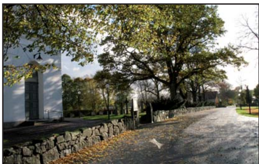
Kyrkogården omgärdas av en stenmur som i den norra delen fungerar som halvmur. Tillsammans med trädkransen av lind, lönn och ask är den ett viktigt och typisk drag för landsortskyrkogården.

I väst finns kyrkogårdens huvudingång med grindstolpar av huggen granit med konisk avslutning. Ingången har inga grindar. I öst finns en öppning i muren, vilken leder till församlingshemmet. Denna ingång används främst av kyrkogårdspersonalen vid arbeten på kyrkogården. Vid kyrkogårdens sydvästra hörn finns en trappa över muren, förmodligen har detta varit den närmaste vägen till det gamla församlingshemmet.