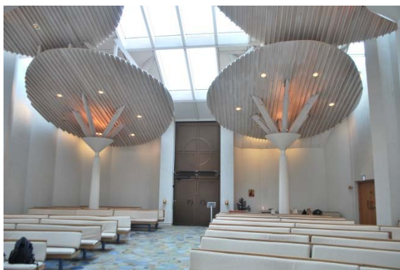
Kyrkorummet mot ingången i väster.

Det fristående fasta altaret av marmor belyses av takljuset. På södra sidan står glasdopfunten, dopträd, ambo och ljusbärare, på norra sidan ljusbärare och flygel. Orgeln står infälld i en nisch i muren i nordöst.