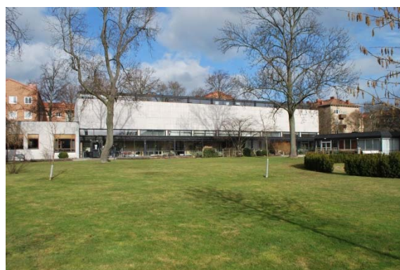
Församlingshuset, fasad mot söder.

Församlingshuset från 1957 är en rektangulär länga i två plan plus källare som är sammanbyggd med den lägre pastorsexpeditionen i ett plan. Dessa har fasader av vitgrå betongplattor, församlingshuset med en uppglasad utkragande bottenvåning som utgör korridor till övriga utrymmen. Norrsidan har stora glaspartier med vertikal