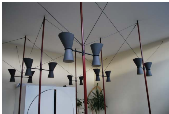
Armatur i kapprum i församlingshus.