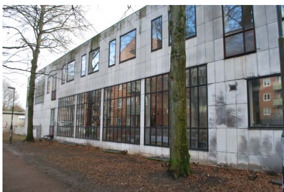
Församlingshuset, fasad mot norr.

Den låga förbindelsebyggnaden från 1983 har i fasaden glaspartier av aluminium som sitter i en synlig stålstomme av I-balkar. Taket är platt med en lutande taksarg av svart falsad plåt. Ingången till entréhallen är en dubbeldörr i aluminium.