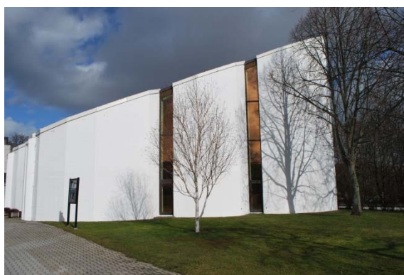
Kyrkans fasad mot söder.

Den låga förbindelsebyggnaden från 1983 har i fasaden glaspartier av aluminium som sitter i en synlig stålstomme av I-balkar. Taket är platt med en lutande taksarg av svart falsad plåt. Ingången till entréhallen är en dubbeldörr i aluminium.