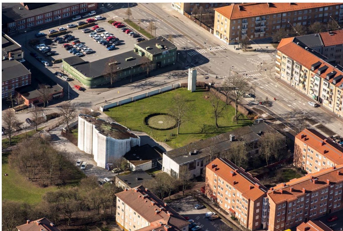
Från nordöst.

Kyrkoanläggningen ligger i bostadsområdet Annelund som gränsar till Sofielund i Malmö.