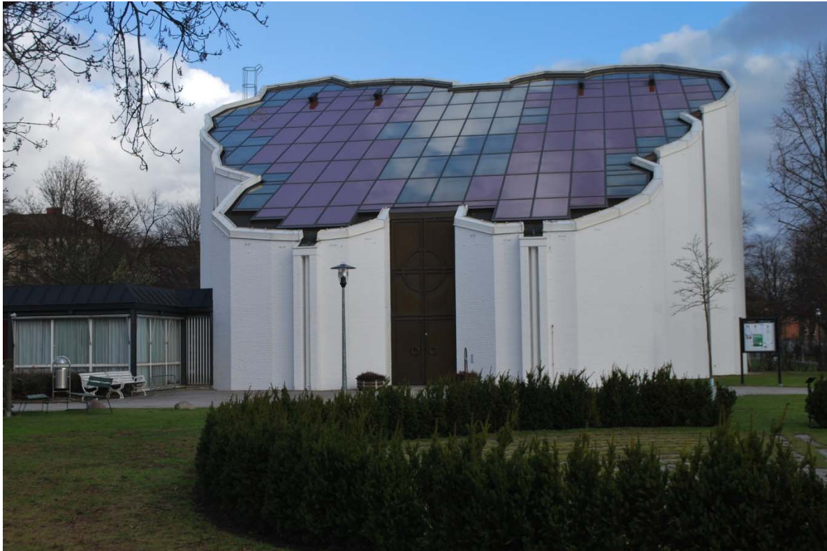
Fasad mot väster.