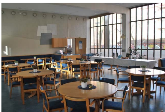
Församlingssalen mot nordväst.

Sakristian har klinkergolv och vävade, målade väggar. Längs en vägg finns inbyggda skåp för textilförvaring. Ett altare av kalksten och en piscina av rostfritt stål finns också i sakristian.