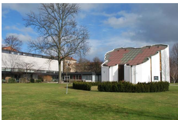
Från sydväst. Församlingshus, entréhall och kyrka.

Det brant sluttande pulpettaket har glaskassetter i bruna aluminiumprofiler. Taket stiger från fem meter i väster vid ingången till femton meter i öster. På ömse sidor om entrédörren finns stuprör av järn som är infällda i utkragade murade nischer. Ingångspartiet i väster går hela vägen genom muren från golv till tak. Dubbeldörren av brunlackerat aluminium är utförd som ramverk med slät plåtfyllning. Dörrarna har stora runda handtag av brons. Dörrarnas överstycke av aluminium är med mönster som bildar ett kors inom en cirkel. Insidan av ingångspartiet har samma utformning som på utsidan. Eftersom kyrkan saknar vindfång är en värmeridå uppsatt ovanför dörren på insidan. Kyrkan har två höga, smala glaspartier i söder från golv till tak med treglas isolerrutor i bruna aluminiumprofiler.