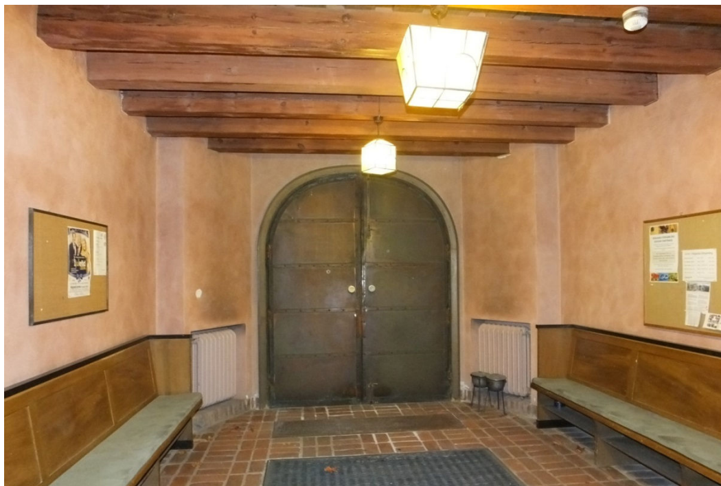
Vapenhuset i tornets bottenvåning.