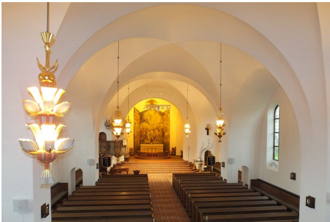
Kyrkorummet sett från orgelläktaren, mot öster.

I kyrkorummet, kyrkorådsrummet och i koret finns tidstypiska stolar bevarade. Korstolarna och stolarna i kyrkorådsrummet har läderklädda sitsar medan stolarna i kyrkorummet är av enklare karaktär.