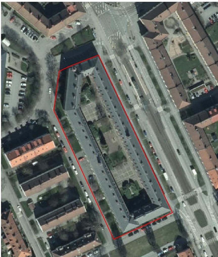
Byggnadsminnets utbredning med skyddsområdet markerat med heldragen linje. Gränsen för skyddsområdet sammanfaller med fastighetsgränsen.

Länsstyrelsen får ställa skäliga villkor för tillståndet. Villkoren får bl a avse hur ändringen ska utföras samt krav på dokumentation och antikvarisk kontroll och medverkan.