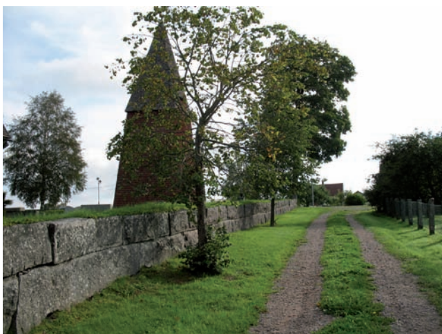
Trädkransen i söder av unga lindar

I nordvästra delen av kyrkogården finns ingen mur utan där är en ekonomibygnad placerad.