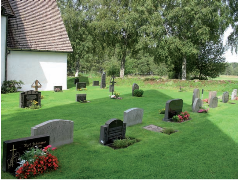
Figur till vänster visar en del av kvarter B.

Nedan olika gravvårdar som finns i kvarter B.