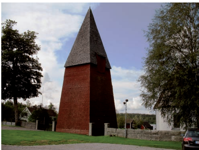
Vid klockstapelns i öster finns två ingångar med järnsmidesgrindar