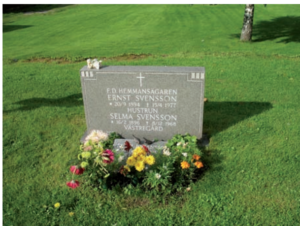
Överst: Vy över del av kvarter A. De mindre bilderna visar fyra gravvårdar från kvarteret. En högrest obelisk, ett träkors med namnskylt i koppar, en stor håll i diabas och underst en låg rektangulär gravsten i grå granit.