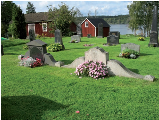
Härlövs kyrkogård ligger vackert vid sjön Furen. På bilden långa breda gravvårdar, låga rektangulära och högresta i kvarter A