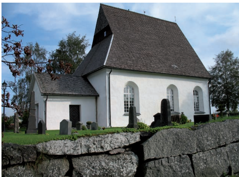
Kyrkan och kyrkogården från söder

På äldre fotografier över Härlövs kyrka och kyrkogård syns det att många av gravarna varit grusgravar prydda med en gravkulle täckt med förslagsvis murgröna eller vintergröna. Två gjutjärnskors var placerade i kvarter B strax nordväst om klockstapeln. När man jämför de gamla fotona med dagens kyrkogård upptäcker man att de äldre gravstenarna har försvunnit och ersatts av nya.