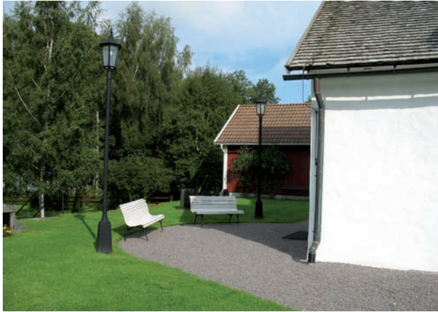
Gångarna på Härlövs kyrkogård är grusade. Bilden visar ett parti väster om kyrkan.