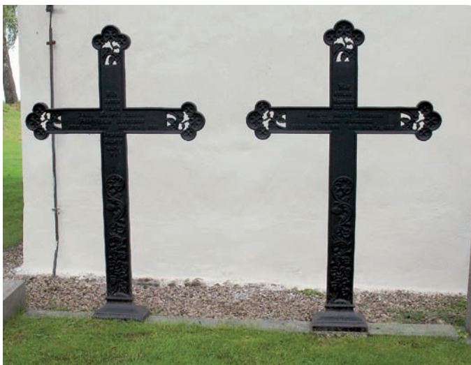
Äldre gravårdar som tagits ur bruk är placerade norr om kyrkan i kvarter C.