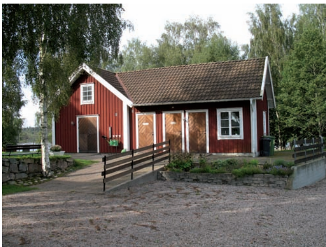
Ekonomibygnaden i nordvästra delen av kyrkogården

två enklare parkbänkar av trä och järn. Utanför grinden norr om klockstapeln är ett mindre område belagt med marktegel.