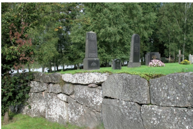
Muren är uppbyggd av grov kvadersten i öster och mer oregelbundna stenar i väster