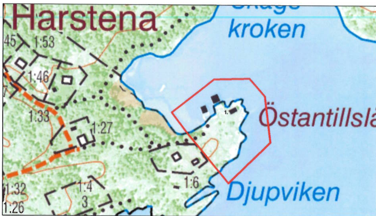
Karta med markerat skyddsområde.