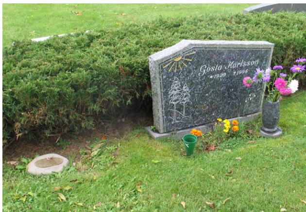
Vårdar på nya kyrkogården. Notera den enkla lilla vården till vänster (KI Halltorp kyrkog 105)