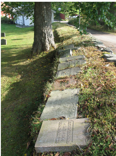
Vårdar tagna ur bruk ligger i den södra vallmuren (KI Halltorp kyrkog 016)

En bred grusad gång leder från ingången i väster fram till kyrkans västra ingång. Grusgången går sedan runt om hörnen till respektive långsida. I söder ansluter den till den kalkstensgång som kommer från den sydvästra grinden mot vapenhuset. I övrigt finns det inga gångar i söder. På norra sidan går grusgången fram till sakristian. I övrigt löper två grusgångar i NNO-SSV riktning och ansluter till gångsystemet på den nya kyrkogården. Förbi klockstapelns i östvästlig riktning går en grusgång ut genom kyrkogårdsmuren fram till prästgården. På nya delen finns en grusgång som går runt området.