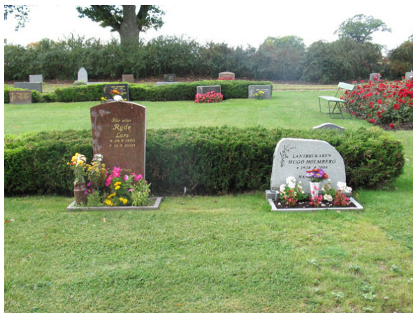
Vårdar från 2000-talet på nya kyrkogården (KI Halltorp kyrkog 103)