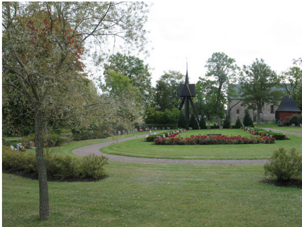
Nya kyrkogården från norr (KI Halltorp kyrkogård 101)

Nya kyrkogården ligger norr om den gamla och invigdes 1966. I den sydöstra delen finns kyrkogårdens urngravsområde. Nya kyrkogården är utformad som en ellips med många gröna ytor. Runt om på den västra och norra sidan löper en vallmur av natursten. Vallmuren mellan den gamla och nya kyrkogården i söder har bibehållits. I öster avgränsas kyrkogården kallmurad mur i natursten. På murarna växer coteanaster, och ölandstok. Urngravarna avgränsas mot den äldre delen med liguster. I mitten av området är en gräsmatta runt vilken en grusgång löper. I norra delen av gräsmattan är en plantering av rosenbuskar och i söder, i avgränsningen mot den äldre kyrkogården, finns en tujahäck med ett antal granlika tujor som låtit växa höga. Gravarna är placerade i rader på ömse sidor av gräsytan. Vårdarna är vända åt öster, väster, norr och söder. Träd som lönn, blodlönn, silverpil, ek och ask finns planterade som trädkrans.