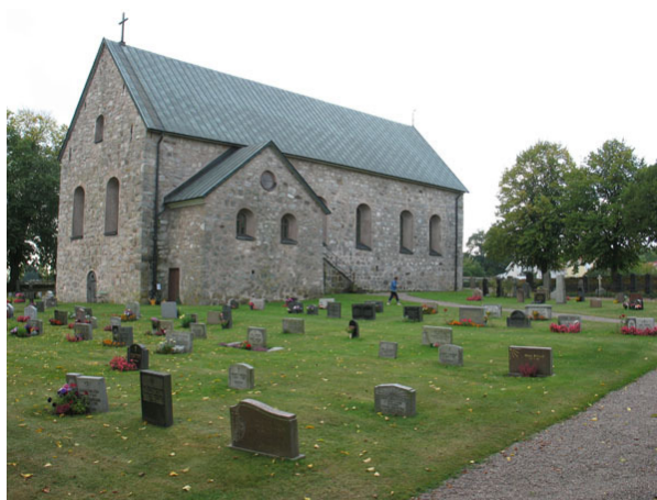
Översikt över kvarter D från nordost (KI Halltorp kyrkog 050)