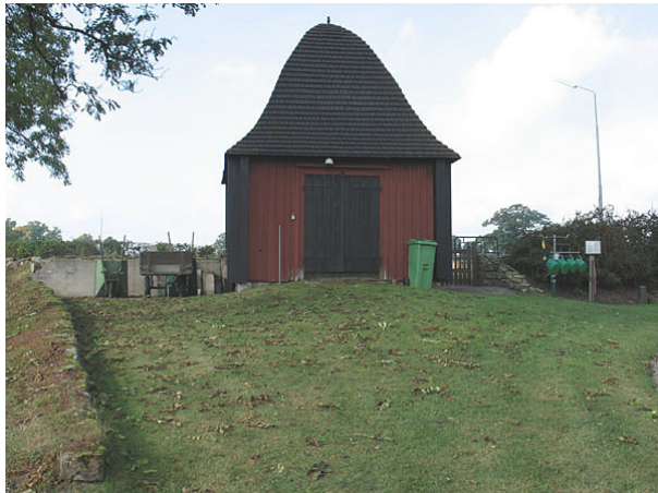
Stiglucka i den västra muren. Stigluckan används idag som förråd. Notera gamla kyrkmurssträckningen till vänster i bild (KI Halltorp kyrkog 008)

Halltorp kyrkogård har ingen minneslund de församlingsbor som önskar gravläggas i minneslund hänvisas till Arby kyrkogård.