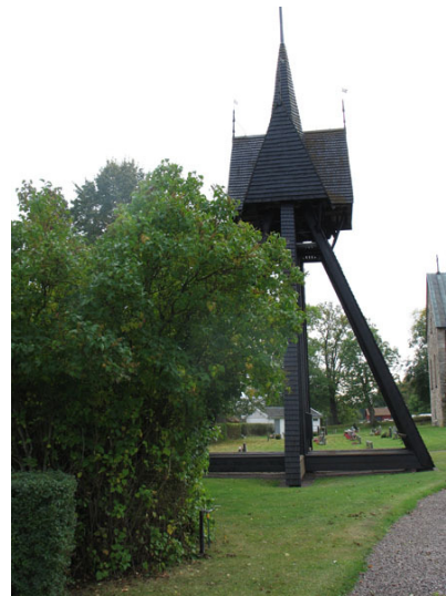
Klockstapelns uppförd på 1725 (KI Halltorp kyrkog 106)