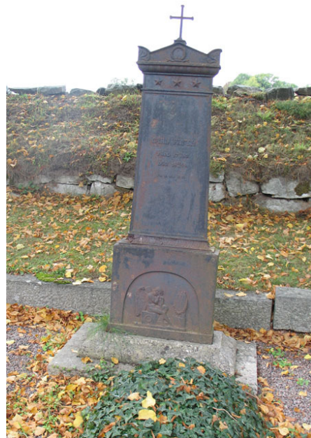
Äldsta gravvården i kvarter E, är en gjutjärnsvård inom den Mannerskantzka gravplatsen. Vården restes 1849 över Carl Flyth (KI Halltorp kyrkog 087)