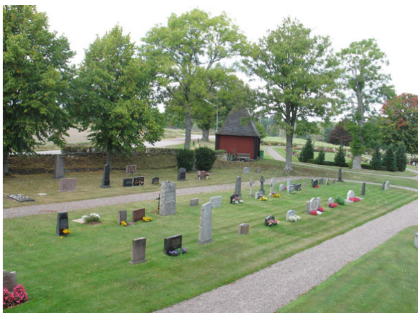
Översikt över kvarter E från sydost (KI Halltorp kyrkog 060)

Kvarter E är beläget nordväst om kyrkobyggnaden och består enligt gravkartan av ungefär 190 gravplatser. Kvarteret avgränsas i väster av kyrkogårdsmuren och åt alla andra väderstreck av grusgångar. I norr finns rester av den gamla kyrkogårdsmuren, som idag är gräns mot den Nya kyrkogården. Genom kvarteret löper en grusgång i nordost-sydvästlig riktning. Gravvårdarna står i rader i gräsmatta. Vårdarna är vända åt öster eller väster.