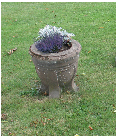
Gravvård av granit, utan inskription, i form av en urna, kvarter E (KI Halltorp kyrkog 069)

I kvarteret finns många olika typer av vårdar från hela 1900-talet. Här finns ett stort antal stående höga stenar men också lägre rektangulära vårdar och ett mindre antal liggande vårdar. Materialet är företrädevis svart och grå granit men även röd förekommer. Ett par gravvårdar är i kalksten och en i marmor. En vård är utformad som en stor urna i grå granit och har ingen inskription. Två vårdar av gjutjärn står längs kyrkogårdsmuren i väster och i kvarteret finns även en modern gjutjärnsvård. Flertalet av vårdarna i sten är formade som kors. En del vårdar har klassicistiska stildrag med kolonner, lagerkransar och tempellika gavelpartier.