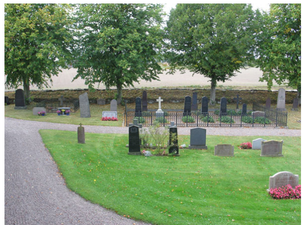
Översikt över den södra delen av kvarter E från öster (KI Halltorp kyrkog 061)