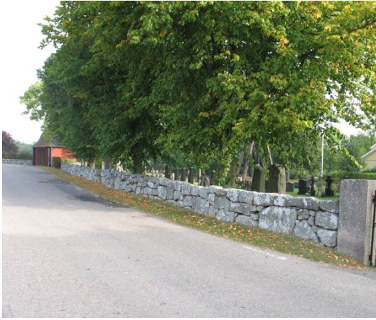
Omgärdningen i väster, notera stigluckan till vänster i bild (KI Halltorp kyrkog 005)

finns en trädkrans av ek, lönn, ask och alm. Kvarter A och B ligger i söder, C i öster och D och E i norr. Området i norr, Nya kyrkogården, utgör en tydlig utvidgning med urlund och mer vegetation än den övriga kyrkogården. I alla kvarteren är gravvårdarna ordnade i rader i gräsmatta och på nya delen står vårdarna mot en rygghäck. Vårdarna är vända mot öster eller väster. Som beskrevs i historiken genomgick kyrkogården en stor förändring under 1960- och 70-talen då samtliga grusgravar såddes in med gräs och gravplatsernas omgärdningar avlägsnades. Idag är det svårt att se några spår av kyrkogårdens tidigare utformning, fränsett det insådda gångsystemet. Klockstapeln nordost om kyrkan och stigluckan i väster bidrar till att rama in kyrkogården. Kyrkan och kyrkogården har ett vackert läge i landskapet med utsikt över åkermark och med prästgården, församlingsgården i närmaste omgivningarna.