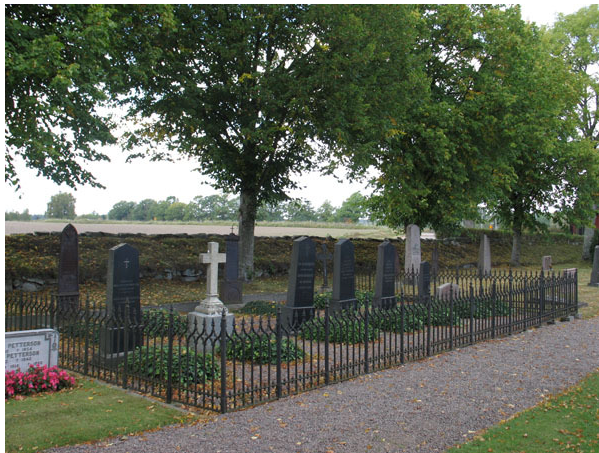
Familjen Mannerskantz gravplats omgärdas av ett gjutjärnsstaket och innanför staketet är 11 gravvårdar resta (KI Halltorp kyrkog 079)