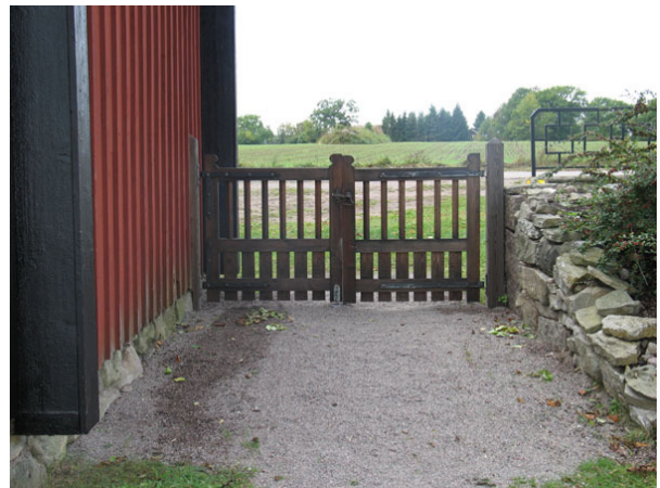
Grinden intill stigluckan mellan gamla och nya delen (KI Halltorp kyrkog 096)