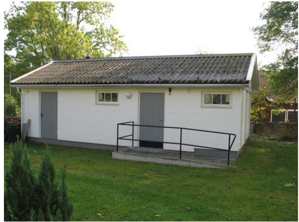
Ekonomibyggnad i det sydöstra hörnet av kyrkogården (KI Halltorp kyrkog 013)