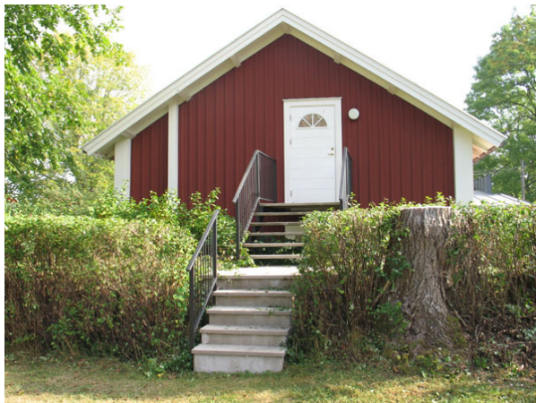
En trappa leder över östra kyrkogårdsmuren och in till församlingsgården (KI Halltorp kyrkog 012)

Kyrkogården omgärdas av en vallmur i söder, väster och i norr. I öster är en hög kallmurad stenmur. Mellan gamla och nya delen kan man se rester efter den gamla vallmuren.