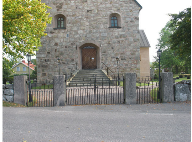
Ingången mitt för kyrkans västra ingång (KI Halltorp kyrkog 004)