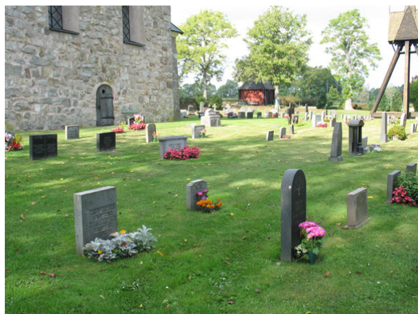
Översikt över kvarter C från sydost (KI Halltorp kyrkog 048)

Kvarteren C och D är belägna öster och delvis norr om kyrkan och rymmer enligt gravkartan närmare 320 gravplatser. Kvarteren omgärdas av kyrkogårdsmuren i öster, medan kyrkan och grusgångar inramar området i väster och i norr. I söder är det endast en remsa gräs, tidigare en grusbelagd gång, som avskiljer kvarteren mot kvarter B. Inget markerat gångsystem finns men tidigare har det funnits en gång i kvarter D. I områdets nordöstra del står klockstapeln. Hela området är besatt med gräs och vårdarna står i rader, vissa ryggställda, vända mot öster och väster.