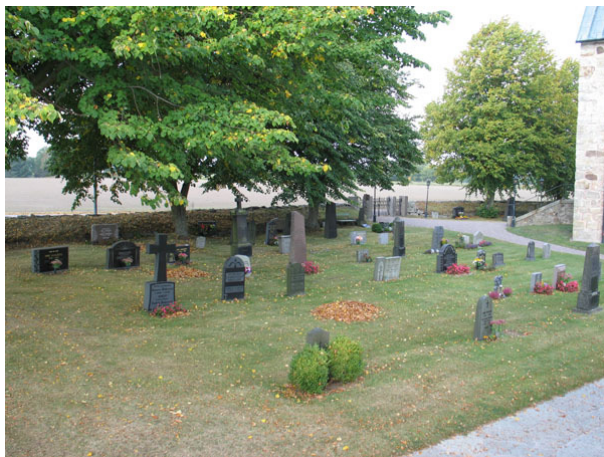
Översikt över kvarter A från sydost. (KI Halltorp kyrkog 018)

Kvarteren ligger söder om kyrkan och rymmer 337 gravplatser. Kvarteren avgränsas av kyrkogårdsmuren mot söder och väster. I öster är en gräsmatta, som tidigare var en grusbelagd gång, mot kvarter C. I norr ligger kyrkan. Kvarteren delas av den kalkstensgång som leder från ingången i söder till kyrkans södra ingång. I kvarteret står rader av gravvårdar i gräsmatta. I alla rader står vårdarna vända mot öster utom de gravplatser som ligger vid kalkstensgången. De är vända mot gången det vill säga mot väster.