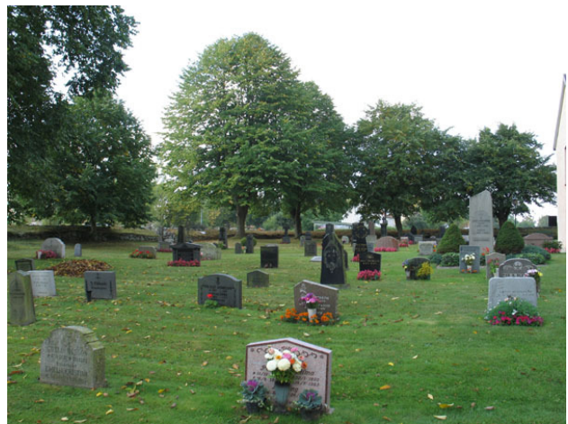
Översikt över kvarter B från nordost (KI Halltorp kyrkog 039)