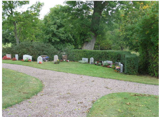
Urngravsområdet från sydväst (KI Halltorp kyrkogård 094)