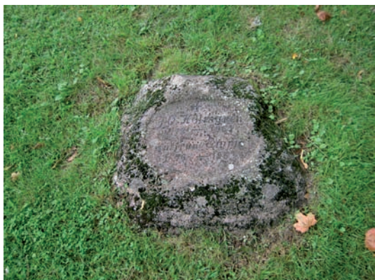
En av de mer speciella gravvårdarna i kvarteret en natursten med slipad yta.