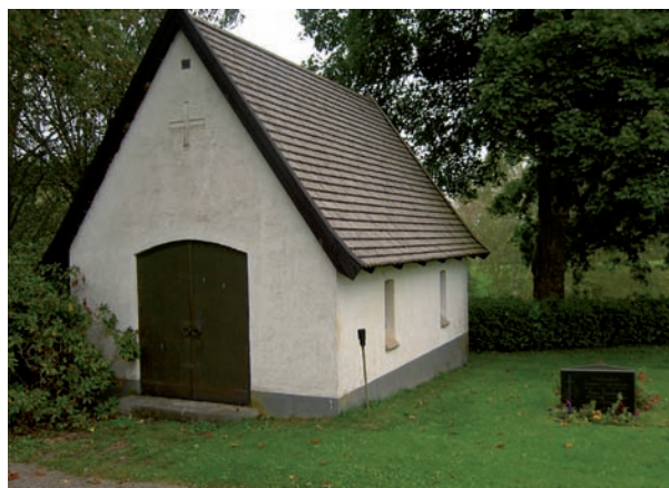
Bårhuset är ritat av länsarkitekt Hans Lindén, Växjö och invigdes 1961.