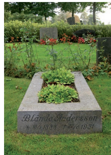
En av två gravstenar som vid inventeringen i östra delen av Kronoberg endast har hittats på Blådinge kyrkogård.