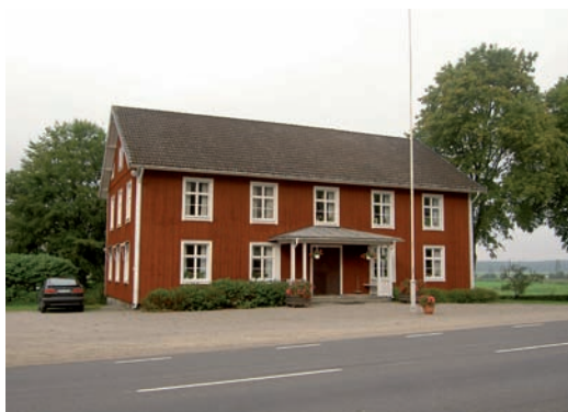
Byskolan som idag används som församlingshem. Strax vänster om byggnaden finns en ekonomibyggnad som används som redskapsbod för skötseln av kyrkogården.

Inom kyrkogården finns även ett bårhus och i det nordvästra hörnet står familjen Mörners gravkor. I anslutning till kyrka och kyrkogård finns såväl den gamla skolan, idag församlingshem, som ett kyrkstall.