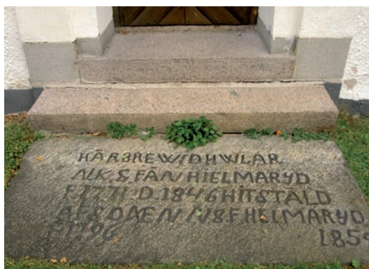
En häll som ligger vid kyrkans södra ingång.