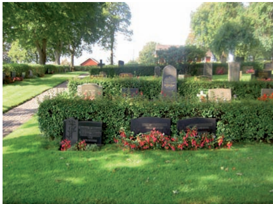
Kvarter D är planerat på sluttningen ner mot sjön Salens västra strand.