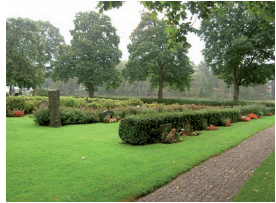
Raderna med gravar i kvarter D och E skiljs åt av rygghäckar av olika sorter; cotoneaster, ölandstök och rosenpirea.