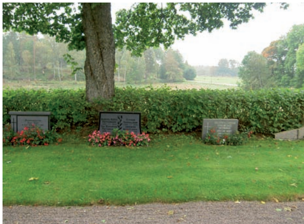
Del av kvarter B med för kvarteren vanliga gravstenar. Låga, rektangulära huggna i diabas och grå granit.