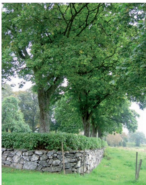
Kyrkogårdsmurens sydvästra hörn. Här syns även syrenhäcken och trädkransen av lönn och lind.