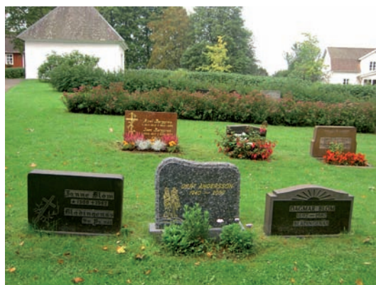
Översikt över kvarter G. Även här är raderna med gravvårdar markerade genom häckar av varierande slag.