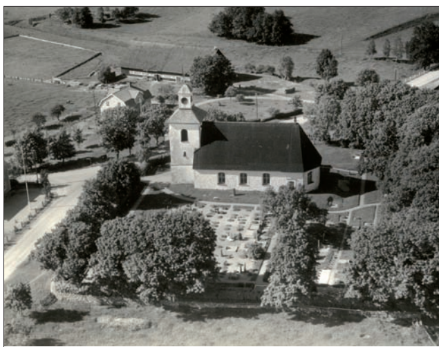
Flygfoto över Blädinge kyrka från 1946. Här ser man att stora delar var täckt med grus och hur gravarna var markerade med gravkullar täckta av vintergröna.

Blädinge kyrkogård har medeltida ursprung. Den tidigaste uppgiften om utvidgning av kyrkogården är från 1811 då Anders Koskull, Engaholm, avstod från den lilla avgårdning som använts som kålgård vid Blädinge Norregård. Den låg söder om kyrkan mellan kyrkogården och landsvägen. Ytterligare en utvidgning gjordes åt norr och nordost 1832. I samband med utvidgningen planterades en trädkrans av lindar och lönnar. Vid laga skifte 1868 utökades ringmuren mot öster och en vallmur med uppfyllning av jord på insidan anlades. Samtidigt lades en stenlagd gång från den västra kyrkogårdsingången fram till kyrkportalen i väster, en del nya lönnar planterades liksom syrenbuskarna som växer på insidan av muren. På de flygfoton som finns från 1940-talet kan man se hur stora delar av kyrkogården var grustäckt och gravarna var markerade med gravkullar bevuxna med troligtvis vintergröna. Gravstenarna var inte så många och några gravvårdar var omgärdade av stenramar och staket. På 1950-talet anlades gräsmattor och gravstenarna placerades i rätta rader med stöd av rygghäckar. De flesta stenramarna togs bort eller täcktes över. Ett bårhus uppfördes och invigdes