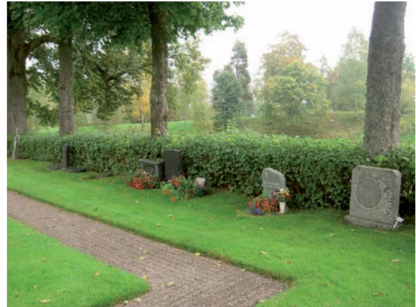
Vy över kvarter C. Kvarter A, B och C är alla en rad breda och löper längs med muren i väster, syd och öster.