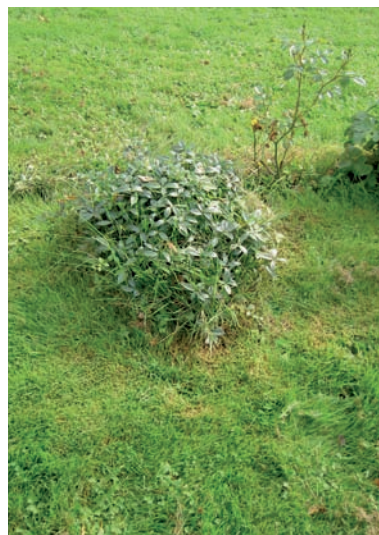
Gravkulle i kvarter E. Den har tidigare varit omgiven av jord och grus.