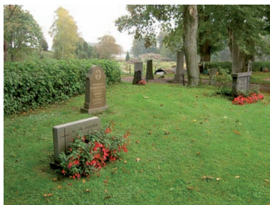
Kvarter F fotografat mot släkten Gyllenkroks gravplats.