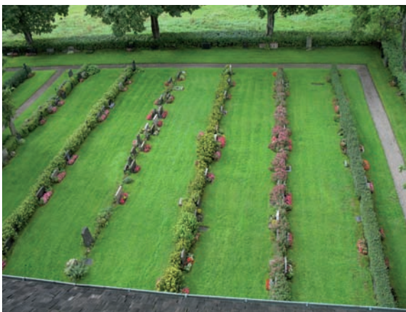
Rygghäckarna inom kvarteren är av tre olika sorter, ölandstök, rosenspiréa och häckoxbär.