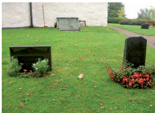
Nordöstra delen av kvarter H intill kyrkans korparti.