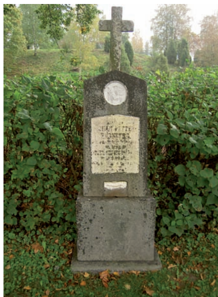
En av de äldre gravvårdarna som är prydd med en medaljong av den danske konstnären Thorvaldsen, motivet föreställer "Natten". Under namnplattan i marmor finns ett plastiskt framställt handslag med en manlig och en kvinnlig hand (symbol för vänskap).

Inom kyrkogården finns förutom kyrkan ett gravkor rest över släkten Mörner. Byggnaden är placerad ca fyra meter in i kyrkogårdens norra del. Det är en stenbyggnad som är vitputsad, taket är pyramidformat och täckt med skiffer. Vid den norra ingången ligger bårhuset som är uppfört 1961. Det är vitputsat och taket är ett sadeltak täckt med spån.