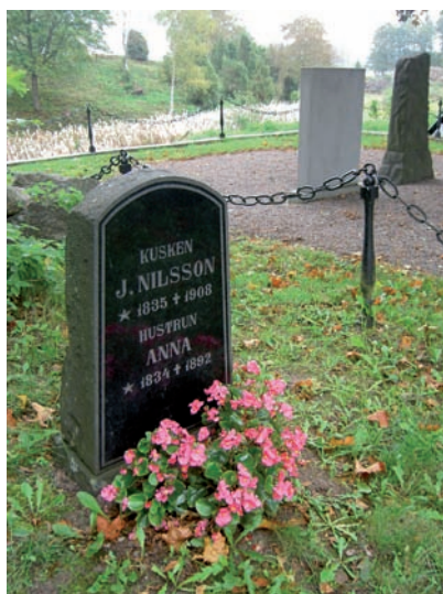
Gravsten rest över kusken J. Nilsson 1834.