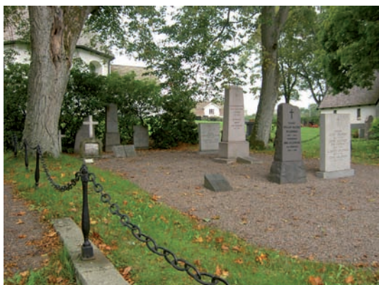
Släkten Gyllenkroks gravplats.

De ålderdomliga gravvårdarna i form av gjutjärnshällar och kors är kulturhistoriskt intressanta liksom de ålderdomliga titlarna.