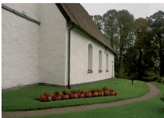
Södra delen av kvarter H.