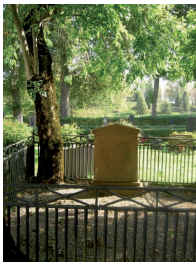
Gravstenen över Krigs-Presidenten och General-Lieutnanten Cederström och hans maka. Graven är omgärdad av ett gjutjärnsstaket och flankeras av två hängaskar.