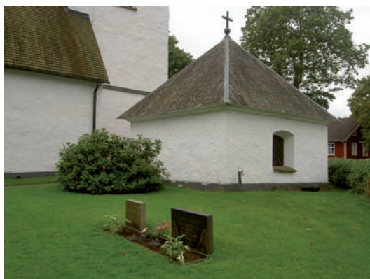
Släkten Mörnerns gravkor.