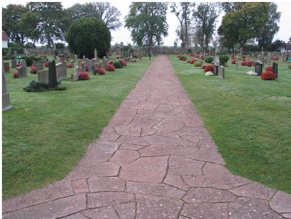
Gången från kyrkans södra ingång mot söder. (KI Persnäs kyrkog 022)

Utanför kyrkogårdens nordvästra hörn ligger ett nybyggt vaktmästeri med personalutrymmen och garage. Byggnaden har stående gråmålad träpanel, vita snickerier och svart plåttak.