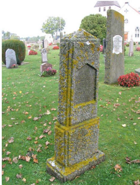
Två höga gravvårdar av kalksten i kvarter C. Den borte har en infälld platta av marmor.