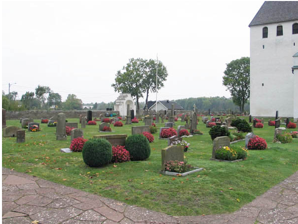
Kvarter A från sydost. (KI Persnäs kyrkog 037)