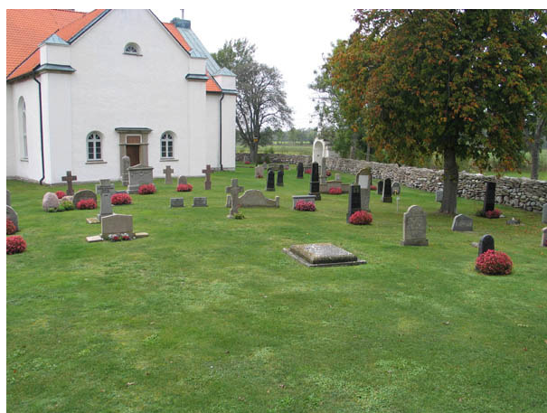
Kvarter E från väster. (KI Persnäs kyrkog 053)

Den äldsta gravvården i de båda kvarteren är från 1841 och finns i kvarter E. Detta är även den äldsta daterbara och på ursprunglig plats bevarade gravvården på Persnäs kyrkogård. Vården tillhör prosten Hoflund och är ett ringkors av kalksten. I kvarter F är den äldsta vården från 1920. I båda kvarteren finns en blandning av olika typer av gravvårdar. Mer än hälften av vårdarna i båda kvarteren är av kalksten. Det näst vanligaste materialet är granit. Det finns även en vård av kalksten och marmor i kvarter E. I samma kvarter finns också en gravkulle med murgröna samt kyrkogårdens enda bevarade gravplatsomgärdning i form av en buxbomshäck. I kvarter F finns rester av en buxbomshäck. Denna form av gravplatsutsmyckning var tidigare mycket vanlig på våra kyrkogårdar. Titlar är mycket vanliga särskilt i kvarter E. Den vanligaste titeln är skeppare men det finns också flera vårdar med titlarna lantbrukare, hemmansägare, stenhuggare, prost, byggmästare och handlanden. Exempel på ovanliga titlar är bergsingenjör och arrendator. På majoriteten av vårdarna finns angivet från vilken gård eller by den döde kommer.