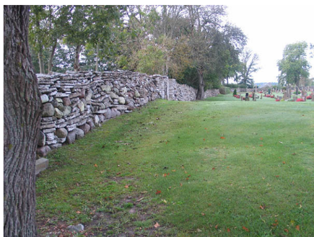
Kyrkogårdens mur i öster. Muren är lagd både av kalksten och granit. (KI Persnäs kyrkog 015)