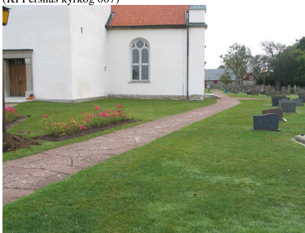
Gång belagd med kalkstensflisor från kyrkogårdens ingång i väster mot öster. (KI Persnäs kyrkog 021)