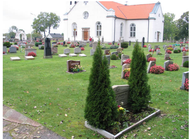
Kvarter D från sydost. (KI Persnäs kyrkog 048)