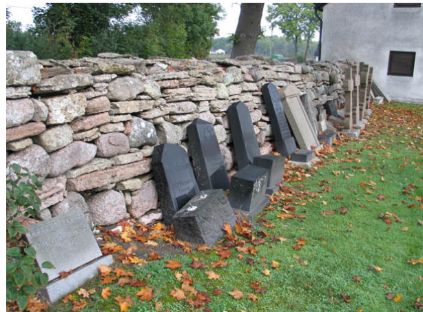
Gravvårdar som plockats bort från kyrkogården står uppställda på flera platser utmed den västra och södra delen av kyrkogårdsmuren. Här ett antal gravvårdar av granit och kalksten bl.a. flera kors. (KI Persnäs kyrkog 027)