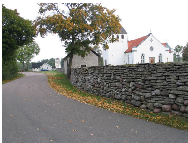
Kyrkogårdsmuren och bårhuset i väster. (KI Persnäs kyrkog 007)