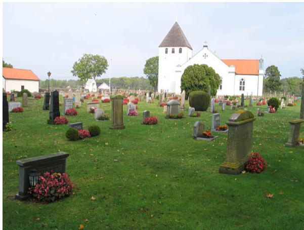
Vy över Persnäs kyrkogård från kyrkogårdens sydöstra hörn. Närmast i bilden kvarter C. (KI Persnäs kyrkog 045)

Kvarteren C och D ligger söder om kyrkan och utgör den östra halvan av området. Båda avgränsas i öster av kyrkogårdsmuren och i väster av en gång. Gränsen mellan de båda kvarteren utgörs av en gång. Gravvårdarna är placerade i rader. Majoriteten är vända mot öster men några få är också vända mot väster. I nordvästra hörnet av kvarter C står en stor yvig tuja.