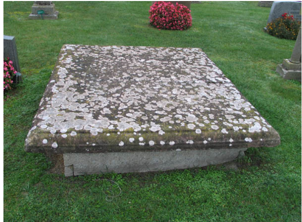
Gravtumba vars häll är kraftigt beväxt av lavar. Det gick vid inventeringstillfället inte att hitta någon inskription på hällen. (KI Persnäs kyrkog 033)

Kvarter A och B ligger söder om kyrkan. De båda kvartererna utgör den västra halvan av kyrkogården söder om kyrkan. I väster avgränsas de av kyrkogårdsmuren och i öster av en gång. En gång går även mellan de båda kvartererna. Gravvårdarna är placerade i rader och samtliga vårdar är vända mot öster.