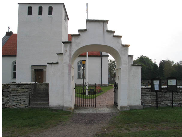
Stigluckan och klivstättan i väster. (KI Persnäs kyrkog 006)

Persnäs kyrkogård ligger utsträckt i nord-sydlig riktning. Kyrkan ligger i den norra delen av kyrkogården. Ytorna norr, öster och väster om kyrkan är begränsade. De är indelade i kvarter E öster om och F väster om kyrkan. Söder om kyrkan ligger fyra större gravkvarter A-D. Kyrkogården är öppen och överskådlig. Gravvårdarna är placerade i rader och majoriteten av vårdarna är vända mot öster.