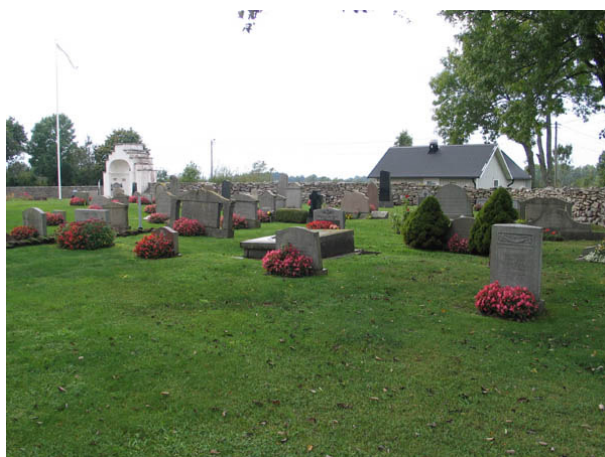
Kvarter F från väster. (KI Persnäs kyrkog 057)