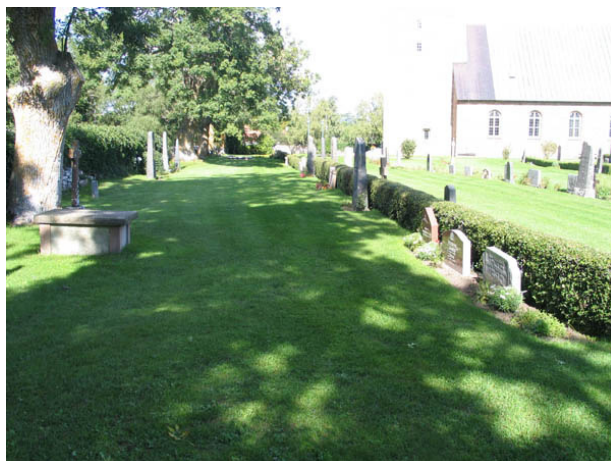
Kvarter E från söder. Till vänster i bilden syns friherre Gösta Hummerhielms tumba för gravurnor från 1946. (KI Köping kyrkog 040)

De första gravvårdar man lägger märke till, förutom hållarna, är de höga gravvårdarna från slutet av 1800-talet och början av 1900-talet. Dessa vårdar är en viktig del av gravkvarterens karaktär. De har för tiden typiska stildrag och dekorer. Det samma gäller gravvårdarna av yngre datum. De är låga och rektangulära med dekorelement som var vanliga under olika perioder av 1900-talet. Materialet är främst grå och svart granit men även röd förekommer. Det finns också flera vårdar av kalksten, vilket är ett typiskt öländskt drag. I övrigt finns ett gjutjärnskors i kvarter A, ett marmorkors i kvarter C, en gjutjärnsurna och ett modernt träkors i kvarter D samt två gjutjärnskors och ett modernt träkors i kvarter E. Att ange från vilken by eller gård den döde kommer är mycket vanligt. På fler än hälften av vårdarna i varje kvarter är det angivet. Även yrkestitlar är relativt vanliga i samtliga kvarter. De vanligaste titlarna är lantbrukare och hemmansägare. Ovanliga titlar är komministerfru, redaktör, drängen, kronbåtsman och trotjänarinna.