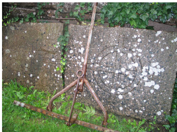
Gravhäll dekorerad med ett stavkors. Den här typen av gravhällar dateras till 1200-talet. Hällen är idag spräckt i två delar och står lutad mot kyrkogårdens mur nära ingången i öster. (KI Köping kyrkog 015)