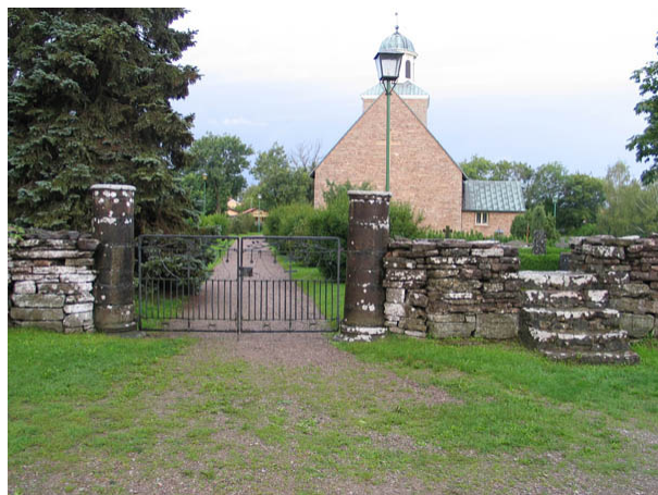
Ingång i öster med dubbla smidesgrindar och stolpar av kolonner från den medeltida kyrkan i Köping. Till höger i bilden en klivstätta. (KI Köping kyrkog 001)

I öster, väster och söder: Dubblad svartmålad smidesgrindar mellan stolpar av kalkstenskolonner från den medeltida kyrkan. Intill varje grind finns en klivstätta av kalksten. I norr: Enkel trägrind med mönster av en sol. Inga stolpar.