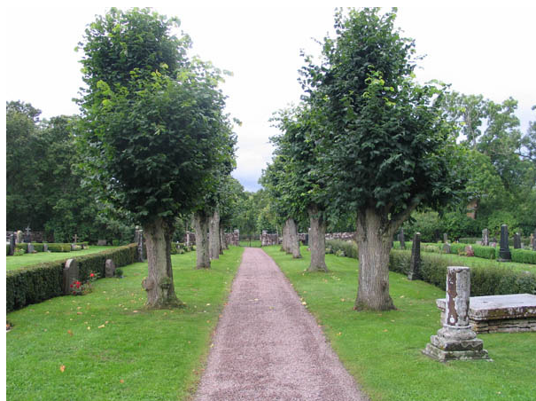
Gången från kyrkan till kyrkogårdens södra ingång kantas av hamlade lindar. Till höger i bild syns en avbruten kolonn från den medeltida kyrkan samt en gravtumba. Hällen som täcker denna saknar idag inskription. (KI Köping kyrkog 011)

gjordes 1998. Detta genomfördes dock aldrig varför flera kulturhistoriskt värdefulla gravvårdar och hållar på kyrkogården idag är i akut behov av åtgärder.