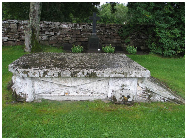
Tumba av kalksten. Enligt traditionen ska tumbans dekorerade sidostycken vara dekorfragment från Borgholms slott. Hällens inskription är bortnött. (KI Köping kyrkog 027)