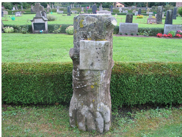
A. P. Davidssons gravvård i form av en avsågad trädstam symboliserar det avbrutna livet. Vården är i kalksten med en platta av marmor och står i kvarter A. (KI Köping kyrkog 020)

De första gravvårdar man lägger märke till, förutom hållarna, är de höga gravvårdarna från slutet av 1800-talet och början av 1900-talet. Dessa vårdar är en viktig del av gravkvarterens karaktär. De har för tiden typiska stildrag och dekorer. Det samma gäller gravvårdarna av yngre datum. De är låga och rektangulära med dekorelement som var vanliga under olika perioder av 1900-talet. Materialet är främst grå och svart granit men även röd förekommer. Det finns också flera vårdar av kalksten, vilket är ett typiskt öländskt drag. I övrigt finns ett gjutjärnskors i kvarter A, ett marmorkors i kvarter C, en gjutjärnsurna och ett modernt träkors i kvarter D samt två gjutjärnskors och ett modernt träkors i kvarter E. Att ange från vilken by eller gård den döde kommer är mycket vanligt. På fler än hälften av vårdarna i varje kvarter är det angivet. Även yrkestitlar är relativt vanliga i samtliga kvarter. De vanligaste titlarna är lantbrukare och hemmansägare. Ovanliga titlar är komministerfru, redaktör, drängen, kronbåtsman och trotjänarinna.