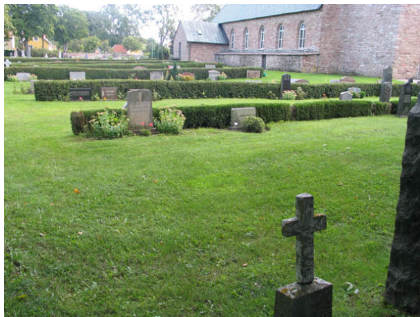
Kvarter F från nordväst. (KI Köping kyrkog 070)