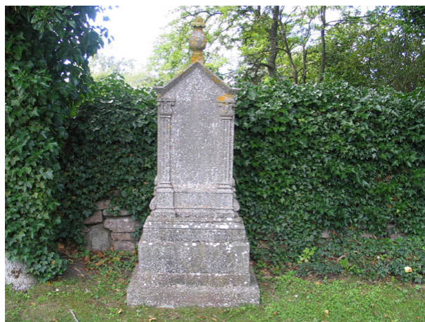
Påkostad gravvård av kalksten i kvarter F. Texten är svår att tyda eftersom denna sten liksom flera andra, främst vårdar av kalksten, är beväxta med mossor och lavar. (KI Köping kyrkog 073)

Även kvartererna F-H har en lång historia som gravkvarter. Här saknas dock idag det äldsta skiktet av vårdar som finns i kvarter A-E. Under lång tid var det enligt folktron sämre att bli begravd på den norra sidan om en kyrka och kanske är det därför de riktigt gamla gravvårdarna bara finns söder om Köpings kyrka. Denna inställning förändrades i mitten av 1800-talet. Idag präglas kvartererna av de förändringar som troligen påbörjades 1967 och som innebar att gravvårdarna placerades i ryggställda rader med häckar av olika slag emellan och hela kyrkogården såddes in med gräs. Hos flera av vårdarna finns konsthistoriska värden samt lokal- och personhistoriska värden att värna. Gravvårdar från 1800-talets mitt och äldre ska tillsammans med vårdar av gjutjärn föras in på församlingens inventarieförteckning.