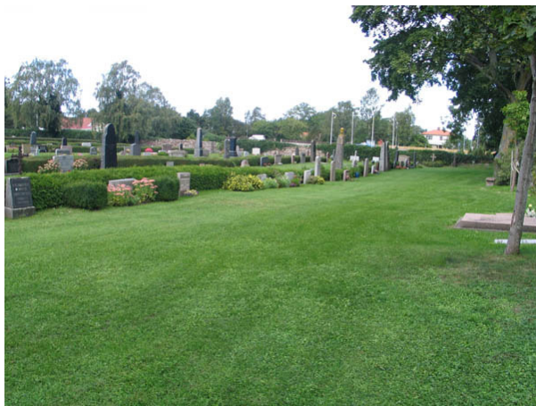
Kvarter H från sydost. (KI Köping kyrkog 056)