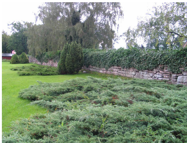
Kyrkogårdens omgärdning i söder. En stor del av muren är överväxt med murgröna. (KI Köping kyrkog 005)