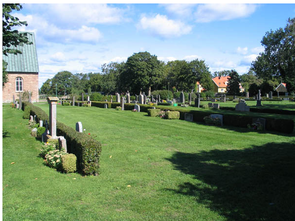
Vy från södra delen av kvarter C mot nordost. (KI Köping kyrkog 031)