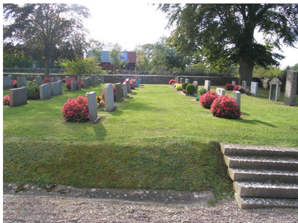
I kvarteren står gravvårdarna ordnade i rader. Här kvarter B som delvis har lagt om med början på 1950-talet. Till höger i bild syns också några av kvarterets äldre gravvårdar samt en av de trappor som leder upp till kvarteret. (KI Källa kyrkog 044)

Under senare tider har kvarteren lagts om och gravvårdar av yngre datum har tillkommit. Särskilt tydligt är det i kvarter B. Här har delar av kvarteret lagts om med början på 1950-talet och in på 1970-talet. Gravvårdar av kalksten är nästan lika vanliga som vårdar av granit vilket är ett typiskt öländskt drag. I grannsocknen Persnäs fanns flera stora stenhuggeriet och man kan därför tänka sig att många av gravvårdarna är lokalt producerade. Av granitvårdarna är de flesta av svart eller grå granit men även röd förekommer. I kvarter A finns ett träkors och en urna av gjutjärn. Ett gjutjärnskors finns i kvarter B.