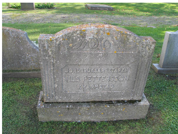
Kalkstens vård i kvarter B. Stilen är typisk för 1950-talet. På Källa kyrkogård finns flera av vårdar av den här typen i kalksten. Titeln på vårderna, jordbruksarbetaren, är dock ovanlig. (KI Källa kyrkog 037)

och sjukvårdssergeant. Överhuvudtaget ger titlarna en mer mångfasetterad bild av Källa socken än vad man brukar se på de öländska landsbygdskyrkogårdarna. På de flesta gravvårdar anges från vilken gård eller by den döde kommer.