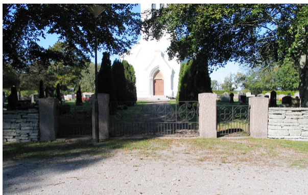
Kyrkogårdens ingång i väster med grindar i svartmålat smide. Fram till kyrkan leder en grusgång kantad av höga tujor. (KI Källa kyrkog 001)