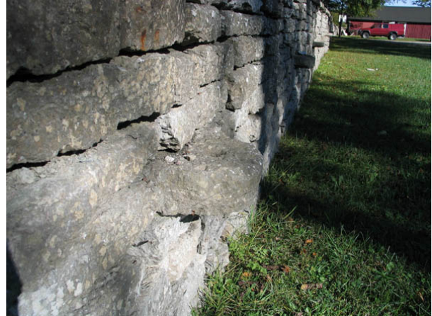
Infogade i kyrkogårdens mur i väster finns hästbindslen av kalksten kvar. (KI Källa kyrkog 003)