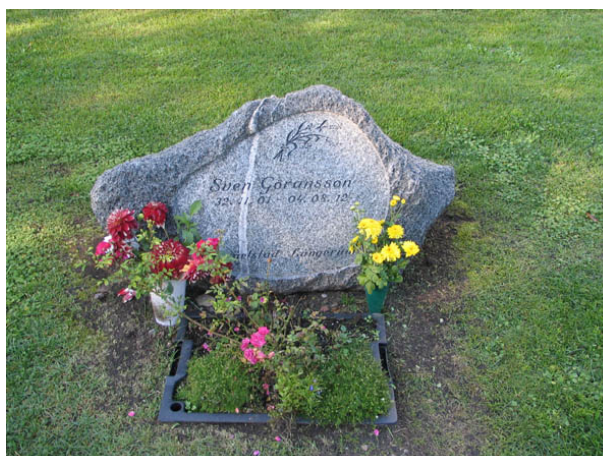
Modern typ av gravvård från 2004 i kvarter A. I en natursten har en inskriptionsplatta slipats fram. (KI Källa kyrkog 029)

Fem respektive tre gravkullar överväxta med murgröna finns i kvarter A och D. De fem gravkullarna i kvarter A ligger samlade inom en gravplats som omgärdas av en buxbomshäck. Detta är den enda bevarade intakta gravplatsomgärdningen som finns kvar på kyrkogården. I kvarter A och D finns också rester av en buxbomshäck samt av en stenram. Att ange yrkestitlar är vanligt i samtliga tre kvarter men främst på de äldre gravvårdarna. De vanligaste titlarna är hemmansägare och lantbrukare, men här finns också fler titlar med koppling till sjön såsom skeppare, kronobåtsman, sjöman, styrman och båtsman. Exempel på ovanliga titlar är jordbruksarbetare, stenarbetare, estnische undersåten, undantagsman, lägenhetsägare