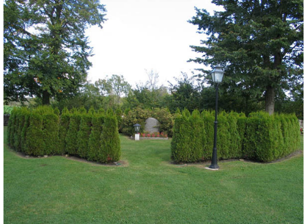
Minneslunden i kvarter C från söder. (KI Källa kyrkog 046)

Under 1990-talet kan man se en uppluckring av bestämmelserna kring gravvårdarnas utformning. Idag är formerna mer varierande och ofta mjukare. Materialet är främst granit men på Källa kyrkogård finns också ett stort antal vårdar av kalksten. Detta är ett typiskt öländskt drag. På de flesta öländska kyrkogårdarna finns som fler vårdar av kalksten än på fastlandet.