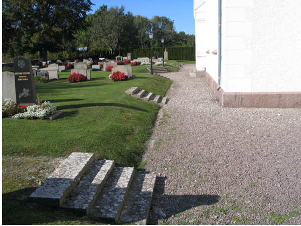
Utmed kyrkans södra sida finns flera trappor av kalkstensflisor som leder upp till kvarter B. (KI Källa kyrkog 017)