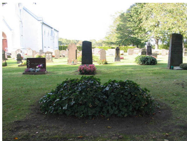
Två av kyrkogårdens åtta gravkulla med murgröna. Gravplatsen saknar idag en gravvård. I bakgrunden syns kvarter D. (KI Källa kyrkog 056)