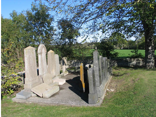
Uppställningsplatsen för gravvårdar som tagits bort från kyrkogården. De är sorterade efter material med kalkvårdar till vänster och granitvårdar till höger. (KI Källa kyrkog 011)