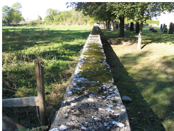
Kyrkogårdens mur i söder är avtäckt med rektangulära kalkstensflisor. (KI Källa kyrkog 004)