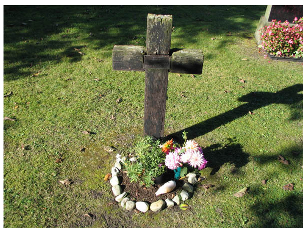
Adalbert Musts gravplats markeras av ett träkors med en mässingsplatta. Där berättas att han var en av de estniska undersåtar som dog under flykten från Estland 1941. Han hittades död i sin båt vid Honungstorp. (KI Källa kyrkog 022)

D. Från 1900-talets andra hälft har delar av kvarteren lagts om allteftersom gravplatser återgått. Kvarteren har också genomgått en för mitten av 1900-talet typisk förändring då gravplatser såddes in med gräs och gravplatsomgärdningar togs bort. Kvar finns en buxbomsomgärdad gravplats samt rester av ytterligare en buxbomshäck och en stenram. Dessa spår utgör viktiga rester av kyrkogårdens utseende under tidigt 1900-tal. Ett troligen ännu äldre spår är de bevarade gravkullarna med murgröna som berättar om en idag försvunnen tradition. Samtliga dessa spår bör bevaras. På kyrkogården finns också flera gravvårdar som ur olika synvinkel har ett högt kulturhistoriskt värde. Det gäller bl.a. kyrkogårdens äldsta gravvårdar från slutet av 1800-talet. Dessa vårdar bör införas på församlingens inventarieförteckning tillsammans med gravvårdarna av gjutjärn. Förekomsten av kalkstensvårdar är ett typiskt öländskt drag som visar hur man tagit tillvara på en lokal naturresurs. Flera gravvårdar har ett person- och lokalhistoriskt värde genom sina titlar, gårds- och bynamn eller genom de uppgifter som finns om den döde.