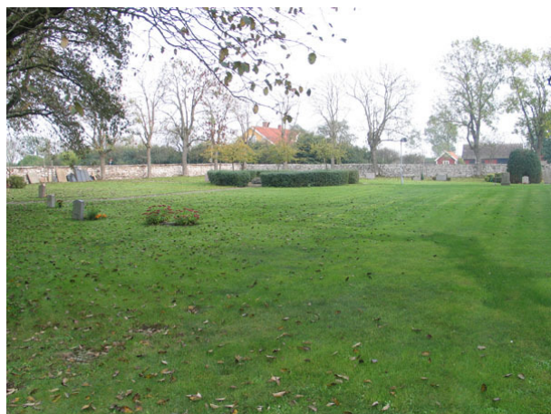
Översikt över kyrkogårdens norra sida (KI Högsrum kyrkog 075)

Endast ett fåtal gravplatser, på den norra sidan av kyrkan, har tagits i bruk och vårdarna är övervägande från 1980- och 90-talen. Öster om kyrkan finns vårdar från alla 1900-talets årtionden från 1920- talet fram till 1980-talet. Sammanlagt är det ungefär 30 gravplatser som tagits i bruk. I en rad närmast öster om kyrkan finns ett antal äldre vårdar. Den äldsta har bara årtalet 1709 inristat och det är således kyrkogårdens äldsta gravvård. Det är en liten korsformad kalkstensvård. Tre vårdar är från 1800-talet. Den ena är handlanden Rådbergs sandstensvård med marmorkors från 1870, Comministern i Röpplinge och Högsrums vård från 1851 och en kalkstensvård från 1847. Frågan är om någon av dessa vårdar står på ursprunglig plats.