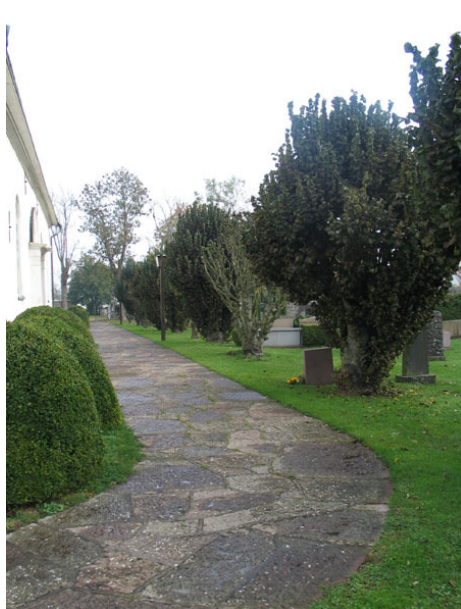
Den kalkstensbelagda gången längs kyrkans södra sida kantas av pyramidalmar (KI Högsrum kyrkog 061)

Längs kyrkans södra långsida finns en kalkstensbelagd gång, som belades med ny kalksten 1982. Norr om kyrkan ligger kalkstensplattor i gräset längs kyrkans långsida men också från grinden i norr mot vapenhusets ingång ligger kalksten. Utifrån meditationsplaten på norra sidan av kyrkan går det gånger i alla fyra väderstrecken. De är belagda med grus. I övrigt finns inget markerat gångsystem.