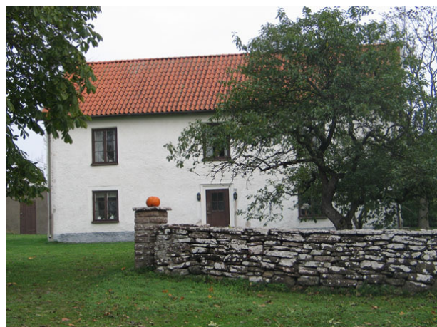
Församlingsgården ligger mitt emot kyrkan, i öster (KI Högsrum kyrkog 100)