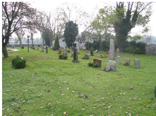
Området väster om kyrkan (KI Högsrum kyrkog 072)