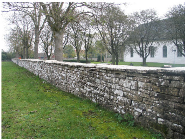
En meterhög kalkstensmur omgärdar kyrkogården (KI Högsrum kyrkog 024)

Kyrkogården omgärdas av en kallmurad kalkstensmur lagd på 1860-talet och lagad omkring sekelskiftet.