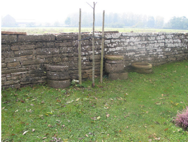
Delar av gamla kyrkans pelare ligger på kyrkogården längs den södra muren (KI Högsrum kyrkog 015)

Äldre gravvårdar tagna ur bruk står uppställda längs den norra kyrkogårdsmuren. Några av dem var tidigare nedgrävda norr om kyrkogårdsmuren, men påträffades vid schaktningsarbete. De togs då till vara och ställdes upp vid muren.