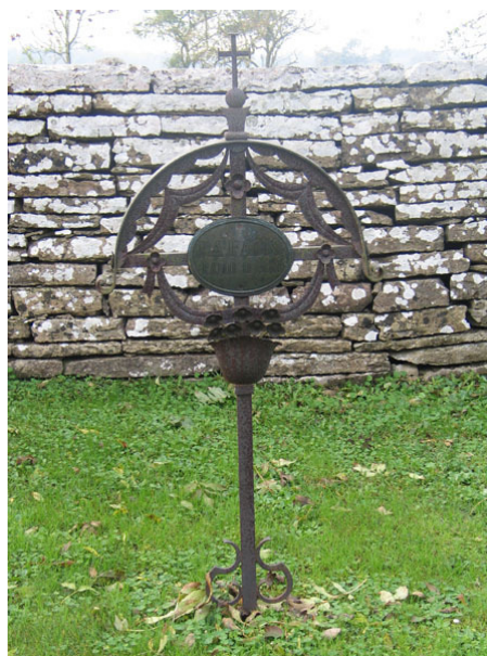
En gjutjärnsvård rest över C A Falk och hans familj (KI Högsrum kyrkog 068)