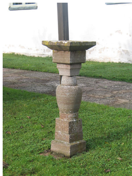
Intill kalkstensgången i söder står en solvisare av okänd ålder (KI Högsrum kyrkog 048)