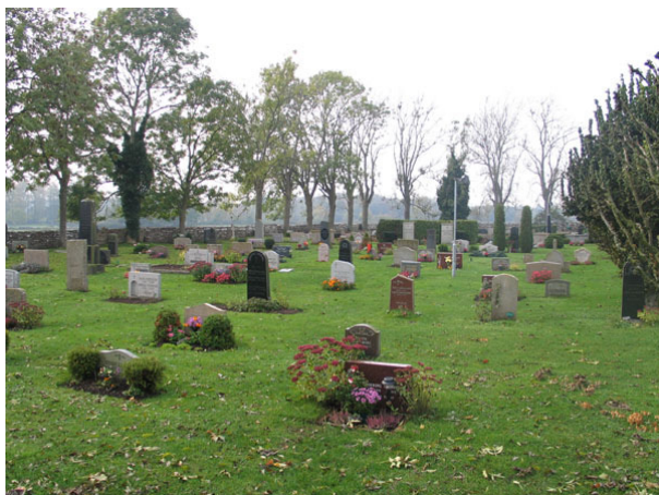
Översikt över södra sidan (KI Högsrum kyrkog 029)