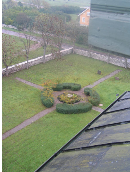
Norr om kyrkan iordningställdes år 1990 en meditationsplats (KI Högsrum kyrkog 006)

År 1990 iordningställde man en meditations/andaktsplats norr om kyrkan. Runt om och som avgränsning är det planterat häckar av liguster och prydnadsäpplen. I mitten av området är det en springbrunn av kalksten och runt om den är det växter planterade. Utifrån cirkeln går det i alla väderstreck grusade gångar. Förslaget gjordes av landskapsarkitekt Peter Bergholm.