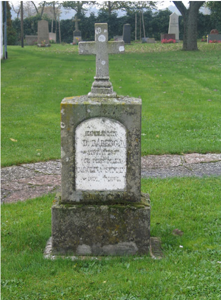
En sandstensvård med marmorkors rest över handlanden D Rådberg 1870 (KI Högsrum kyrkog 082)

På hälften av vårdarna nämns den dödes hemort. Endast på tre vårdar har den dödes yrkestitel uppgivits, förutom de redan tidigare angivna är det också en styrman.