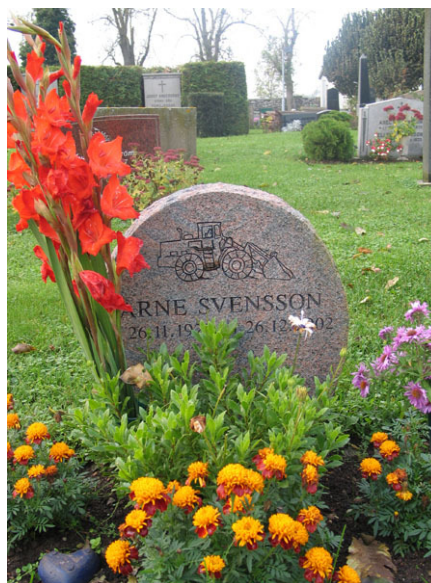
En modern bild på en av gravvårdarna rest 2002 (KI Högsrum kyrkog 044)