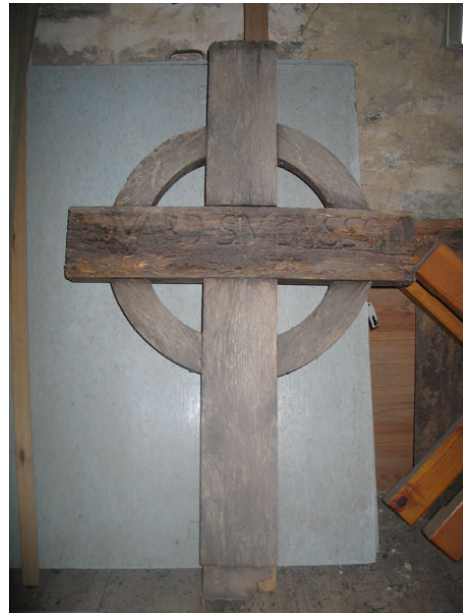
Ett ringkors av trä förvaras i tornet. Det är den enda bevarade trävården (KI Högsrum kyrkog 001)