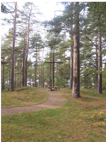
Minneslunden ligger vid Rälla Tall ett par kilometer närmare kusten (KI Högsrum kyrkog 103)

Det finns ingen minneslund på kyrkogården i Högsrum. Istället finns det en minneslund i Rälla Tall som tillhör församlingen så de församlingsbor som önskar gravsättas i en minneslund hänvisas dit. Minneslunden iordningställdes på 1990-talet.