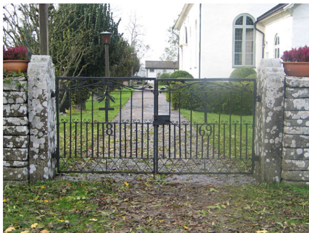
Gjutjärnsgrindarna är från 1869 (KI Högsrum kyrkog 013)