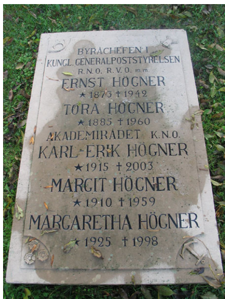
En liggande vård i kalksten från 1942 (KI Högsrum kyrkog 042)

kyrkvård, lägenhetsägare, sparbanksdirektör, sjömannen, postmästare, byggmästare, körnären och donator av Jonssonska fonden