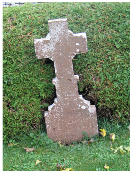
Vanlig typ av kalkstens vård på Öland (KI Högsrum kyrkog 090)