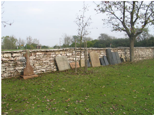
Längs den norra kyrkogårdsmuren står äldre vårdar som tagits ur bruk uppställda (KI Högsrum kyrkog 026)