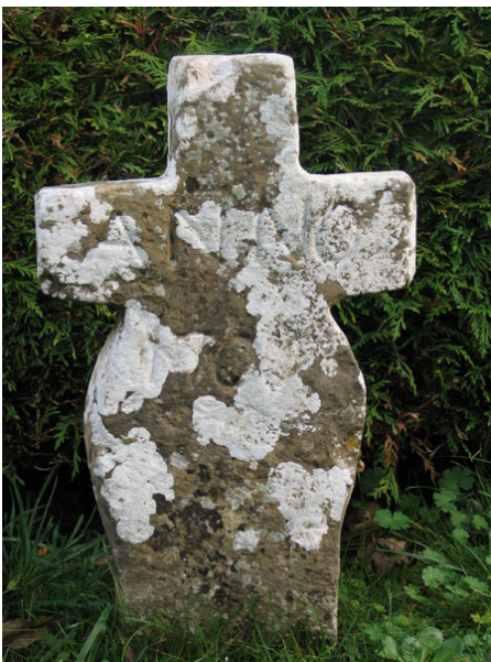
Kyrkogårdens äldsta vård. Den har bara inskriptionen Anno 1709 (KI Högsrum kyrkog 086)

De äldre vårdar som finns öster om kyrkan bör stå kvar. I dessa vårdar finns stora lokalhistoriska och hantverksmässiga värden. Vården från 1700-talet liksom de vårdar som är från mitten av 1800-talet eller äldre ska föras in på kyrkans inventarieförteckning.