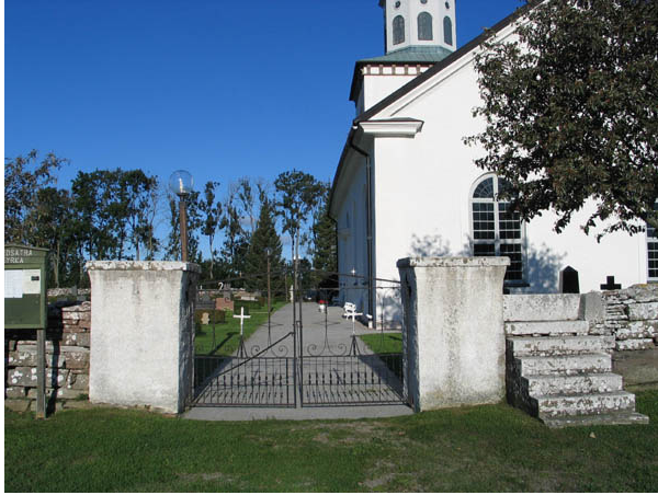
Kyrkogårdens ingång i öster med smidesgrindar och den nybyggda klivstättan. (KI Bredsätra kyrkog 001)