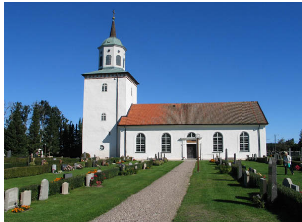
Grusgången som leder fram till kyrkans södra ingång. (KI Bredsätra kyrkog 043)