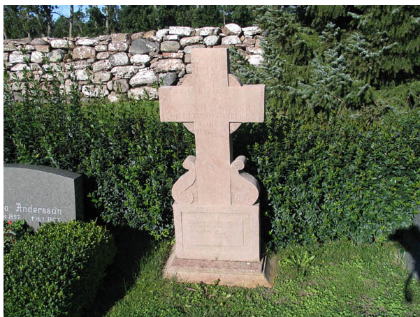
Kors av kalksten. Denna typ av gravvårdar är typisk för Öland. De finns på flera kyrkogårdar och tillverkades ofta av lokala hantverkare. Gravvården står i kvarter A. (KI Bredsätra kyrkog 011)

Kvarter A och B är de största kvartererna med 478 respektive 389 gravplatser. De båda kvartererna ligger söder om kyrkan och skiljs åt av en grusgång. Kvarter C rymmer 140 gravplatser varav ca 100 är i bruk. Gravplatserna i detta kvarter är utlagda öster och norr om kyrkan. I alla tre kvartererna är gravvårdarna placerade i ryggställda rader och vända mot öster eller väster. Mellan raderna finns häckar av liguster eller måbär.