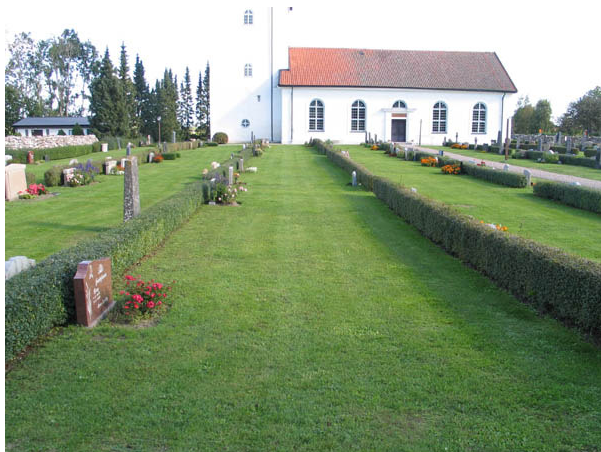
Kvarter A från söder. (KI Bredsätra kyrkog 017)