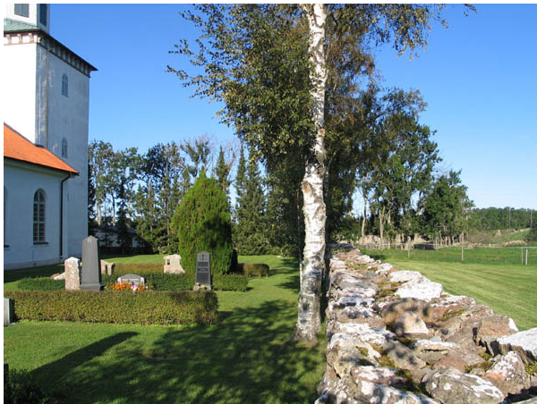
Kyrkogårdsmuren i norr och raden av björkar. (KI Bredsätra kyrkog 008)

familjegravplatsen markerades med en gravkulle överväxt med murgröna. På äldre fotografier kan man se flera gravkullar över hela Bredsätra kyrkogård.