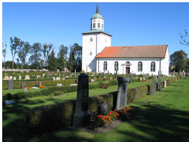
Kvarter B från sydost. (KI Bredsätra kyrkog 024)