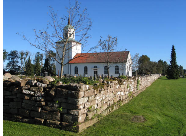
Kyrkogårdsmuren i öster. (KI Bredsätra kyrkog 002)