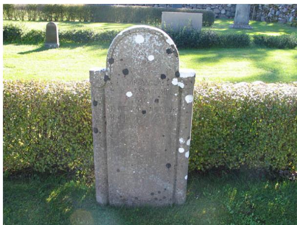
En typ av kalkstens vård. Denna typ av vårdar brukar vara från årtiondena kring sekelskiftet 1900. (KI Bredsätra kyrkog 021)