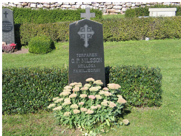
Gravvård typisk för årtiondena kring sekelskiftet 1900. Titeln torpare är inte så vanlig. Även denna gravvård återfinns i kvarter A. (KI Bredsätra kyrkog 013)