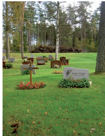
Röd och grå granit är dominerande i kvarter E