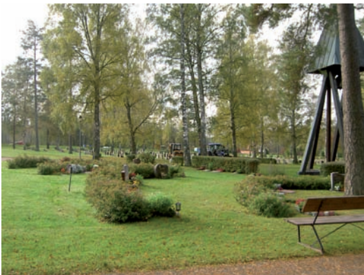
Kvarter R ligger strax öster om klockstapeln och är avsett för urngravar.