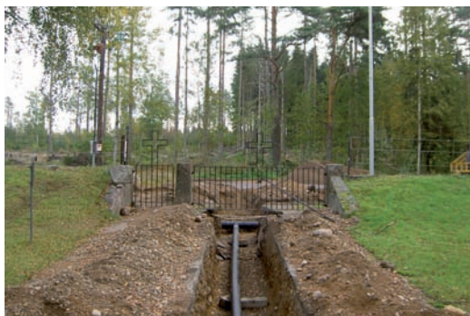
Ingång i östra delen.

De gravstenar som finns i området är från tiden från kyrkogårdens anläggande på 1950-talet och fram till idag. Det är främst gravvårdar i sten, något järnkors finns men de är inte vanliga. Stenarna är huggna i grå och röd granit, diabas, marmor, labrador och hallandsgranit. De flesta gravstenarna är rektangulära,