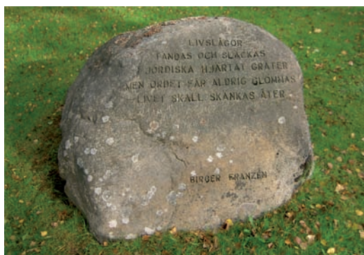
Natursten med minnesvers av Birger Franzén.