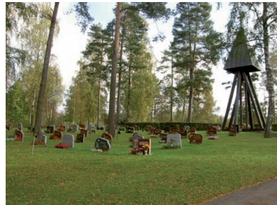
Kvarter P är beläget strax väster om klockstapeln. Gravvårdarna är mer individuella och det är inte ovanligt med naturstenar.