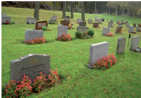
De äldsta gravstenarna i kvarter E är från 1970-talet