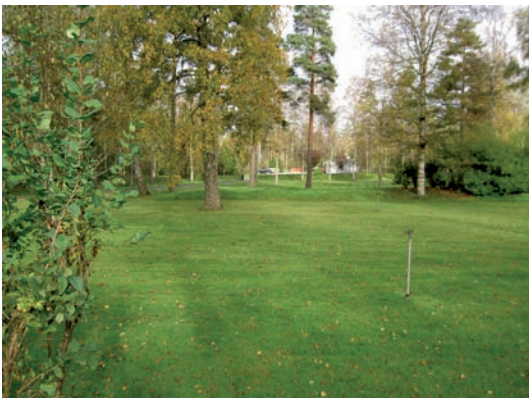
Kvarter H, J, K och L skiljs åt av gräsvallar där prydnadsbuskar är planterade