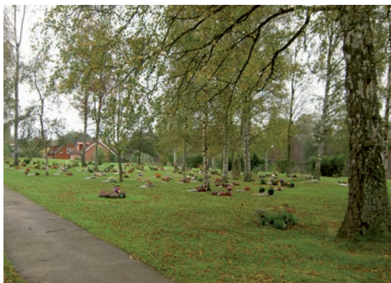
Urnlundan där björkar växer och gravstenarna är fritt placerade.