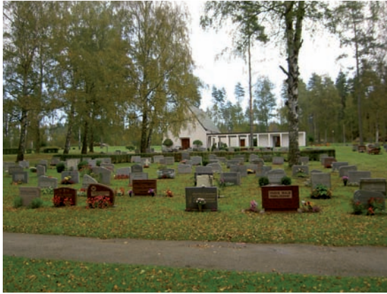
Kvarter A2 och C2. Kvarteren skiljs åt av en häck i ribus/måbär.