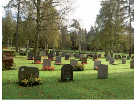
Kvarter D2 är det äldsta kvarteret.