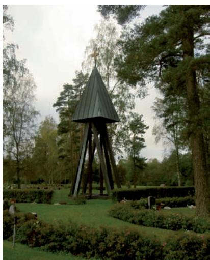
Klockstapeln som uppfördes tillsammans med kapellet 1967 efter ett förslag av Berglunds arkitektbyrå i Vämamo.