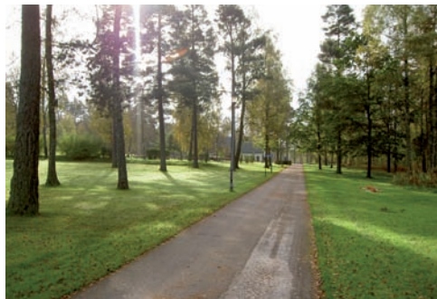
De flesta gångarna inom begravningsplatsen är asfalterade.