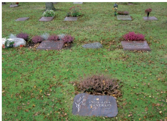
Exempel på gravstenar inom urnlundan. Såväl naturstenar som rektangulärt formade hällar är vanliga.

Inom området finns kapellet och strax norr om området finns ekonomibygnader för skötseln av kyrkogården.