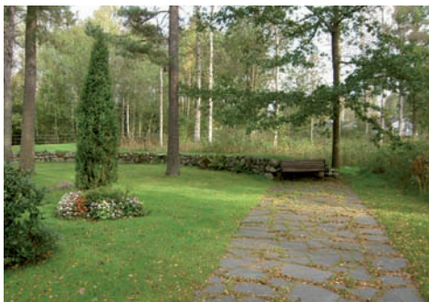
Minneslunden som anlades vid slutet av 1980-talet.