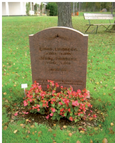
Den första gravstenen på kyrkogården.