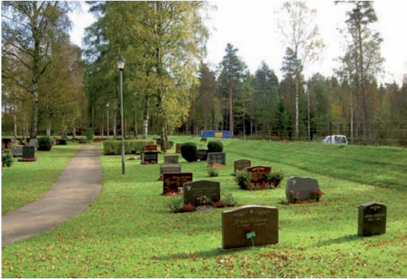
Kvarter F är långsmalt och beläget längs med den södra muren.