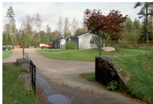
Ingång i murens norra del som leder till ekonomibyggnaderna.