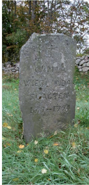
Minnessten från 1774.