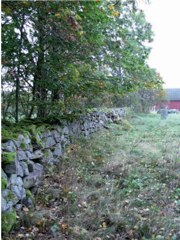
Norra muren sedd från väster.