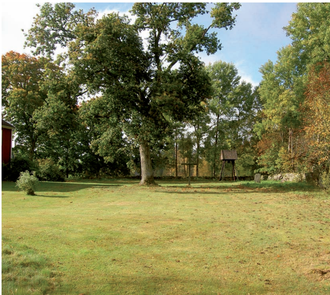
Kyrkogården sedd från öster.

År 1954 genomfördes en arkeologisk undersökning på kyrkogården för att klarlägga den gamla kyrkans läge och planform. Vid denna påträffades ett antal löst liggande stenar vilka ingått i träkyrkans stengrund. Längden på kyrkan kunde utifrån dessa uppskattas till ca 20 meter och bredden till ca 7,5 meter. Några spår efter ett separat kor framkom inte vid undersökningen. I anslutning till långhusets sydvästra hörn fann man rester av vapenhuset vilket mätt ca 3,5 x 4 meter och i nordost lämningar efter kyrkans sakristia vars storlek uppgått till ca 3,5 x 4,5 meter. I anslutning till ovanstående arbeten uppfördes även den nya klockstapeln. Av äldre gravminnen återstår en gravhäll rest över prosten Heurlin samt en minnessten.