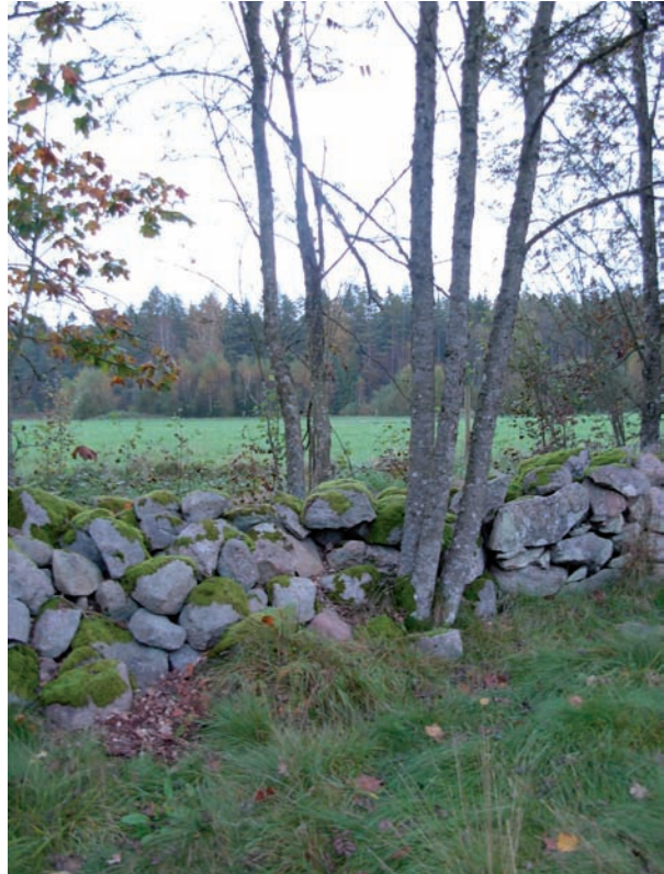
Raserad del av muren till följd av träd som växer i murverket.