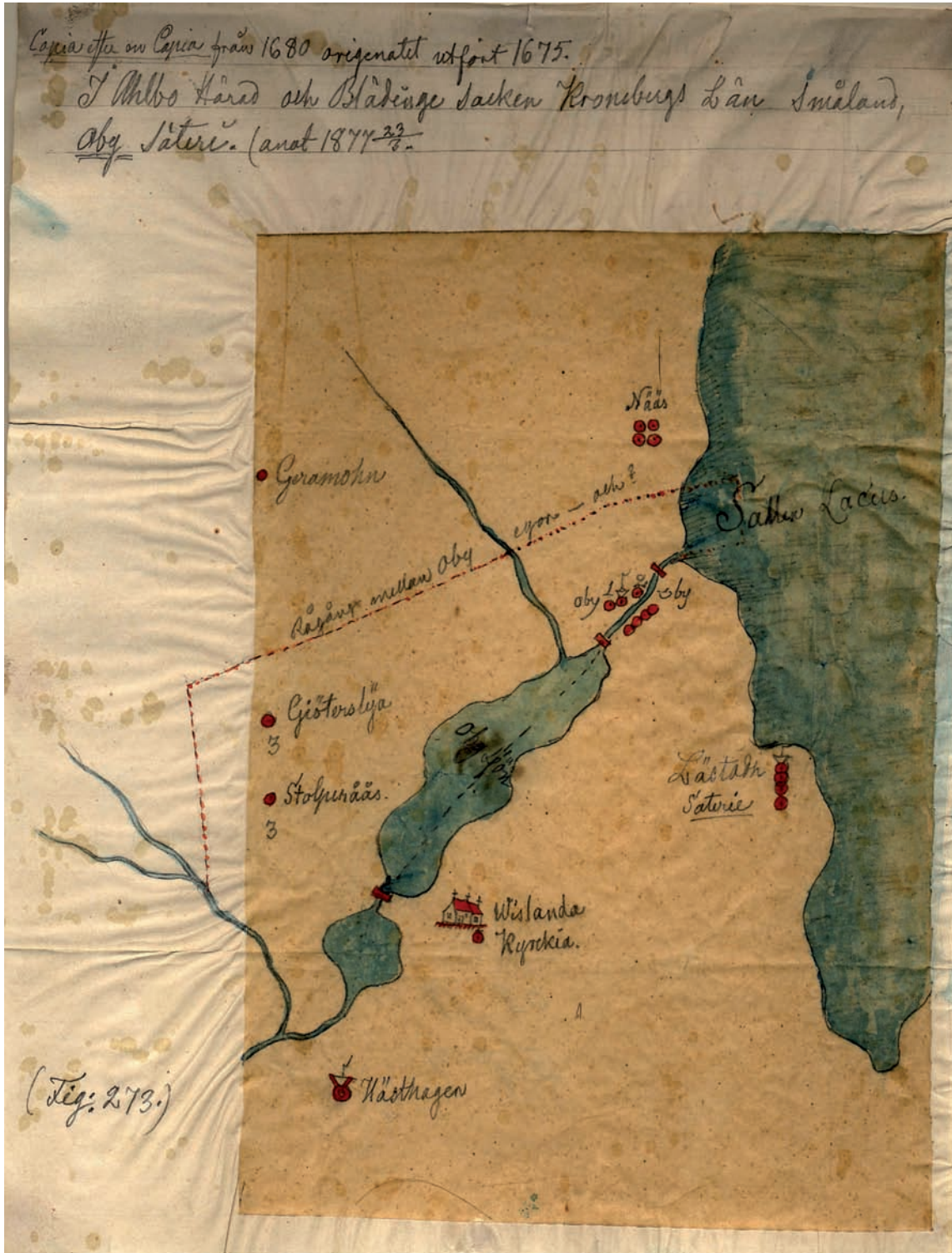
Karta över Vislanda kyrka med omgivningar utförd av Nils Månsson Mandelgren 1877.