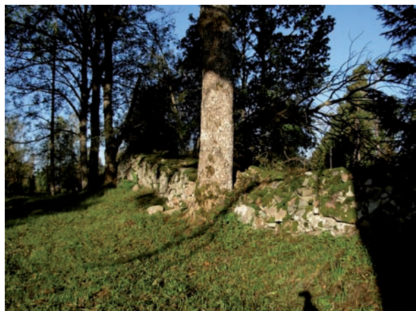
Kyrkogårdens norra sida med bevarad ängskaraktär.

Till största delen utgörs kyrkogården av en slät yta vilken hålls efter med motorgräsklippare. Endast den norra delen invid muren har fått bevara sin oregelbundna struktur med antydning till ängskaraktär. Någon regelrätt trädkrans finns inte, även om man i anslutning till de bevarade murarna finner