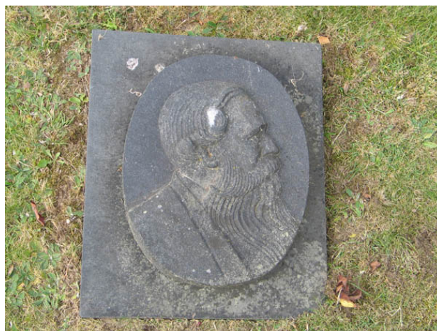
En ovanlig linjegravvård. Enligt uppgift ska den döde själv ha tillverkat vården med sitt porträtt. Vem han var har dock fallit i glömska och inga personuppgifter finns på vården. Den ligger bland de äldsta linjegravarna från 1920-talet i kvarterets södra del. (KI Örsjö kyrkog 044)