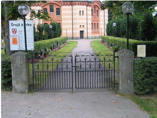
Ingång till kyrkogården i nordväst. (KI Örsjö kyrkog 001)

En minneslund finns på den nya kyrkogården som anlades nordost om kyrkan på 1980-talet.