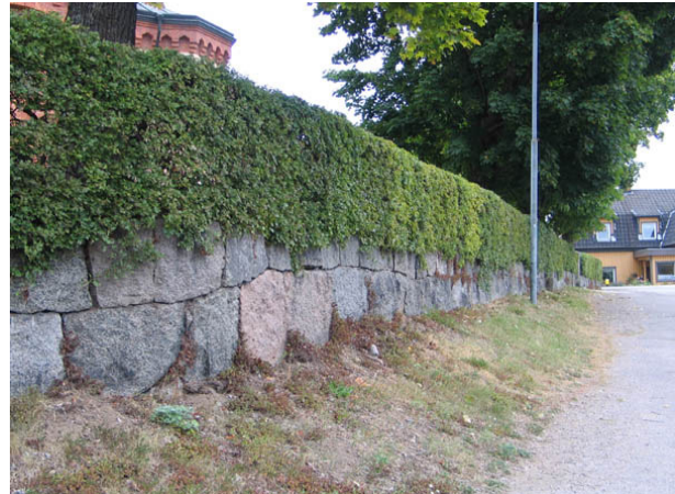
Stödmur och hagtornshäck som omgärdar kyrkogården i öster. (KI Örsjö kyrkog 006)