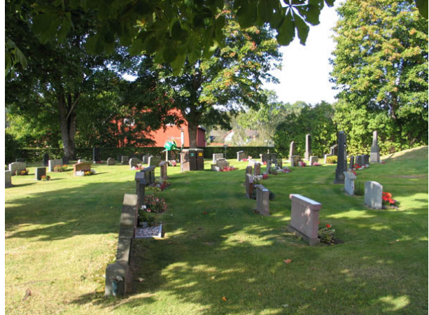
Kvarter B från öster. (KI Örsjö kyrkog 027)

låga och mycket breda. Man kan av deras utformning ana att de tidigare varit omgärdade. Denna typ av vårdar blev vanliga under 1930-40-talen. Materialet är främst grå och svart granit men även röd förekommer. Att ange yrkestitlar är relativt vanligt. De som finns är hemmansägare, kyrkvård, nämndeman, gästgivare, kantor, häradshövding, häradsdomare, fabrikör och stationsinspektör. Samtliga titlar får sägas höra hemma i socknens övre sociala skikt. På majoriteten av gravvårdarna är den dödes hemby eller gård angiven.