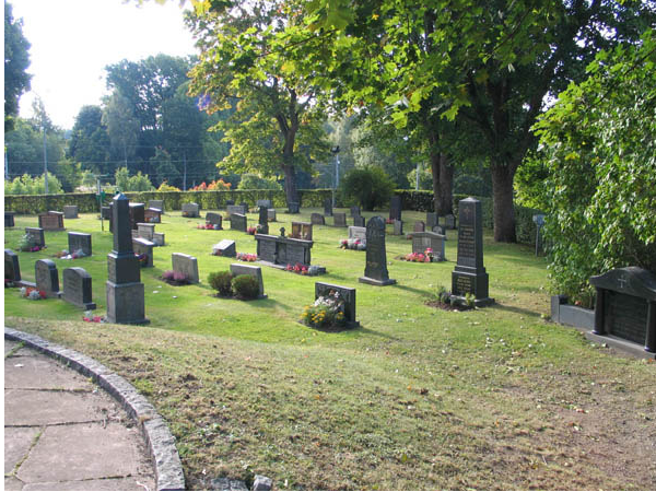
Kvarter B från väster. (KI Örsjö kyrkog 026)

Majoriteten av gravvårdarna i kvarteret är låga rektangulära gravvårdar med enkel dekor typiska för 1970- och 80-talen. De gravvårdar man först lägger märke till i kvarteret är dock de höga gravvårdar från tidigt 1900-tal utformade med klassicistiska influenser. Från samma tid finns även enstaka enkla gravvårdar. Det finns också ett mindre antal gravvårdar som är