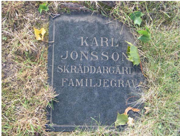
Bland gravvårdarna i kvarter B finns flera olika typer av vårdar. Denna enkla liggande gravvård finns i östra delen av kvarteret. (KI Örsjö kyrkog 028)