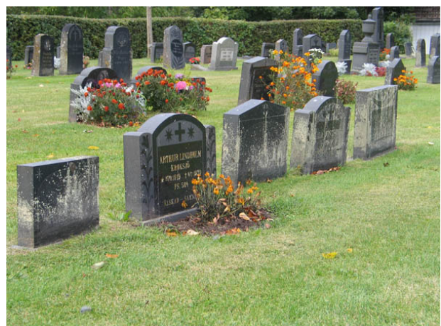
En del av linjegravsområdet i kvarter C. Gravvårdarna står tätt. I synnerhet på de yngre delarna av linjegravsområdet. Vårdarna närmast i bild är från 1939. (KI Örsjö kyrkog 039)