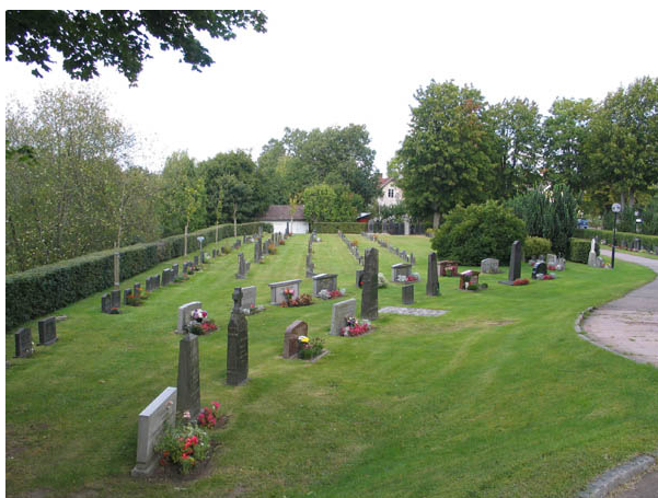
Kvarter C från öster. Närmast i bild några av kvarterets köpta gravplatser och därbakom linjegravsområdet. (KI Örsjö kyrkog 035)

Kvarteret är beläget väster och sydväst om kyrkan. Det omfattar 318 gravplatser. Närmast kyrkan är köpta gravplatser placerade i två bågformade rader vända mot kyrkan. I kvarterets norra del är gravvårdarna ryggställda mot en häck av avenbok. Här står också en rad med knuthamlade almar. Största delen av kvarteret upptas av ett linjegravsområde. De nordligaste raderna i detta område är ryggställda mot en häck av ölandstok. Majoriteten av gravvårdarna är vända mot norr. I linjegravsområdet finns enstaka lediga gravplatser. I kvarteret står den andra av kyrkogårdens två äldsta gravvård från 1893. Det är J. G. Pettersson från Kopparflys gravvård. Ett fåtal gravvårdar är från tidigt 1900-tal. Den äldsta linjegravvården är från 1924 och linjegravsområdet har därefter brukats kontinuerligt fram till 1955. Hela kvarteret har kontinuerligt brukats fram till idag.