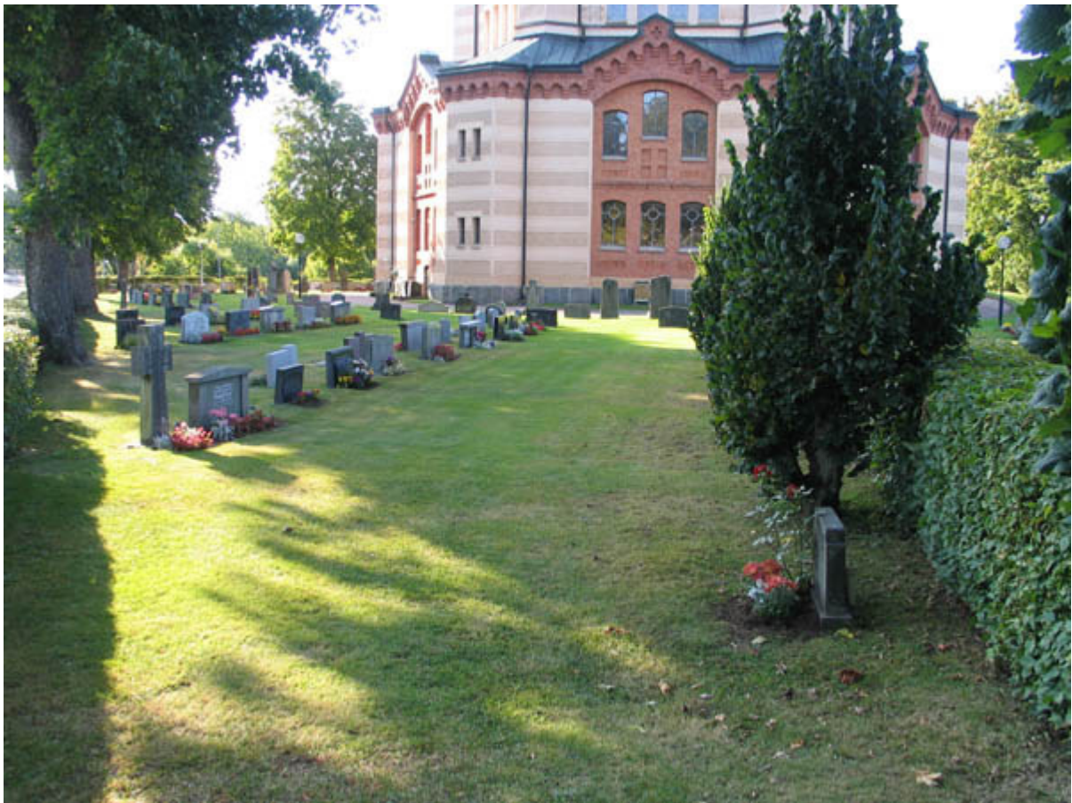
KI Örsjö kyrkog 017

Kulturhistorisk inventering av kyrkogårdar/ begravningsplatser i Växjö stift 2005