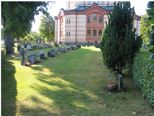
Kvarter A från nordväst. (KI Örsjö kyrkog 017)

Kvarter A omfattar 250 gravplatser norr och nordväst om kyrkan och den gången som leder till kyrkogårdens ingång i nordväst. I kvarterets södra del är fyra rader närmast gången med gravvårdar ryggställda med varandra. Mellan två av dessa rader är en häck av avenbok planterad tillsammans med en rad av knuthamlade almar. Gravvårdarna i de ryggställda raderna är vända mot norr eller söder medan de i övrigt är vända mot söder. Kvarteret har brukats kontinuerligt under hela 1900-talet. Den äldsta vården från 1893 är en av kyrkogårdens två äldsta vårdar. Kvarteret har brukats kontinuerligt under hela 1900-talet men flest gravvårdar finns från perioden 1950-79.