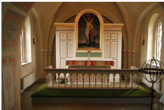
Altaruppsatsen i koret.