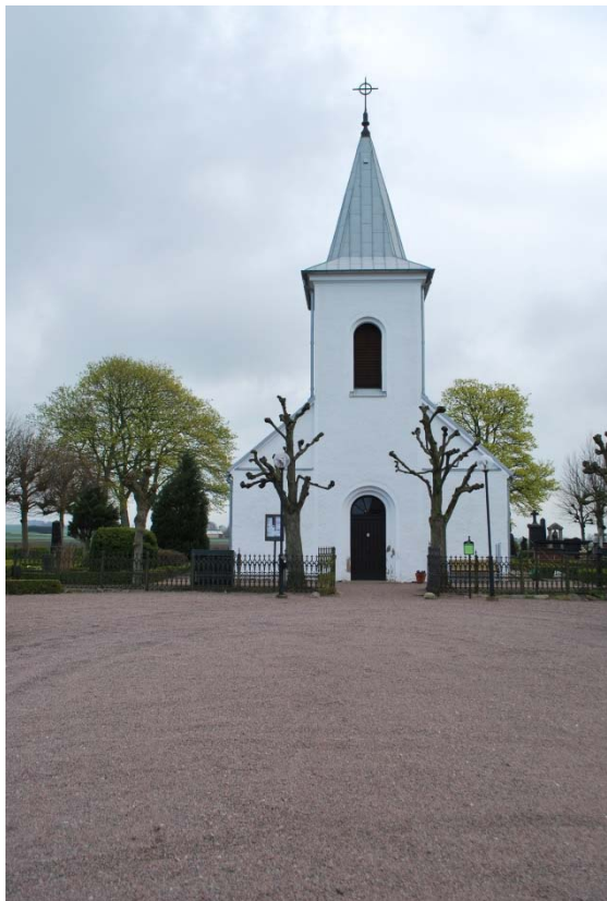
Kyrkan från väster.

omfattning. Fönsteröppningarna vidgar sig utåt med ett språng. De svartmålade gjutjärnsbågarna är krysspröjsade och avslutas uppåt med rundbågar och cirklar. Solbänkarna är av kalksten.