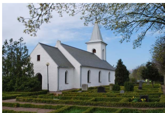
Kyrkan från nordöst. Kyrkogården på norra sidan.