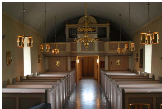
Långhuset mot läktaren i väster.