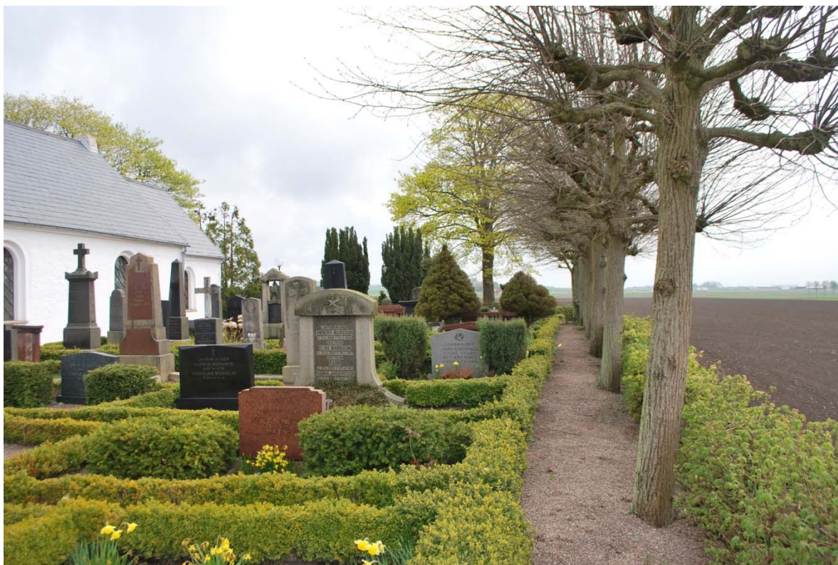
Kyrkogården på södra sidan.

I nordöstra hörnet finns en minneslund, en gräsmatta med en natursten. I kanten av minneslundan finns ett lapidarium med en rad äldre gravstenar.