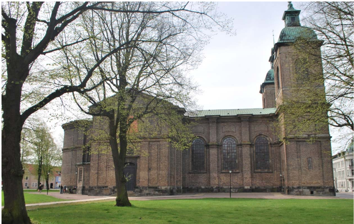
[1]: Kyrkan mot norr

Kyrkan har totalt sex ingångar; de tre portalerna mot kyrkorummet, dörrar till sidoutbyggnaderna och en handikappentré genom norra tornet. Portalerna inramas av sandstenslistverk. Västportalens pilastrar bär ett tympanonfält med en vapentavla. De tre portarna är raktäckta med gråsvart målade spegeldörrar av helfransk typ. Ovanför dessa finns raka resp. segmentformade överljus med radiella spröjsverk. Övriga dörrar är rakslutna spegeldörrar med utvändig paneltäckning i fiskbensmönster. Ingångarna nås genom yttertrappor i granit och kalksten. Handikappentrén är i marknivå.