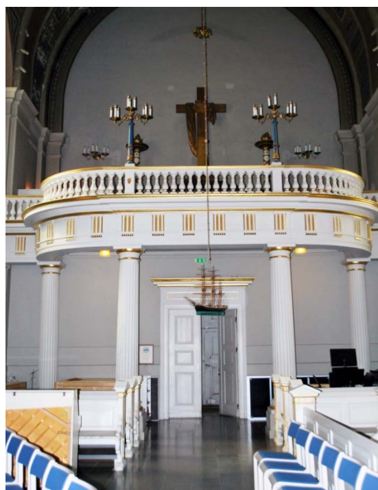
[3]: Södra korsarmen med sidoläktare