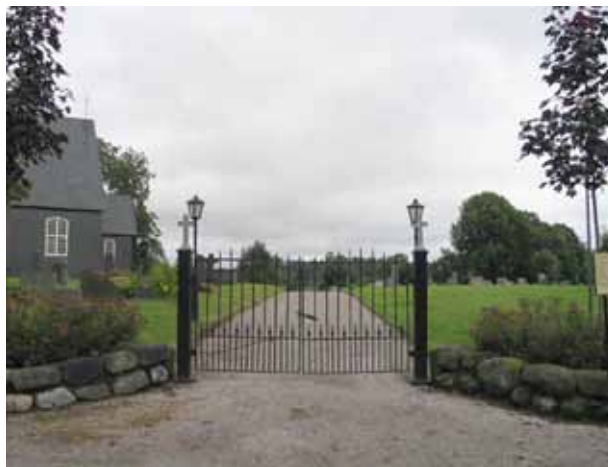
Kyrkogårdens huvudingång i nordväst. Kv. G direkt till höger. (KI Gladhammar 0105)