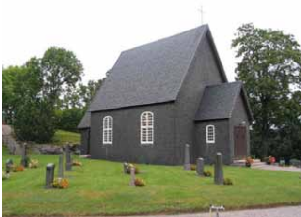
Gladhammar kapell mot nordost. KI Gladhammar 0110