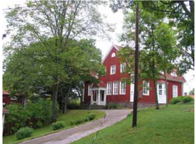
Gladhammar skola, numera församlingshem, mot nordost, i nederkant lärarbostaden. KI Gladhammar 0107

År 1950 upprättades ritningar över ett nytt område i öster, med vilket kyrkogården skulle utvidgas. Trädgårdskonsulent Erik Palmgård, Västervik stod bakom utformningen. Marken tillhörde församlingens sk. klockarejord. Det kraftigt lutande området utjämnades och en hög stödmur anlades i öster. Man planerade att området skulle kunna rymma omkring 365 familjegravar och ensamgravar. Enligt arbetsplanen skulle rygghäckar planteras längs familjegravarna i norra området. Dessa verkar aldrig ha kommit till stånd. Längs den nya östra kyrkogårdsgränsen planterades lindar. Två trappförbindelser anordnades mellan gamla kyrkogården och den nya delen. Till det nya kvarteret, betecknat F, anordnades en ny ingång i sydväst.