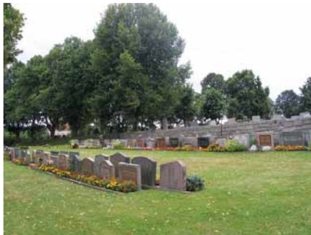
Kv. F, den norra delen med täta rader av vårdar. Bild tagen mot sydväst. (KI Gladhammar 0169)