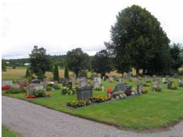
Kv. C från nordväst. (KI Gladhammar 0139)