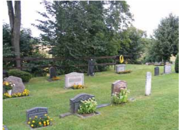
Kv. B med bl a rester av linjegravar, och med en av två trävårdar. (KI Gladhammar 0132)