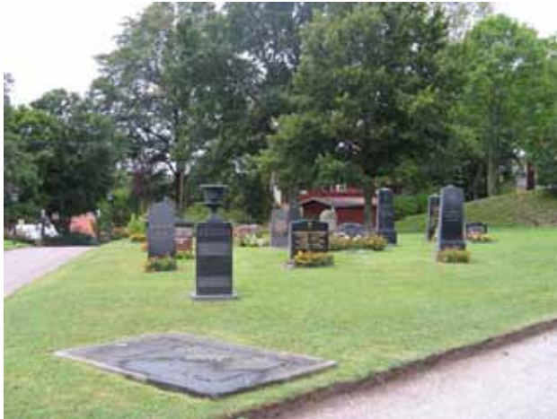
Kv. A mot väster. (KI Gladhammar 0124)

hälften av vårdarna har ortnamn angivet i inskriptionen, främst Gunnebo. Titlar förekommer bara i två fall, trävaruhandlaren och brukstjänstemannen.