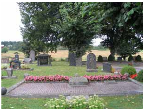
Den enda grusgraven (C 78) i förgrunden och två vårdar från 1800-talets slut i bakgrunden. (KI Gladhammar 0141)