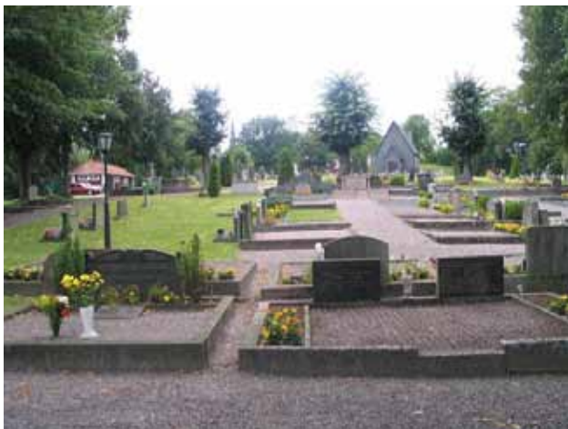
Kv. E mot norr .KI Gladhammar 0163

Kvarter E består av omkring 100 gravplatser och är beläget på kyrkogårdens sydligaste del. Kring kvarteret finns en trädkrans av lind som i väster och söder består av kyrkogårdens avgränsande trädkrans och i öster och norr av träd som planterats som omgärdning för just kvarter E. I norr och söder har enstaka träd tagits ned. Kvarteret har en i det närmaste rektangulär form. En rad av gravplatser löper längs områdets sidor, medan rester grupperas i rader i nord-sydlig riktning och öst-västlig riktning (se gravkartan). Övervägande delen av kvarteret består av gravplatser som är omgärdade av stenram och belagda med grus. I en del av kvarterets västra del har gräs såtts i och stenramar tagits bort, medan gravvårdarna finns kvar. Detta gäller ungefär 15 gravplatser samlade i ett område samt ytterligare ett par spridda platser. Totalt finns sju lediga gravplatser där gravplatsen är grusbelagd och stenramen finns kvar. Ytterligare enstaka gravplatser är lediga och gräsbesådda. Grusgångar finns i området mellan de olika raderna. På några av gravplatserna finns vintergröna buskar planterade som tuja och sockertoppsgran, i ett fall buxbom. En kyrkogårdsingång som leder direkt till kv. E finns i nordvästra delen av kvarteret. I nordost finns en trappa som leder till kv. F.