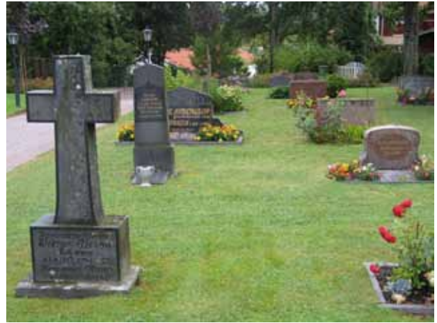
Kv. A mot väster. (KI Gladhammar 0129)