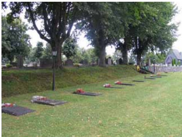
Kv. F, den sydvästra delen med liggande hällar., Kv. E i bakgrunden. (KI Gladhammar 0167)

Kvarter F består av omkring 300 gravplatser och ligger som en långsmal och, i terrängen, lägre belägen utvidgning av kyrkogården i öster. I öster omges kvarteret av den delvis glesa trädkransen. I den södra delen av kvarteret utgör lindarna kring den östra sidan av kvarter E en grönskande fond. Hela området är gräsbevuxet och gångsystem saknas. Till området kommer man via trappor från kv. E eller B-C i väster eller via en egen ingång i söder. I den södra delen av kvarteret finns ett drygt 50-tal gravplatser som ännu inte upplåtits vilket lämnar en tom yta.