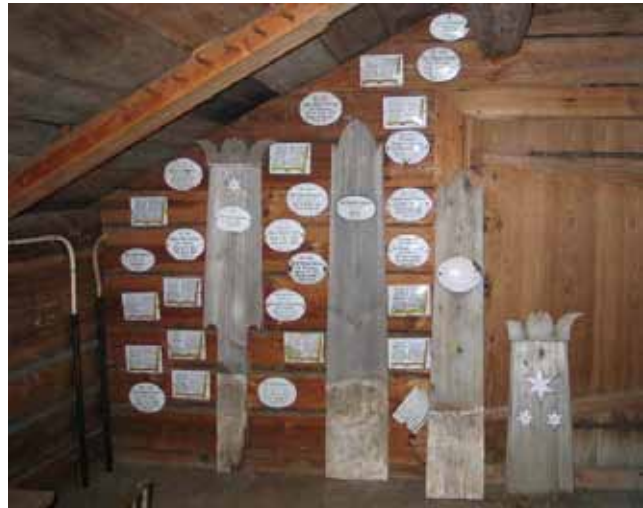
Gravvårdar och inskriptionsplattor som tidigare funnits på kyrkogården i Gladhammar. Nu på hembygds museet i grannbyn, Lunds by. (KI Gladhammar 0091)