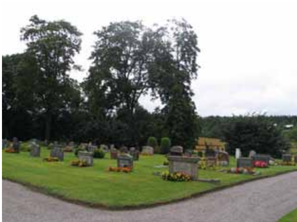
Kv. B mot nordost. (KI Gladhammar 0132)

antal vårdar i kvarteret har tillkommit under 1960-1990-talen. Endast en titel förekommer, änkefru, medan bruket av ortnamn är mer frekvent, dock ej vanligt förekommande.