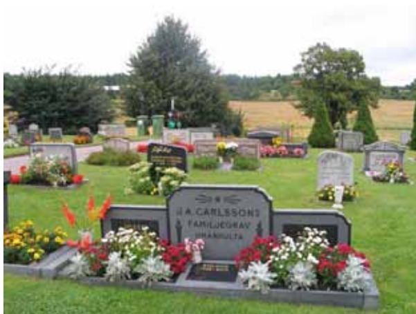
Kv. C exempel på gravvårdstyper. (KI Gladhammar 0143)