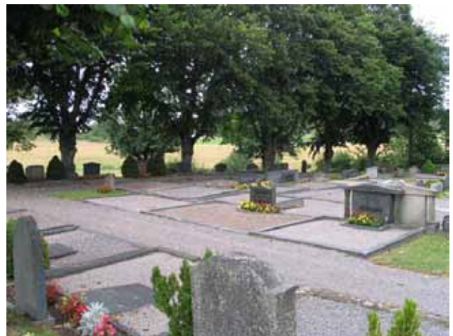
Kv. E det nordöstra hörnet. KI Gladhammar 0155