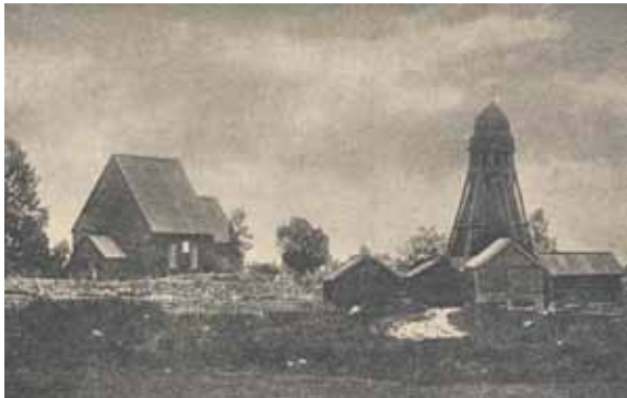
Gladhammar kyrka från sydväst. Vykort år 1887, två år före kyrkans rivning.

ersatts av en stenmur och kyrkogårdens gravvårdar har markerats som tätt stående vårdar i form av kors eller stavar, sannolikt mestadels av trä. Ett fotografi från 1887 visar kyrkan från väster med kyrkogård utan högre vegetation, möjligen med undantag av trädkrans i öster och norr. Kring kyrkogården finns en stenmur. Söder om kyrkan står en klockstapel och sydväst om kyrkogården finns en rad bodar. Exakt vilken placering den gamla kyrkan hade på den nuvarande kyrkogården har inte kunnat klarläggas inom ramen för detta arbete, men klart är att den var orienterad i öst-västlig riktning.