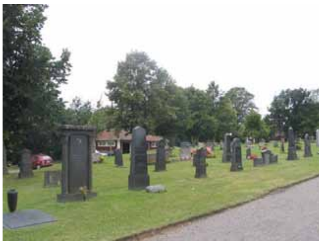
Kv. D mot nordväst. Äldre vårdar i de främre raderna. (KI Gladhammar 0149)

Kv. D rymmer ca 80 gravplatser och ligger i kyrkogårdens mitt, söder om kapellet mittemot kv. C. Kvarteret avgränsas av grusgångar i norr och öster. Hela kvarterets yta är besädd med gräs. Gravplatsraderna löper i nord-syd gående rader med stenarnas framsida vända mot öster. Kvarteret rymmer större och mindre familjegravar. Stora lindar som tillhör kyrkogårdens trädkrans och den trädkrans som omger kv. E utgör fond i väster och söder. Kvarterets profil är varierad med höga, äldre vårdar främst lokaliserade till områdets östra och södra del medan de bakre raderna från gången sett består av lägre vårdar av mer ensartad karaktär.