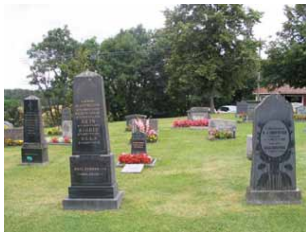
Kv. D mot väst. Äldre vårdar i den främre raden och yngre längre bak. Märk särskilt den högra vården med tydlig jugenddekor. (KI Gladhammar 0151)