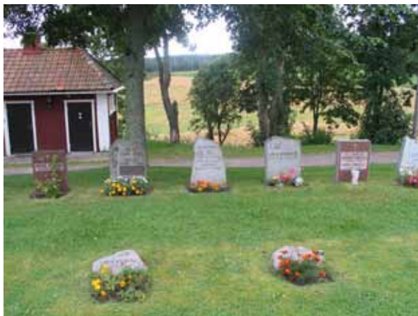
Kv. G mot väster. Servicebod med garage, kontor och toalett i bakgrunden. (KI Gladhammar 0175)

Kvarter G består av 145 urngravplatser. Endast ett mindre antal är idag upplåtna och vårdarna är placerade i två rader, en med stående vårdar och en med liggande. Området är besatt av gräs och i dess mitt står en mindre ask. Kvarteret ligger direkt till höger innanför kyrkogårdens huvudingång i förlängningen av forna kvarter D.