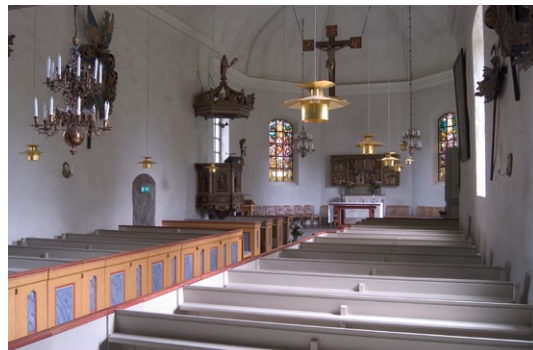
Interiör från väster.

Predikstolen i bondbarock skänktes till kyrkan 1685 av fru Anna Cronström till Balingsta. Kristusbilden högst upp är försedd med segerfana . Korgens fyllningar pryds av bilder av Kristus och de fyra evangelisterna . Mellan 1815 och 1943 var predikstolen övermålad i vitt och guld, men de ursprungliga färgerna är numera framtagna.