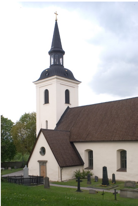
Tornet, vapenhuset och del av långhuset från sydost.

långhusets, samt ett runt blindfönster åt öster. Två av öppningarna är försedda med blyinfattade glas med glasmålningar från 1928 och de