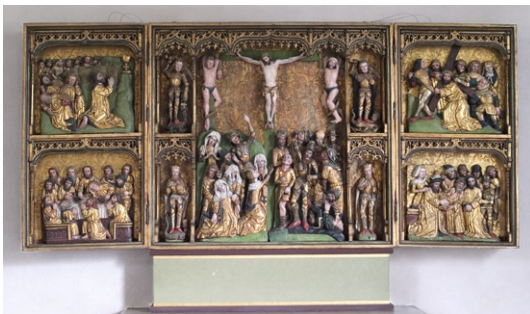
Altarskåp från 1400-talets senare del.

Kyrkans förnämsta inventarium är altarskåpet. Det tillverkades säkerligen i Nordtyskland, med största sannolikhet i Bernt Notkes verkstad, omkring 1480. Det framställer 13 scener ur passionshistorien . Fem scener är skulpterade, resten är målade. Skåpet donerades till kyrkan av herrskapet Svart på Gladö, vilka även finns avbildade på skåpsdörrarnas utsidor. Mellan altarskåpet och altaret finns en predella , som tillkom 1994. På korgolvet står ett mobilt altarbord av rödmålat trä, som även det är från 1994. Lösa knäfall i samma stil finns, vilka tas fram vid behov. Mellan koret och långhuset hänger ett triumfkrucifix , tillverkat och upphängt här 1943. Det är en kopia i mindre skala av ett kru-