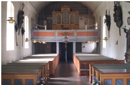
Interiör från öster.

I kyrkan ligger golv av polerade kalkstensplattor. Väggarna är vitputsade liksom kyrkorummets träunnvalv . Mellan väggar och valv löper en profilerad list. I södra långhusväggen finns ett medeltida konsekrationskors målat i rött inom en cirkel. Lite längre fram i samma vägg finns en nisch, vilken kan ha ingått i ett tidigare sidoaltare eller ett skåp för förvaring av det invigda nattvardsbrödet. Glasmålningar sattes in i samtliga korfönster 1928 och utfördes efter konstnären Per Månssons teckningar. Två av glasfönstren togs bort 1994. I ett av altarbordens framstycken är den gamla (troligen 1200-tal) altarskivan av kalksten vertikalt inmurad.