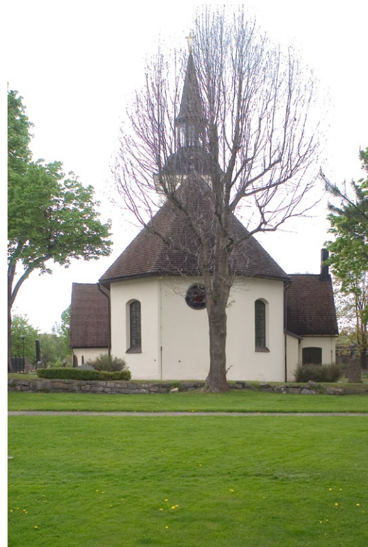
Exteriör från öster.

Entré till kyrkan sker från västgaveln, där en sandstensportal från 1754 är det enda som finns kvar av det Bunge-Mörnerska gravkoret, vilket troligen var ritat av Carl Hårleman. Sandstensportalen är målad i ljusgrått och omfattar en dörröppning med pardörrar samt ett runt överljusfönster. I vapenhusets sydfasad är en dörr-