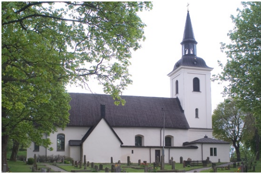
Exteriör från norr.

långhusets, samt ett runt blindfönster åt öster. Två av öppningarna är försedda med blyinfattade glas med glasmålningar från 1928 och de