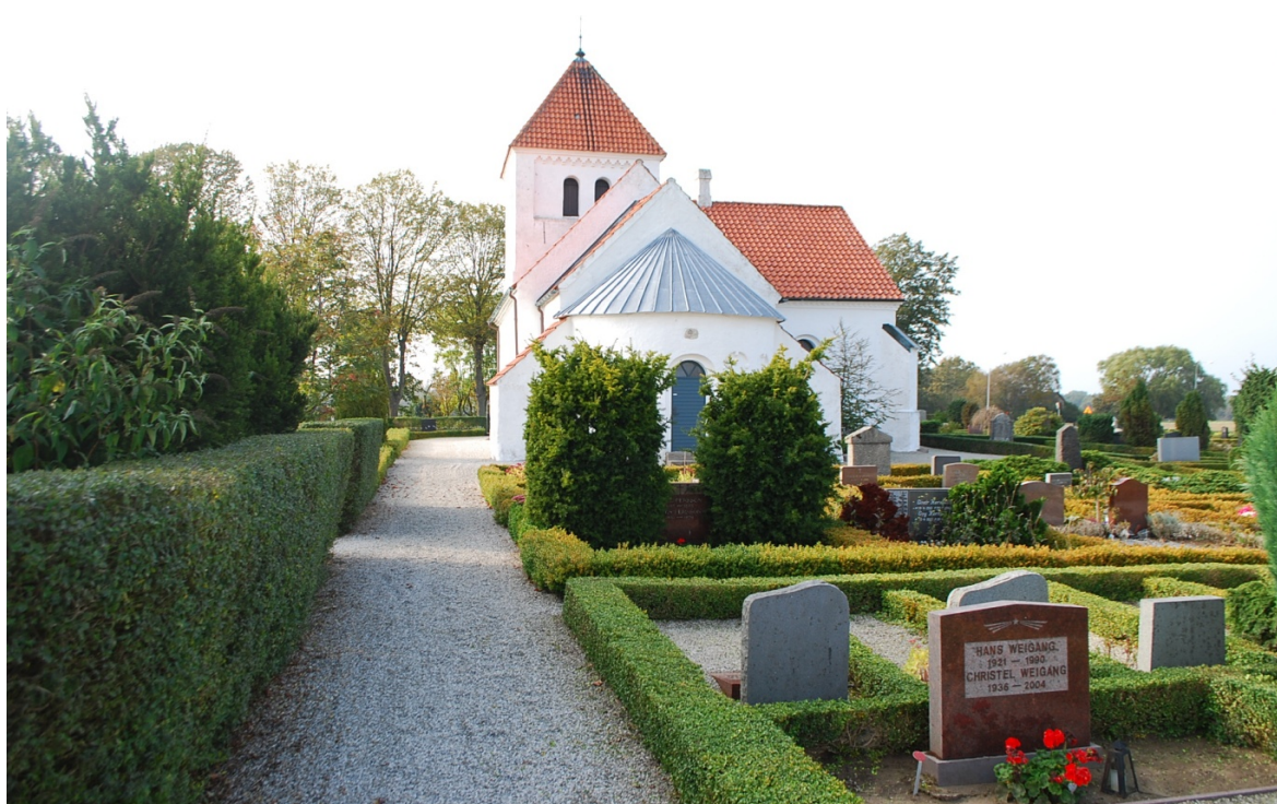
[6]: Kyrkogården sedd från öster. Till vänster minneslunden innanför en buxbomshäck.

Ett område i nordöst är avgränsat för urngravsättning. På gräsmattan intill de resta stenarna står en vindflöjel med ett gapande drakhuvud och årtalet 1851 med genombruten text. Denna vindflöjel satt på kyrkspiran fram till 1912, då den ersattes av dagens konstruktion. Minneslunden i nordväst är gestaltad som en öppen, cirkulär grässatt plats omgärdad av en singelgång, avgränsad med växter mot den traditionella begravningsplatsen. I växtkransen märks bl.a. olika marktäckare, buxbombsbuskar och sorgeträd i form av hängbjörkar. I hörnet mot landskapet finns en liten fältsten och blomsterhållare. Askgravplatsen i väster har en enkel gestaltning med en grässatt yta, ett träd och en ljushållare. Minnesplaketterna ligger direkt i gräset.