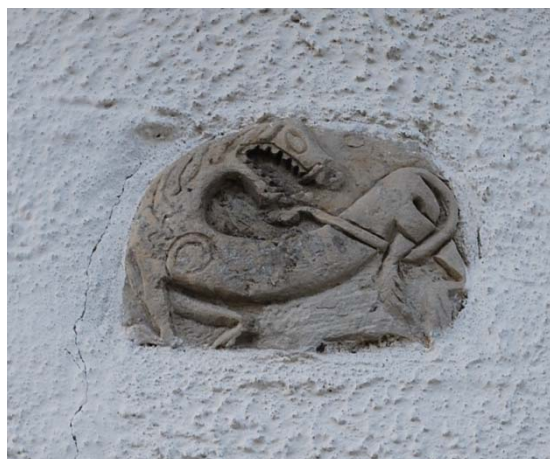
[2]: Lejonrelief i absidfasaden

Trappornet är byggt i tegel med en oputsad naturstenssockel på båda sidor. Av tegel är även tornets övre del, som är lätt indragen från den medeltida basen. Längs bjälklagsnivåerna finns flera ankarslutar, både raka och linjeformade. I vardera väderstreck finns två rundbågiga ljudöppningar innanför en stor, indragen rektangulär yta, uppåt avgränsad av ett droppskift mot takfotens flersprångiga listverk. Ett motsvarande listverk återfinns tillsammans med ett litet tandsnitt på trappornets gavlar.