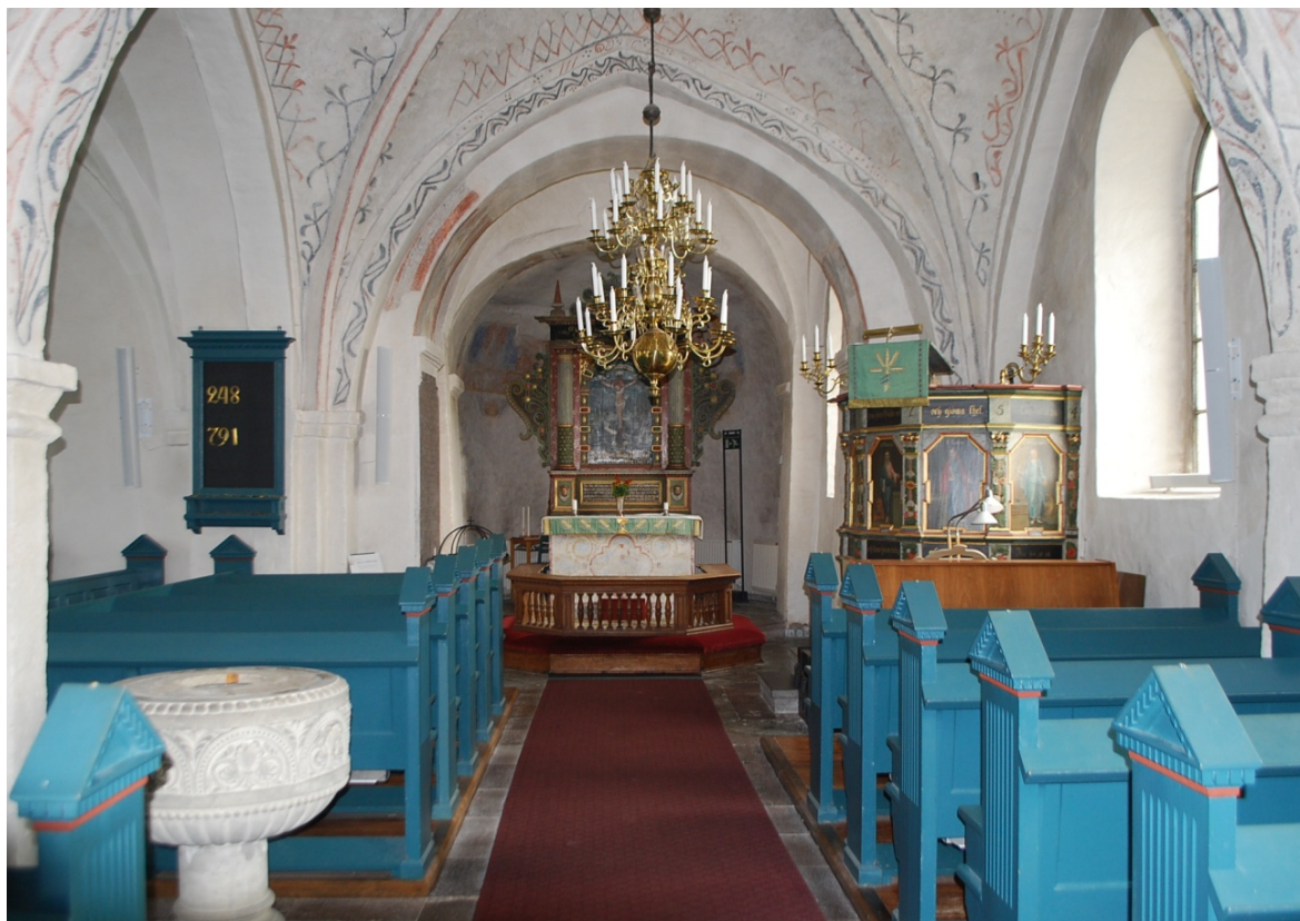
[3]: Vy från långhuset mot koret

med slanka, svarvade balusterdockor, som bär överliggarens utkragande listverk.