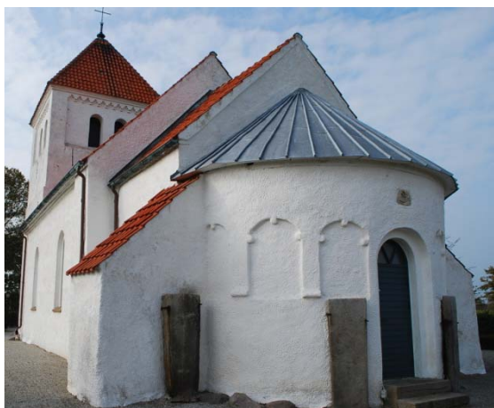
[1]: Absidfasaden med blindarkad

kyrkans fasader avlastas, liksom absidens, av murade kontreforter avtäckta med plåt respektive taktegel. Sockeln är hög, i höjd med fönsterbänkarna och svagt förkroppad relativt dagemurarna. Gavelröstet i norr är dekorerat med ett flersprångigt listverk mot takfoten, och indelat i fyra stycken triangeltäckta blinderingar i två språng. I de mittersta fälten sitter varsin rektangulär öppning. Överst vid taknocken finns en rombformad blindering i två språng.