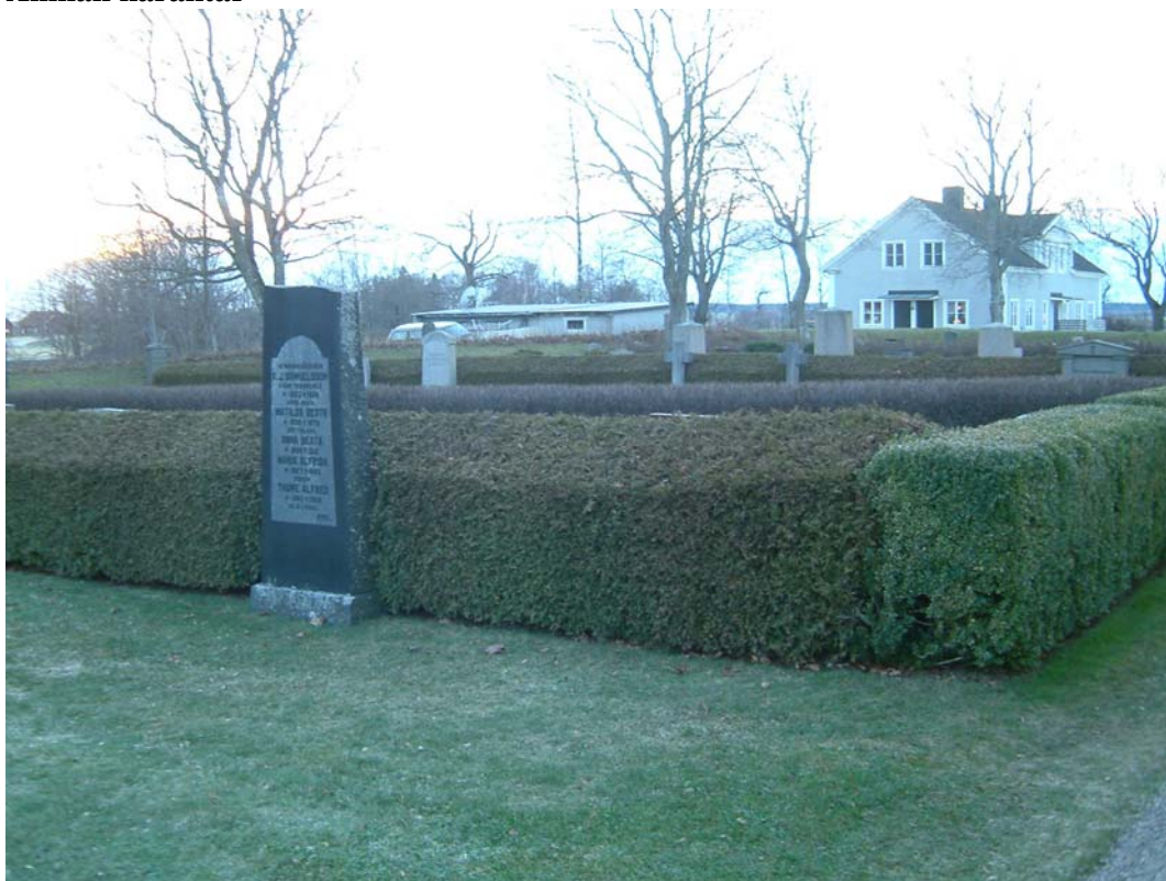
Kvarter F. De kraftiga häckarna bildar slutna rum.

Kvarteret ligger direkt söder om kyrkan. Kraftiga häckar bildar två halvslutna rum, den östligaste och den västligaste tujan är takåsklippta. Längst i väster finns en rad med nästan enbart grusgravar med kedjor med mera.