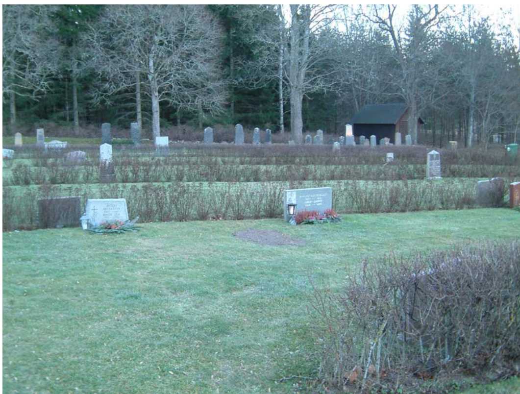
Kvarter E består av raka rader gravar med rygghäckar.

Kvarteret består av enkla raka rader gravplatser utefter ett system med 5 nordsydliga rygghäckar. Karaktären är öppen och ges av häckarna och de höga tujorna i allén i norr.