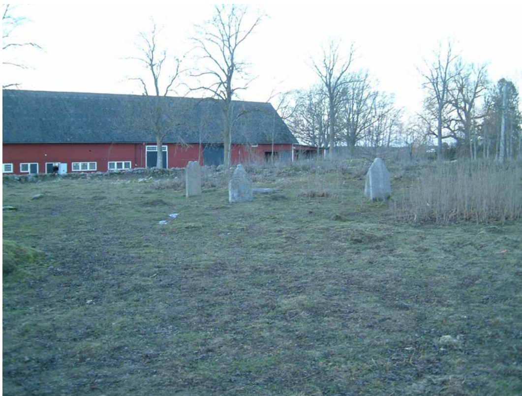
Varvs ödekyrkogård. Uppställda 1600-talsgravstenar.

Varvs församling omnämns redan 1293 som Hvarf. Den medeltida kyrkan bar romanska drag och var förmodligen tillkommen under 11- eller 1200-talen. Kyrkogården har förmodligen ännu sina medeltida proportioner och ligger mitt i Varvs by.