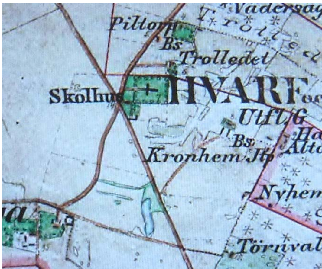
Varv-Styra kyrkogård på häradskartan från 1870-talet. Anläggningen är rektangulär med trädkrans markerad. Landsvägskorset mellan RV 32 och vägen till Varv har en annan sträckning än idag. Av skolhusen är endast det äldsta markerat.

Väster om kyrkogården finns idag en parkering och flera olika generationer av byggnader tillhörande Varvs skola, nedlagd för några år sedan. Den äldsta skolbyggnaden ligger längst i söder och är konverterad till bostadshus. Direkt bortom skolan finns huvudvägen Skänninge-Motala (RV 32) med tung trafik. Norr om kyrkan finns en del småskalig bebyggelse, Piltorps jordbruksfastighet och vägen mot Varvs by. Öster om kyrkogården finns en grusås med tät skog med flera svackor. På ett högre parti strax öster om kyrkogården finns ett stensträngssystem och ett gravfält från järnålder. Söder om kyrkan ligger ett skogsparti i ett igenväxt gammal grustag eller möjligen en större naturlig svacka.