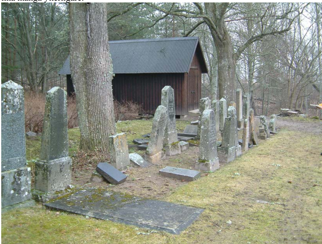
Raden av undanställda äldre vårdar i nordöst. Flera av dem tyvärr i mycket dåligt skick och andra svårt lavöverväxta.

Ytterligare ett stort antal ursprungliga höga smala gravvårdar från 1800-talet finns bland de i nordöstra hörnet undanställda stenarna. Flera av dessa är dock så överväxta med lav eller skadade att datumen inte kan fastställas. Det rör sig dock om minst 8 och troligen lika många ytterligare.