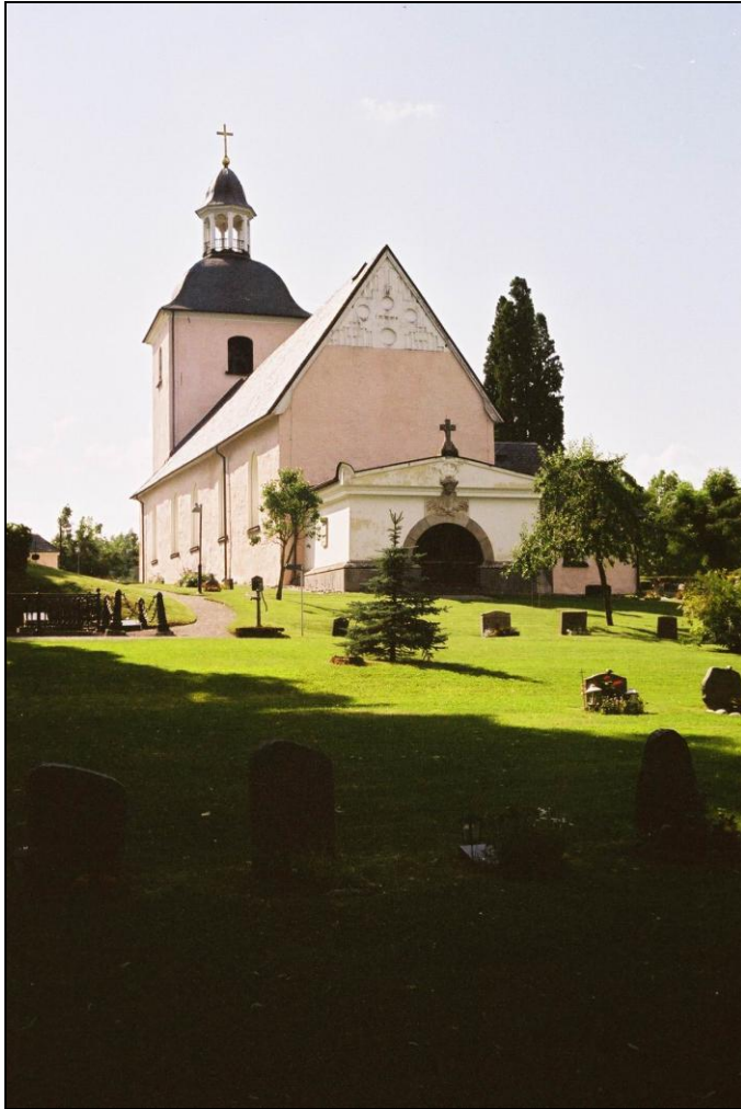
Västra Ryds kyrka från sydöst med blinderat gavel och Rålamska gravkoret. Foto: Lisa Sundström, augusti 2004.