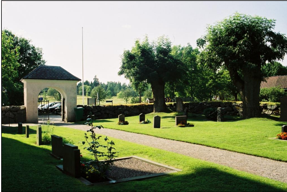
Västra Ryds kyrkogård söder om kyrkan med stiglucka och äldre träd. Foto: Lisa Sundström, augusti 2004.