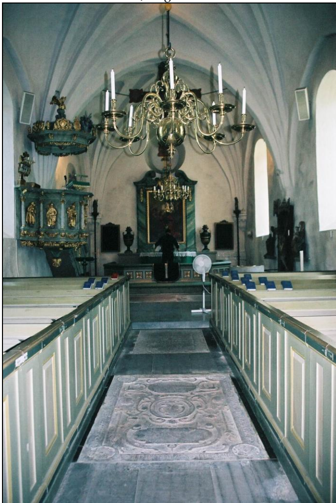
Västra Ryds kyrka. Interiör åt öst. Foto: Lisa Sundström, augusti 2004.