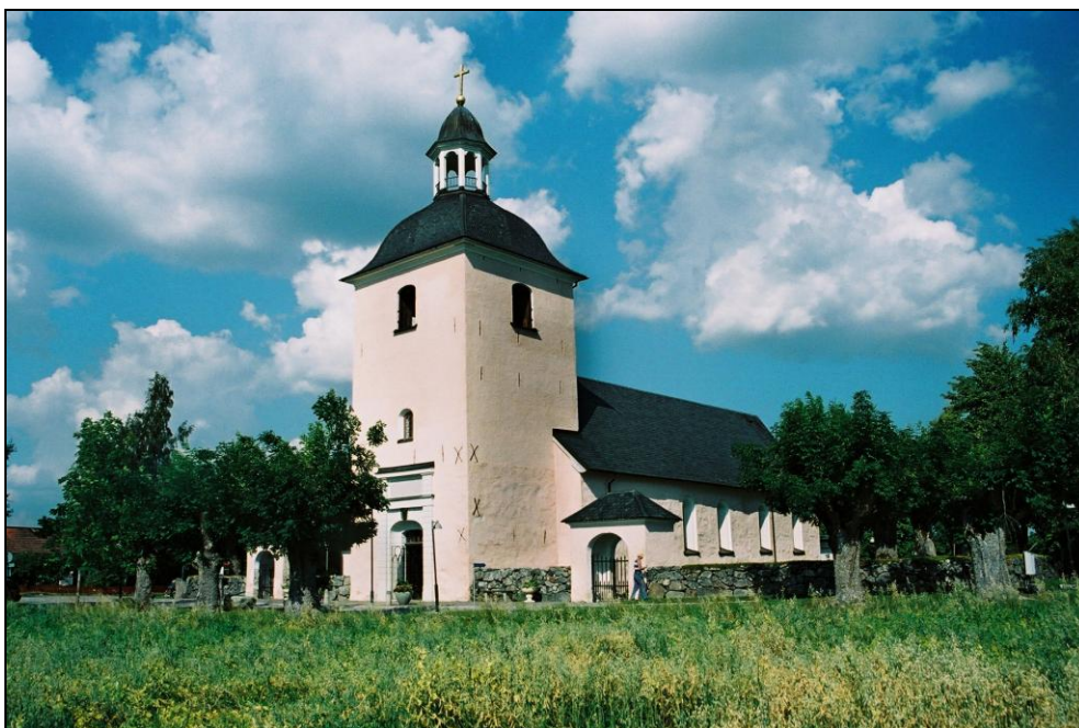
Västra Ryds kyrka från sydväst. Tornbyggnaden är uppförd år 1767 och täcks av en karnisformad huv med lanternin. Kyrkan avfärgades rosa år 1984 efter att en tid ha varit gulfärgad. Stigluckorna på vardera sidan av tornet är samtida med tornet.