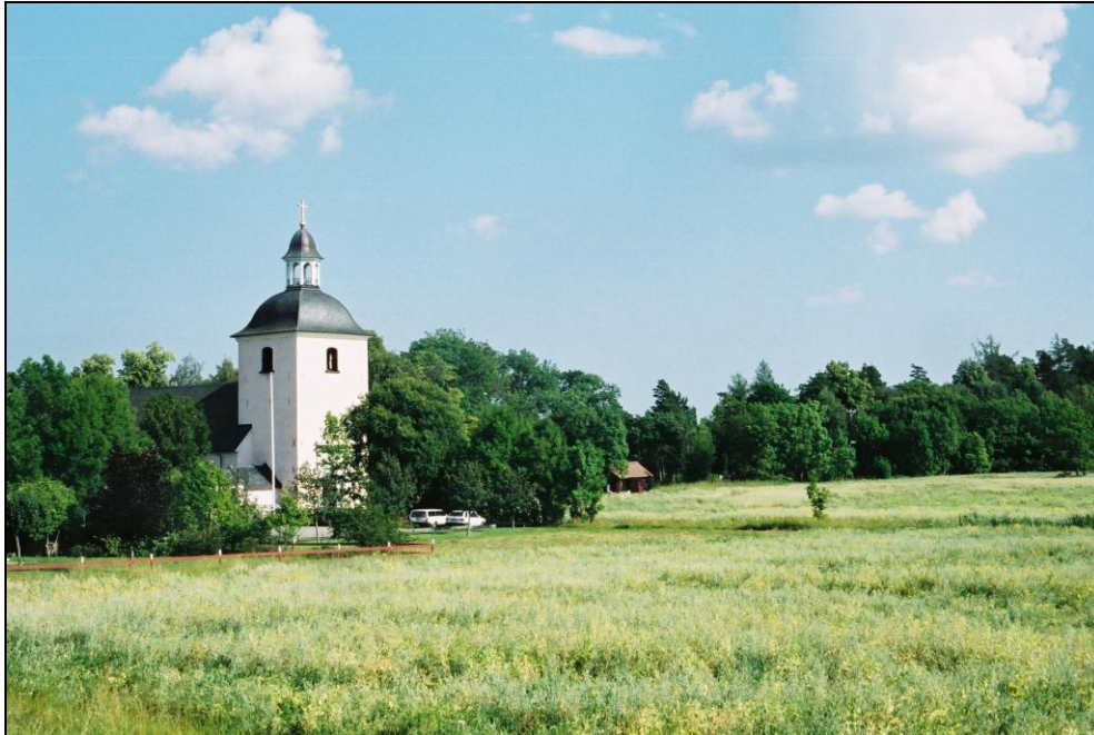
Västra Ryds kyrka från nordväst.