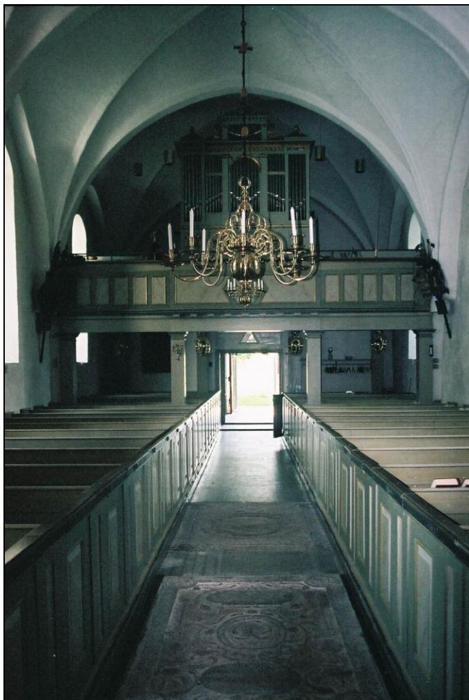
Västra Ryds kyrka. Interiör åt väst. Foto: Lisa Sundström, augusti 2004.