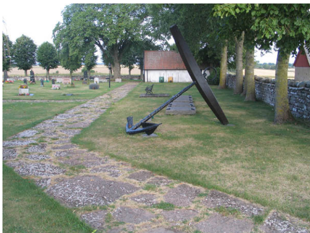
Monumentet över de omkomna ombord på Kronan 1676. (KI Hulterstad kyrkog 013)