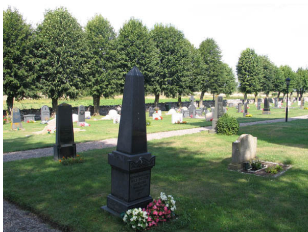
Fyra av de fem gravvårdarna i kvarter H.