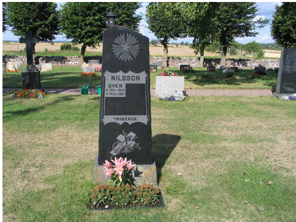
En hög svart gravvård som ursprungligen måste ha tillverkats omkring sekelskiftet har här återanvänts genom att vården fått en ny inskription. Kvarter F. (KI Hulterstad kyrkog 045)

olika tider. I kvarter F är flest antal vårdar från slutet av 1800-talet och början av 1900-talet med man i kvarter G inte kan urskilja någon period som mer representerad än andra. De flesta gravvårdarna är av svart eller grå granit men det finns också vårdar av röd granit och kalksten. I kvarter F finns två höga gravvårdar av svart granit som kröns av marmor kors. Denna typ av vård är inte så vanlig. I kvarter G finns ett modernt träkors. Att ange yrkestitlar förekommer i båda kvarteren. De vanligaste titlarna är lantbrukare, hemmansägare och ålderman, men det finns också titlar som fiskare och bysmed. På majoriteten av vårdarna finns angivet från vilken by eller gård den döde kommer.