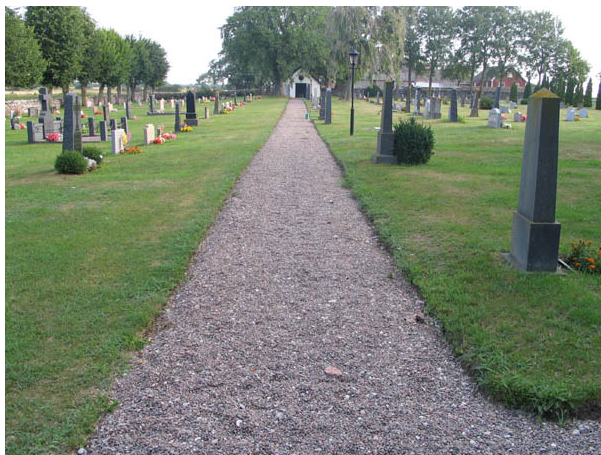
Grusgången från kyrkan mot bårhuset i norr. Till vänster kvarter C och till höger kvarter H och F.