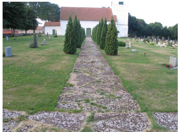
Gång belagd med kalkstensflis fram till kyrkans norra ingång. Till vänster kvarter G och till höger kvarter F. (KI Hulterstad kyrkog 012)