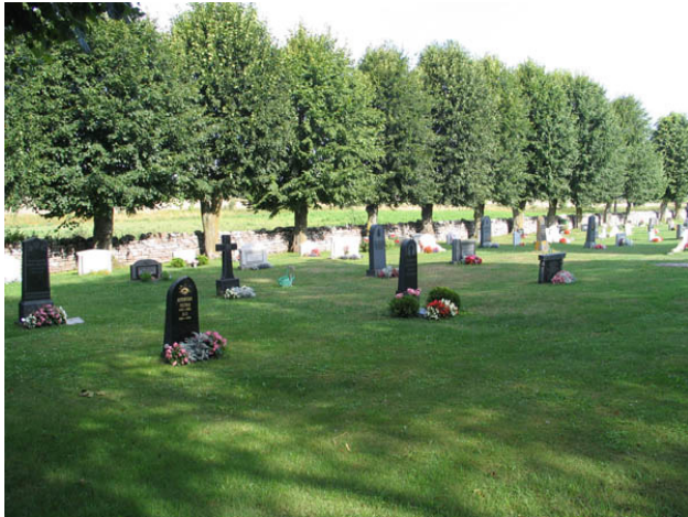
Kvarter B från sydväst. (KI Hulterstad kyrkog 027)

början haft en bestämd anläggningsform. Här är gravvårdarna placerade i raka rader och kvarteren andas ordning och enhetlighet.