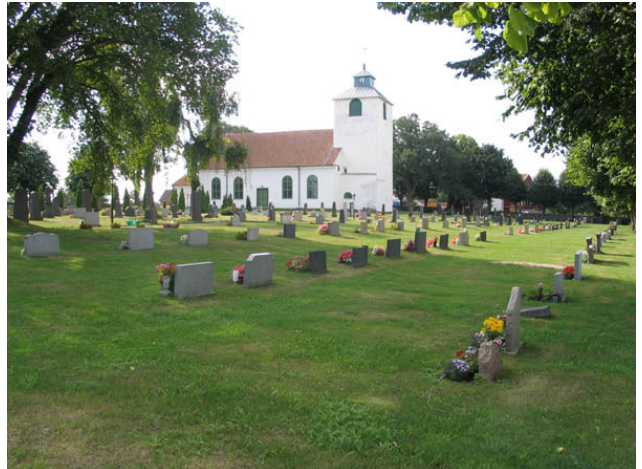
Kvarter D från nordsväst. (KI Hulterstad kyrkog 038)