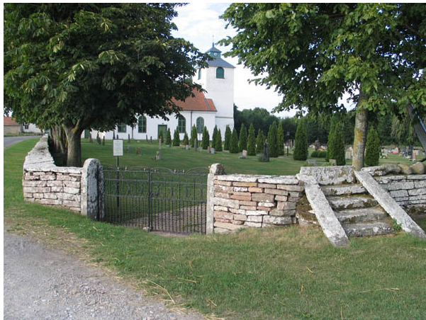
Kyrkogårdens ingång i nordost med dubbla smidesgrindar och klivstätta. (KI Hulterstad kyrkog 005)

Gångar leder fram till kyrkans ingångar och till bårhuset i norr. De sammanbinder kyrkogårdens olika delar och i en del fall fungerar de också som gräns för gravkvarter. Gångarna söder om kyrkan och norr ut fram till bårhuset är belagda med grus medan gångarna från kyrkans ingång i norr samt från ingången i nordost fram till bårhuset är belagda med kalkstenplattor. Tidigare fanns flera gångar som idag är insådda med gräs. Man kan dock fortfarande se var de gick.