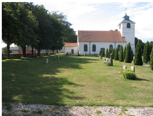
Kvarter G från norr. (KI Hulterstad kyrkog 051)