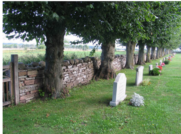
Kyrkogårdens mur och raden av hamlade lindar i väster. (KI Hulterstad kyrkog 009)