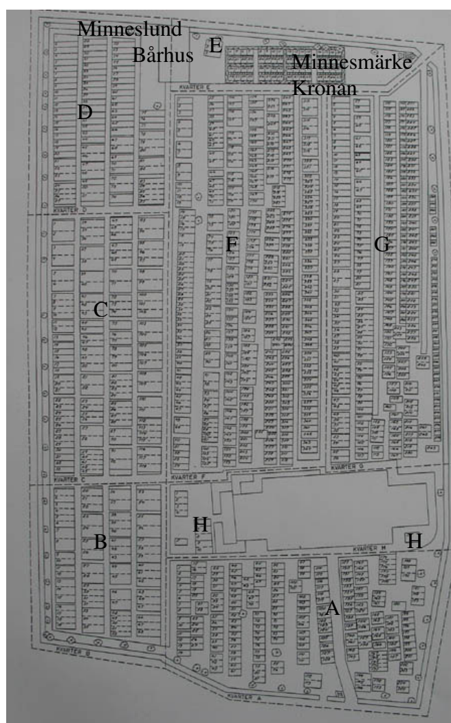
Karta över Hulterstads kyrkogård.