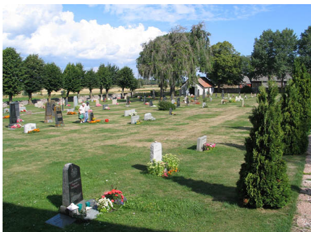
Kvarter F från sydost. (KI Hulterstad kyrkog 050)

Norr om kyrkan ligger kvarteren F och G. De ligger i kyrkogårdens längdriktning och skiljs åt av en gång kantad av höga tujor. I väster avgränsas kvarter F av ytterligare en av kyrkogårdens gångar. Kvarter G avgränsas i öster av kyrkogårdens mur. I söder utgör kyrkan gräns och i norr gången mot kvarter E. De båda kvarteren är kyrkogårdens största med flest planerade gravplatser. Kvarter F beräknas rymma 364 och kvarter G 298 gravplatser. 66 av platserna i kvarter G är planerade för urngravar. I båda kvarteren finns dock stora ytor med lediga gravplatser, framförallt i norra delen av kvarter G. I nordvästra delen av kvarter F växer två hängaskar.