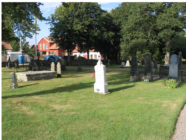
Kvarter A från nordost. (KI Hulterstad kyrkog 018)

Kvarteren A, och H är de äldsta områdena på kyrkogården. Söder om kyrkan ligger kvarter A som beräknas rymma 205 gravplatser. Här finns flera av kyrkogårdens äldsta gravvårdar. Kvarter H sträcker sig från ett område väster om kyrkans torn och fram till vinkeln mellan koret och långhuset. Kvarteret omfattar endast 10 gravplatser. Gravvårdarna i kvarteren är placerade i rader där majoriteten av vårdarna är vända mot öster och i annat fall mot väster. Raderna är dock inte alltid raka vilket tillsammans med de äldre gravvårdarna bidrar till att ge kvarteren en ålderdomlig karaktär.