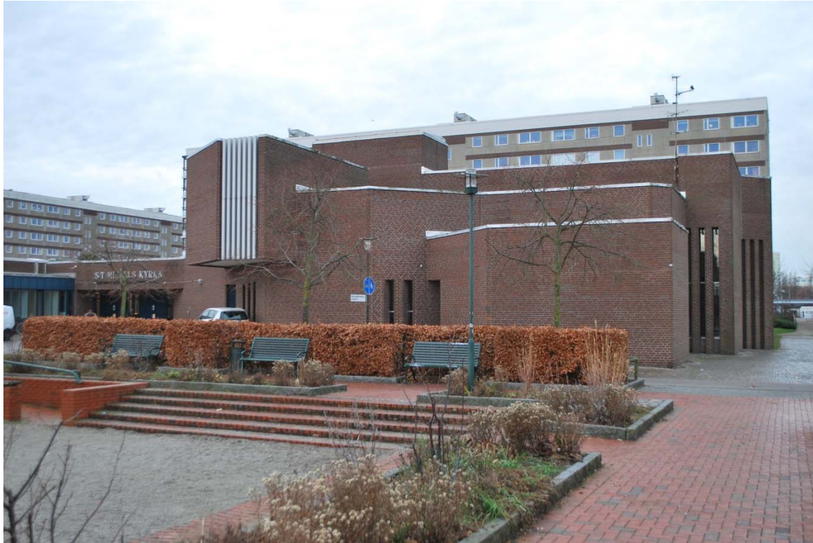
Entréfasad mot öster.