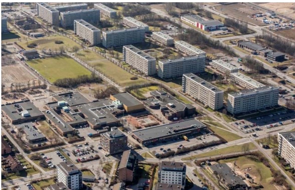
Från nordöst: Flygfoto: Pär-Martin Hedberg

Kyrkan ligger i bostadsområdet Lindeborg i stadsdelen Hyllie i Södra Malmö.