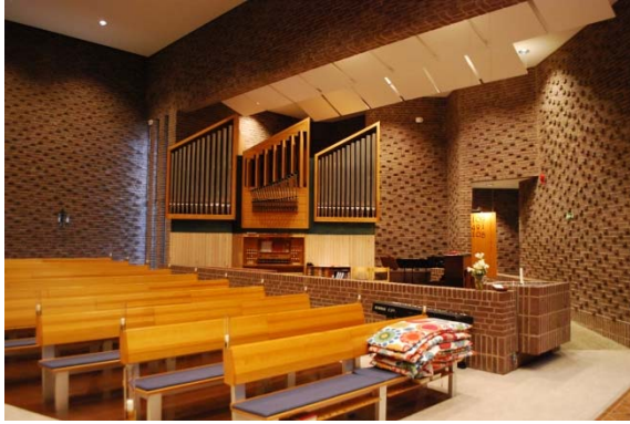
Kyrkorummet mot orgeln.