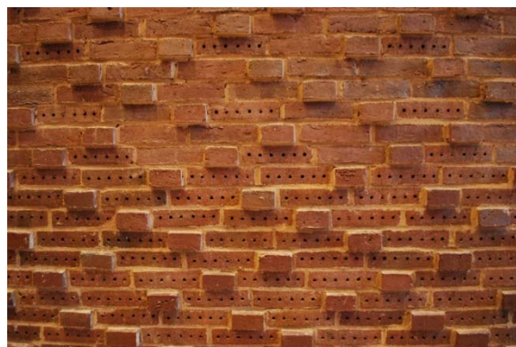
Mur med utkragade koppstenar.

Sakristian har högt i tak med ett ljusschakt som belyser en rundad tegelvägg. På golvet ligger korkplattor. Rummet är möblerat med furualtare och infällt textilskåp. Utanför sakristian finns en piscina, en nisch i tegelmuren.