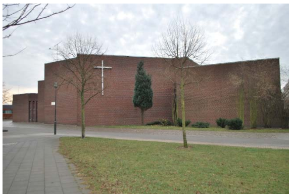
Fasad mot nordväst.

Församlingslokalerna har fönster av blålackerade aluminiumpartier (tidigare träfönster.) Fönsterbanden är vertikalt indelade. I samlingsalen är fönsterväggen indelad med vertikala eloxerade aluminiumpartier.