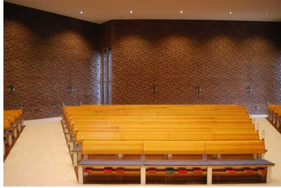
Från koret mot kyrkorummet.

Koret är upphöjt två steg jämfört med gångarna i kyrkan men ligger i samma golvnivå som kappellet. Koret är belagt med oglaserad rustikbrun varierad Höganäsklinker. Tegelmuren bakom altaret skiljer sig från övriga väggar eftersom den är murad i löpförband och fogarna är täckta med bladguld. Ovanför altaret finns ett ljusschakt som belyser väggen. Från taket hänger en lysande blå glasrelief över det runda fristående altaret. Den öppna predikstolen av aluminiumprofiler står till vänster om altaret. Bakom altaret står ett processionskrucifix.