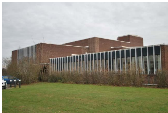
Fasad mot sydväst.