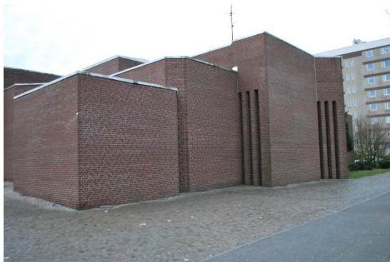
Fasad mot nordöst.