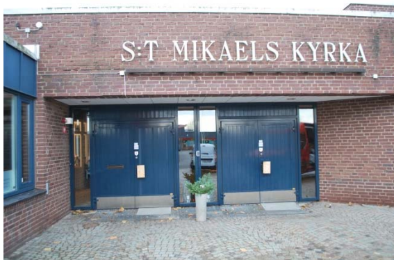
Entré mot öster.