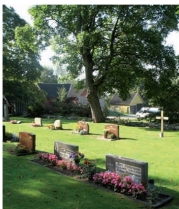
Moderna låga rektangulära vårdar samt vårdar med friare utformning från tiden strax före och efter sekelskiftet 2000