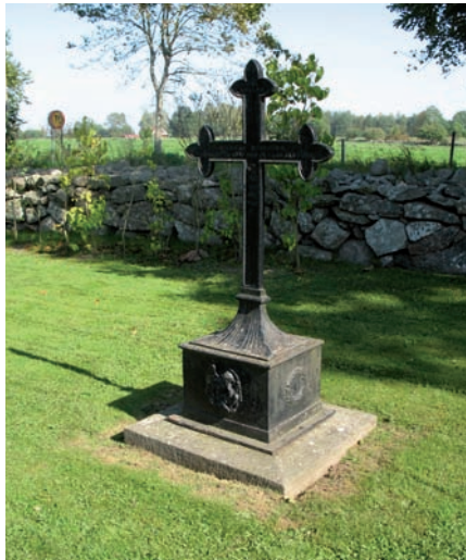
Gjutjärnskors från 1800-talets slut