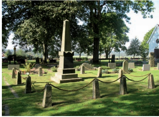
Storslagen diabasobelisk omgärdad av pollare och kätting med avlägsnat grusfält