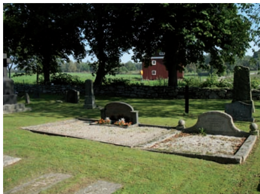
Två bevarade grusgravar med stenomramning