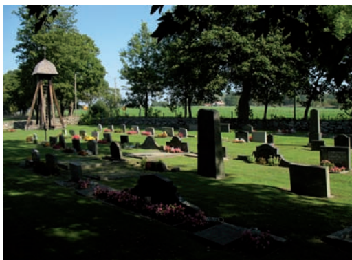
Kvarter IV, vy mot norr

Kvarter IV utgörs av den norra halvan av kyrkogården belägen på kyrkans östra sida. Hela området är frånsett de bevarade grusgravarna bevuxet med gräs. Kvarteret har en stor andel yngre vårdar av enklare utförande, framförallt koncentrerade till områdets norra del. Gravstenarna är placerade i nord – sydligt orienterade linjer men till följd av familjegravarnas stundtals mer omfångsrika utbredning bryts denna symmetri emellanåt. I västra delen av kvarter IV ligger kyrkogårdens minneslund.