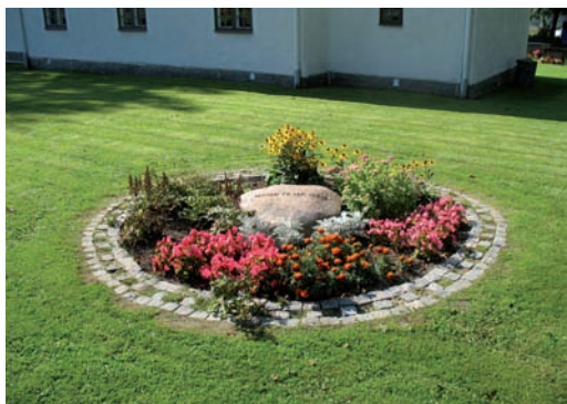
Kyrkogårdens minneslund i nordöst

Kyrkogårdens äldsta gravvård utgörs av en tudelad kalkstenshäll, vilken ligger upplagd på södra kyrkogårdsmuren direkt öster om ingången. Hällen är kraftigt nött och i dess hörn syns spår av huggna dekorationer i form av änglar samt i nederkantens mitt en döskalle med korslagda benknotor. Stenen härrör från 1771 och var tidigare placerad inne i den gamla kyrkan. Stenen påträffades vid de grävningar som skedde i samband med kapellets uppförande 1929.