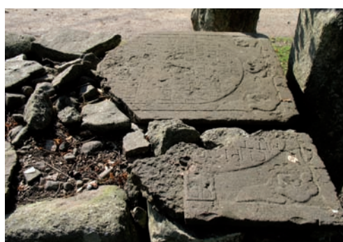
Kyrkogårdens äldsta bevarade gravsten från 1771