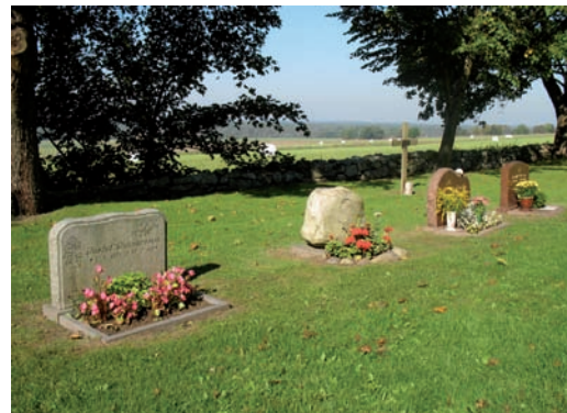
Nyare gravstenar av blandad karaktär i kvarterets norra del