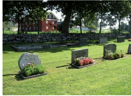
Tre yngre vårdar i kvarterets norra del