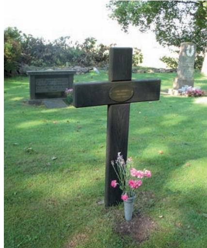
Nyare trävärd med kopparplatta