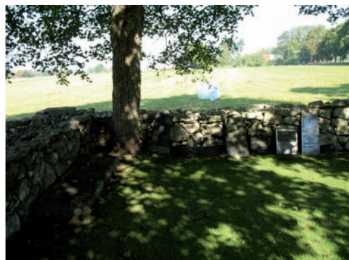
Avlägsnade gravstenar uppställda mot kyrkogårdsmuren