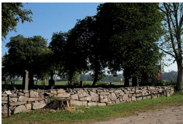
Kyrkogården omges på alla sidor av en vällagd naturstenmur

Kyrkogården har bara en ingång, placerad mitt på den södra kyrkogårdsmuren. Ingången är försedd med en dubbelgrind flankerad av två enkla grindar. Grindarna är utförda i smide med sirliga mönster och bärs upp av huggna granitstolpar. Stolparna i anslutning till dubbelgrinden kröns av varsin glasad kopparlanterna.