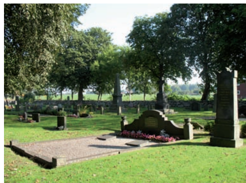
Storslagen familjegrav från tiden strax efter sekelskiftet 1900