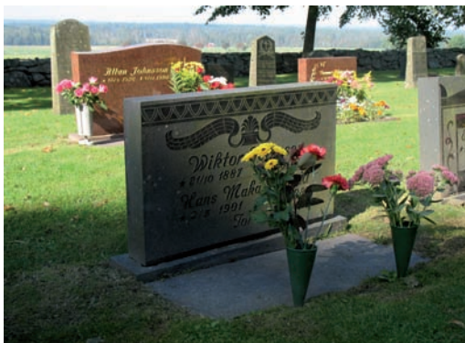
Diabassten med vacker dekor från tiden strax före 1900-talets mitt