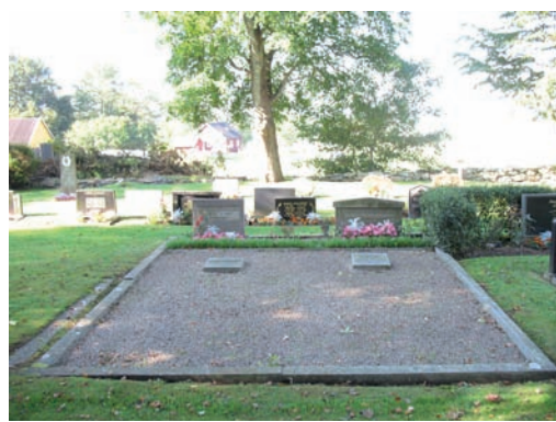
Familjegrav med bevarad stenomramning och grusfält