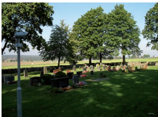
Kvarter II, vy mot norr

Kvarter II är beläget i kyrkogårdens nordvästra del, alldeles väster om kapellet. Hela området är gräsbevuxet med gravstenar i en låg skala där stenarna placerats i enkla, räta rader orienterade i nord – sydlig riktning. I norr och väster avgränsas området av den omgivande kyrkogårdsmuren. I anslutning till kyrkogårdsmurens hörn har man placerat ett antal gravvårdar vilka avlägsnats från kyrkogården då gravrätten löpt ut.