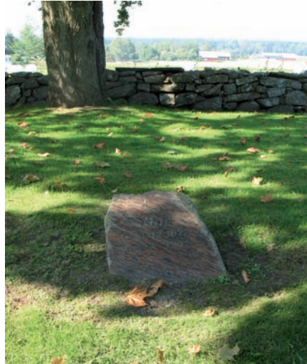
Enkel natursten med polerad framsida från 1900-talets mitt