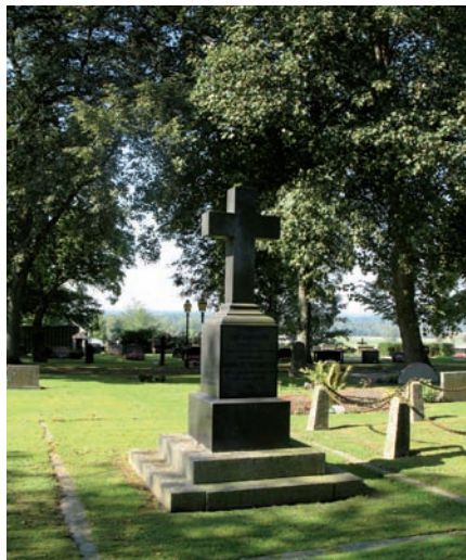
Högrest diabaskors med stenomramning och borttaget grusområde över kyrkovård Erik Danielsson