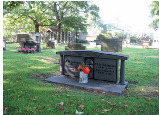
Tidstypisk, antikinspirerad gravvärd från 1900-talets mitt