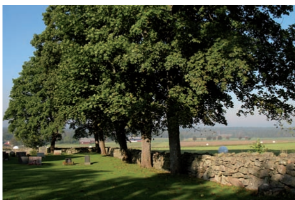
Omgivande trädkrans utmed norra kyrkogårdsmuren