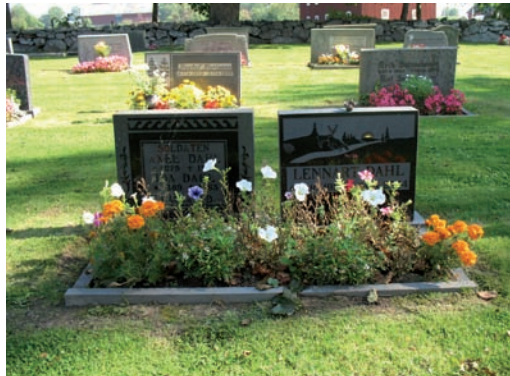
TVå diabasvårdar med bearbetad dekor