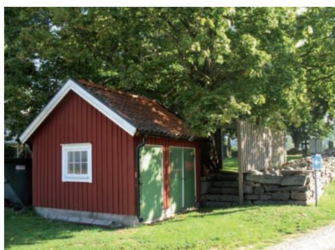
Till vänster: Klockstapel uppförd 1936 Ovan: Material- och redskapsbod