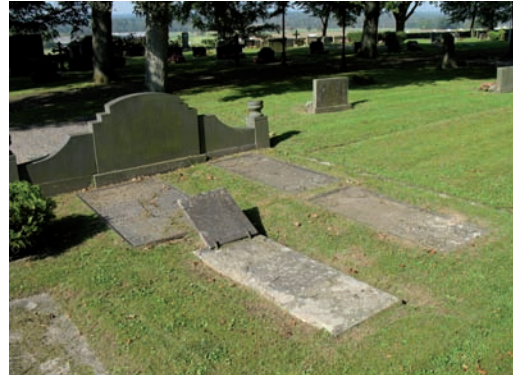
Gjutjärnshällar från 1700- och 1800-talet, troligen tillverkade på Huseby bruk