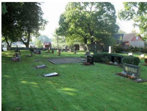
Kvarter I, vy mot söder

Kvarter I är beläget i kyrkogårdens sydvästra hörn och utgörs av ett rektangulärt gräsbevuxet område där gravstenarna är placerade i enkla linjer orienterade i nord – sydlig riktning. I kvarteret finner man ett flertal familjegravar blandat med vanliga enkelgravar.