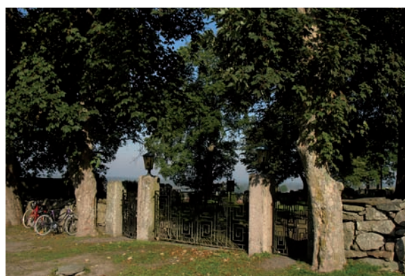
Kyrkogårdens ingång vid södra muren