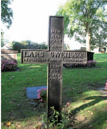
Gjutjärnskors från 1800-talets mitt