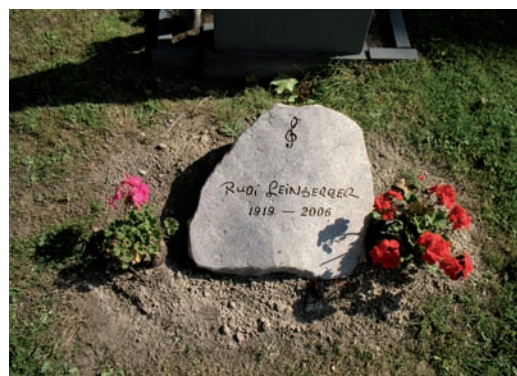
Nyare naturstensvård med en lite otraditionell symbol