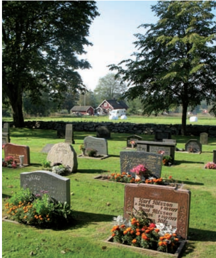
Kvarteret rymmer stenar av varierande ålder, karaktär och material. Här med äldre diabasvårdar i bakgrunden och yngre vårdar i bildens förgrund