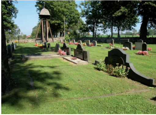
Familjegravar med tidstypiska låga långa vårdar och bevarad stenomramning