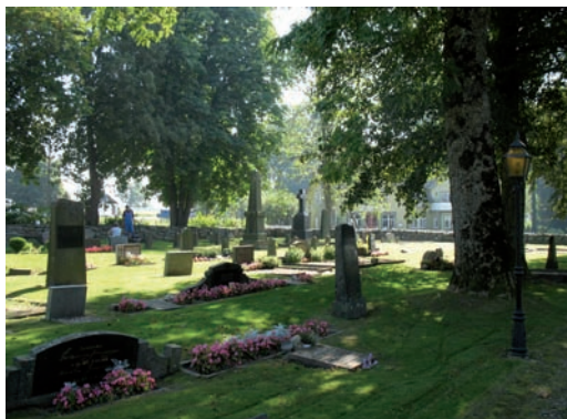
Kvarter III, vy mot söder

Kvarter III omfattas av det gräsbevuxna området beläget i kyrkogårdens sydöstra hörn och rymmer en väldig blandning av gravvårdar med de äldst bevarade mer storslagna, monumentala vårdarna placerade i kvarterets södra del. Den norra delen rymmer ett stort antal familjegravar med låga långa vårdar och stenomramat, framförliggande grusfält. Gravstenarna är placerade i nord – sydligt orienterade linjer men till följd av familjegravarnas stundtals mer omfattrika utbredning bryts denna symmetri emellanåt.