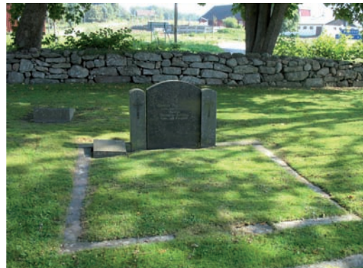
Låg rektangulär diabasvård med stenomramning