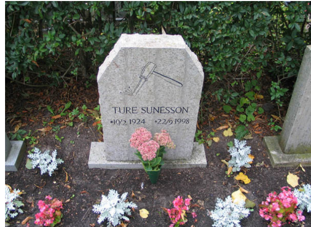
Efter att ha varit omodernt under en tid börjar det nu på nytt bli vanligare att ange den dödes yrkestitel. Nu mera görs det dock ofta med hjälp av bilder. Här en stenhuggares gravvård. (KI Borgholm kyrkog 030)