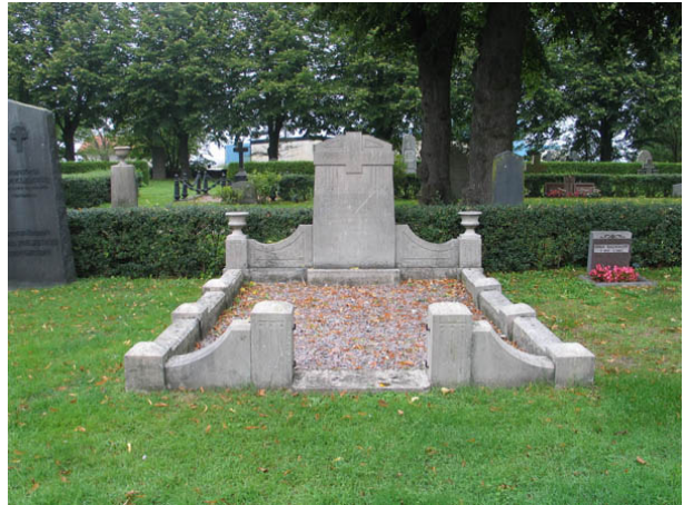
Påkostat gravplatsarrangemang med stenram, urnor och grusbeläggning. Vården är över kronfogden ? som dog 1921. (KI Borholm kyrkog 015)