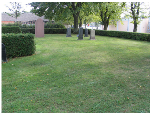
Resterna av det ursprungliga S:t Elavi kapell i sydvästra hörnet av den äldsta delen av kyrkogården. En svag, rektangulärt formad förhöjning i marken kan ses. (KI Borgholm kyrkog 057)