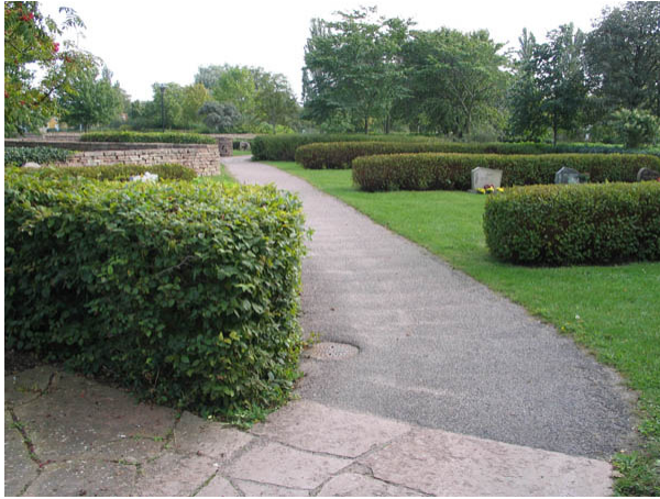
1990-talets utvidgning av kyrkogården från norr. (KI Borgholm kyrkog 045)

genom området, låga murar och rygghäckar hjälper till att dela in området i mindre rum. Gravvårdarna är placerade i ryggställda rader i vinkel mot gången. Häckarna är bl.a. av spirea, avenbok och måbär. Området har en modern karaktär med en mjukare anläggningsform och större avskildhet.