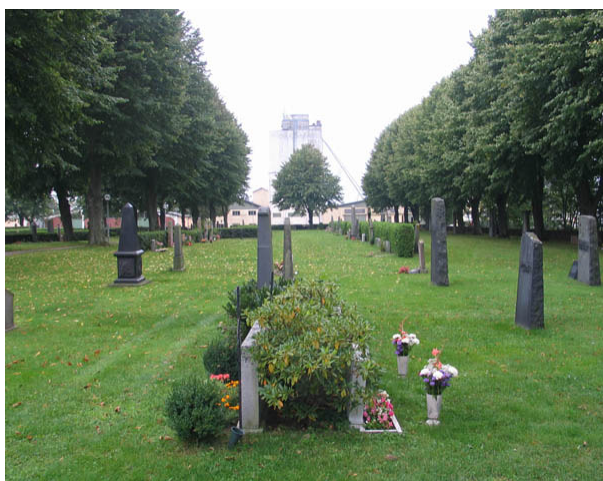
Norra delen av kyrkogårdens äldsta del från öster. (KI Borgholm kyrkog 024)

Den äldsta delen av kyrkogården är ett rektangulärt område i kyrkogårdsområdets västra del. Upplevelsen av områdets långsträckt karaktär förstärks av den gång kantad av höga lindar som delar området i en nordlig och en sydlig del samt genom gravvårdarnas placering i ryggställda rader. Mellan dessa rader är häckar av tuja eller liguster planterade. Samtliga gravvårdar är vända mot norr eller söder. I områdets västra och östra del står vårdarna i rader utan rygghäckar. Här är majoriteten av vårdarna vända mot söder. Området har genomgått flera genomgripande förändringar. Gravplatserna var tidigare belagda med grus men alla utom två är idag insådda med gräs. Raderna med gravvårdar har troligen rätats upp och rygghäckarna har planterats. Ursprungligen ska här ha funnits linjegravsområden men av dessa ser man idag inga spår. Det tydligaste tecknet på områdets ålder är de äldre gravvårdarna som i flera fall är mycket framträdande.