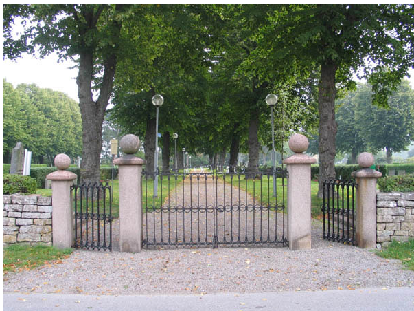
Kyrkogårdens ingång i väster. (KI Borgholm kyrkog 001)