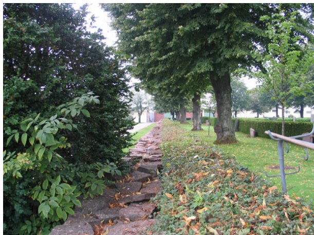
Kyrkogårdsmur, häck och trädkrans omgärdar den äldsta delen av kyrkogården. Här den södra sidan från öster. (KI Borgholm kyrkog 012)