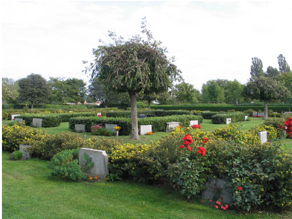
En del av området från 1950-talet är anlagt i rektanglar där gravvårdarna är ryggställda med häckar t.ex. ölandstok och lagerhägg är planterade. I en av rektanglarna är sorgaskar planterad i hörnen. (KI Borgholm kyrkog 036)

häckarna är låga har man en god överblick över området. Detta i kombination med de låga gravvårdarna ger området en regelbundenhet.