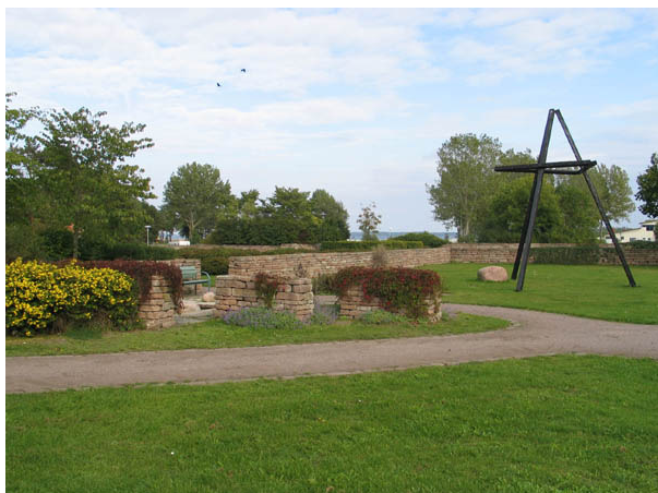
Ceremoniplatsen i norra delen av kyrkogårdsparken. (KI Borgholm kyrkog 048)