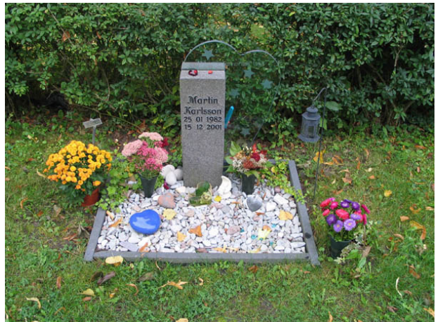
Modern gravvård av glas och sten. Att smycka gravplatsen med blommor, lyktor, stenar, små skulpturer, leksaker m.m. blir allt vanligare. (KI Borholm kyrkog 026)

Majoriteten av vårdarna är av svart eller grå granit men även röd förekommer. Det är också vanligt med vårdar av kalksten. Utöver dessa material finns en vård av sandsten och marmor, tre av marmor, ett gjutjärnskor, två av smide, två av sten och glas samt en mycket ovanlig gravvård av kalksten med en mosaikinläggning. Troligen har samtliga äldre familjegravplatser tidigare varit omgärdade och belagda med grus. Idag finns endast två av dessa kvar. Den ena,