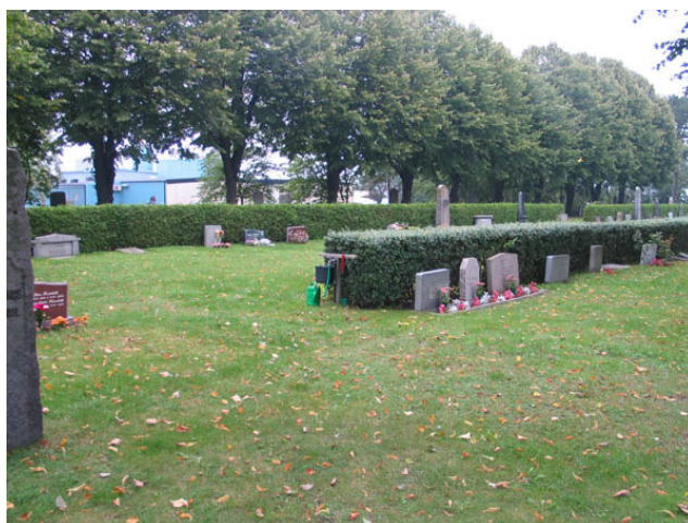
Norra delen av kyrkogårdens äldsta del från väster. (KI Borgholm kyrkog 029)