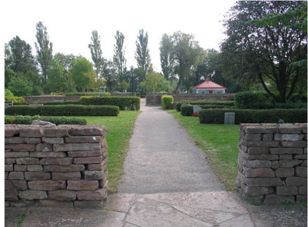
Kalkstenmurar avdelar den nya kyrkogårds delen i flera rum. Söder om kyrkogården, i fonden syns en av vaktmästeriets byggnader. (KI Borgholm kyrkog 046)