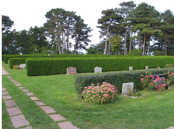
På området från 1920-talet står gravvårdarna ryggställda mot häckar av tuja. (KI Borgholm kyrkog 035)

Vårdarna är vända mot norr eller söder. Eventuellt kan man i de södra delarna av området se rester av ett linjegravsområde men det är inte helt klarlagt. Karaktären är enkel och enhetlig.