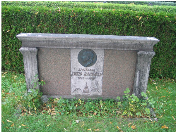
Gravvård över apotekare Bäckman död 1947. Vårdens utformning är typisk för sin tid fränsett porträtt medaljongen. (KI Borholm kyrkog 017)