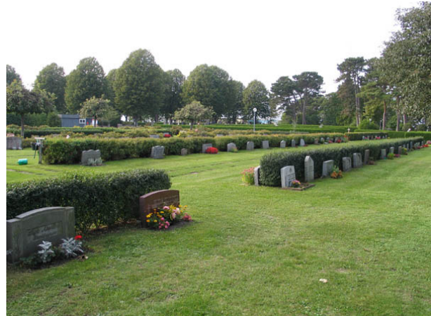
Området från 1950-talet fotograferat från sydost. Gravvårdarna är låga och har en enkel dekor vilket är typiskt för 1900-talet andra hälft. (KI Borgholm kyrkog 040)