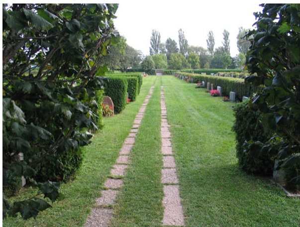
Gång från minneslundan mot söder. Kalkstensflisor har lagts som två spår i gräsmattan. Gången är rak och anslutande gånger möter i räta vinklar. (KI Borgholm kyrkog 042)

På den äldsta delen av kyrkogården finns en gång från ingången i väster fram till gränsen mot 1920-talets utvidgning. Denna gång är belagd med grus. Gången viker av i rät vinkel och fortsätter söderut fram till vaktmästeriet. Den är i norr belagd med grus men övergår till att markeras av två rader med kalkstensplattor i gräsmattan. Ytterligare en gång går söderut från minneslundan. De båda sist beskrivna gångarna binds samman av två gånger i nord-sydlig riktning. Även dessa markeras av två rader med kalkstensplattor. På kyrkogårdsområdet från 1990-talet förbinds del olika delarna av området med asfalterade gånger.