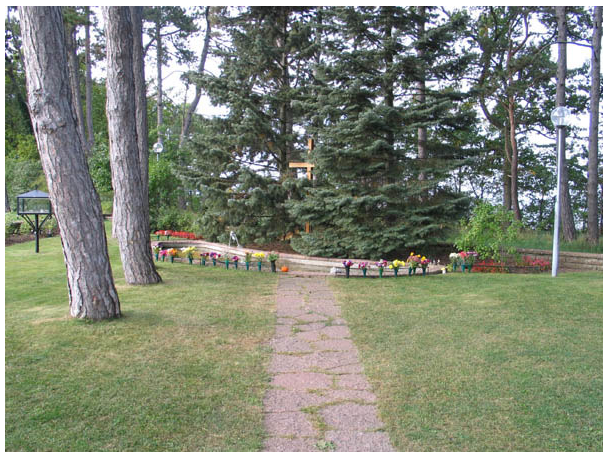
Minneslunden från söder. (KI Borgholm kyrkog 043)