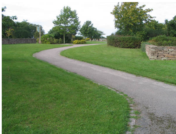
Asfalterad gång genom kyrkogårdsparken i kyrkogårdens östra del. Här slingrar sig gångarna fram. (KI Borgholm kyrkog 050)