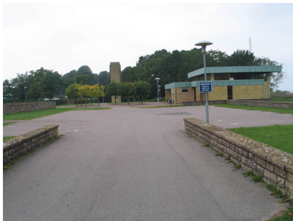
S:t Elavi kapell, klockstapeln och ingången till kyrkogården i öster. (KI Borgholm kyrkog 006)